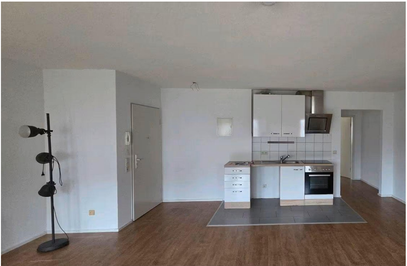
Wohnz., blick auf Küchenzeile