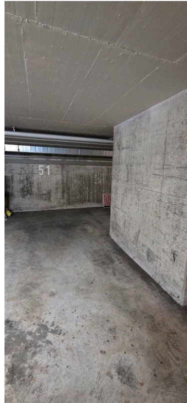
Stellplatz in der Garage