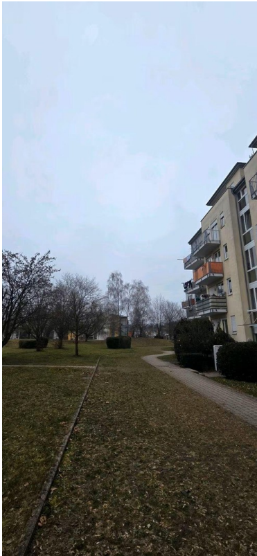
Weg zum Hauseingang