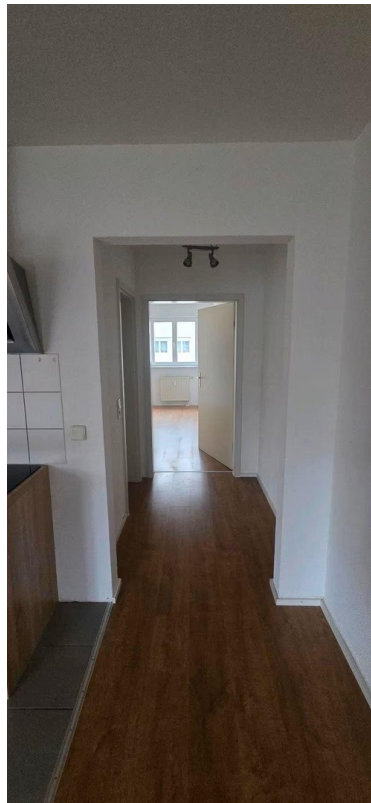
Blick zum Schlafzimmer