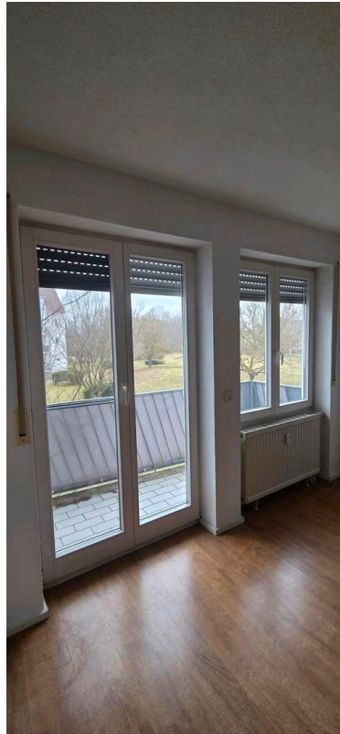
Blick zum Balkon