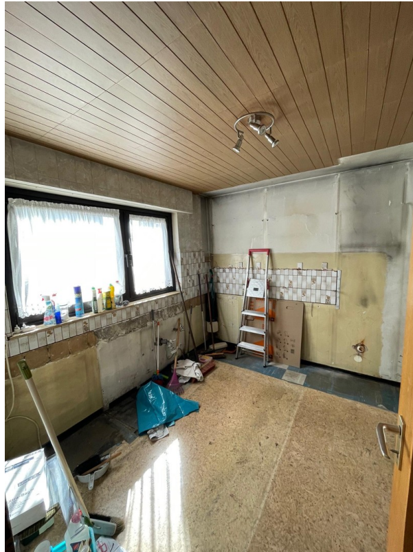
Küche im EG