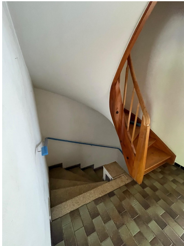
Treppenhaus in das UG