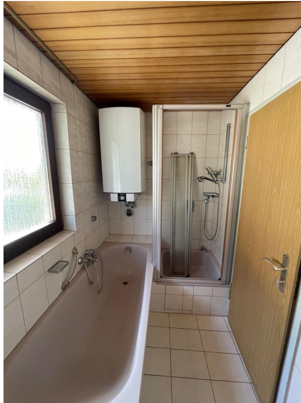
Dusche-Badewanne im OG