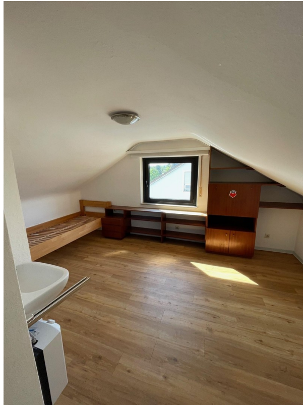
Zimmer im DG, Bett nicht dabei