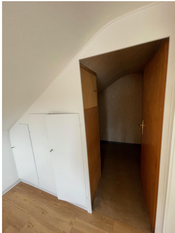
Abstellraum im DG