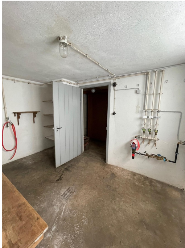
Waschküche mit Wasserinstall.