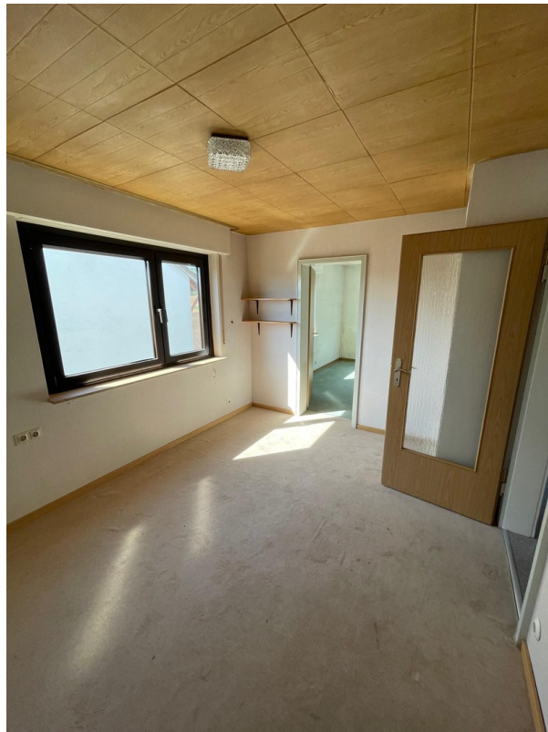
Zimmer im OG