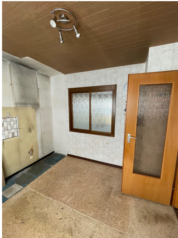
Küche im EG