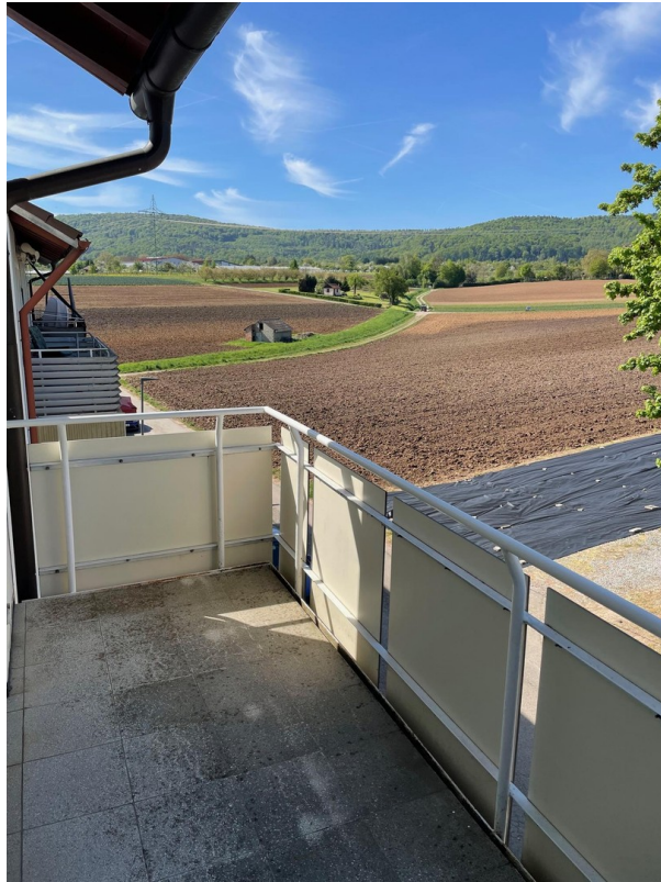
Balkon im OG