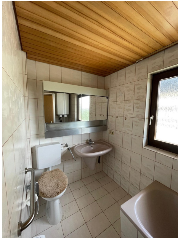
Bad im OG