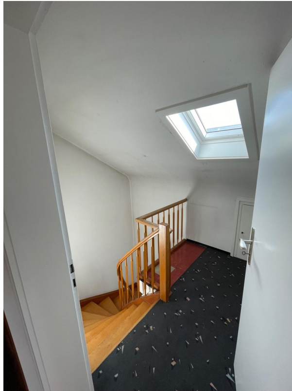
Treppenhaus vom DG aus