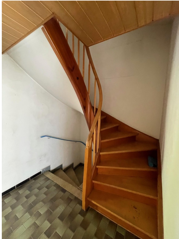
Treppenhaus ins OG