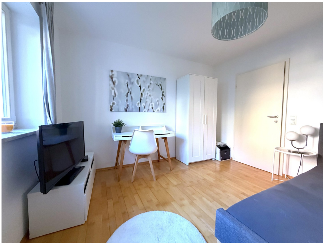
Schlafzimmer rechte Seite