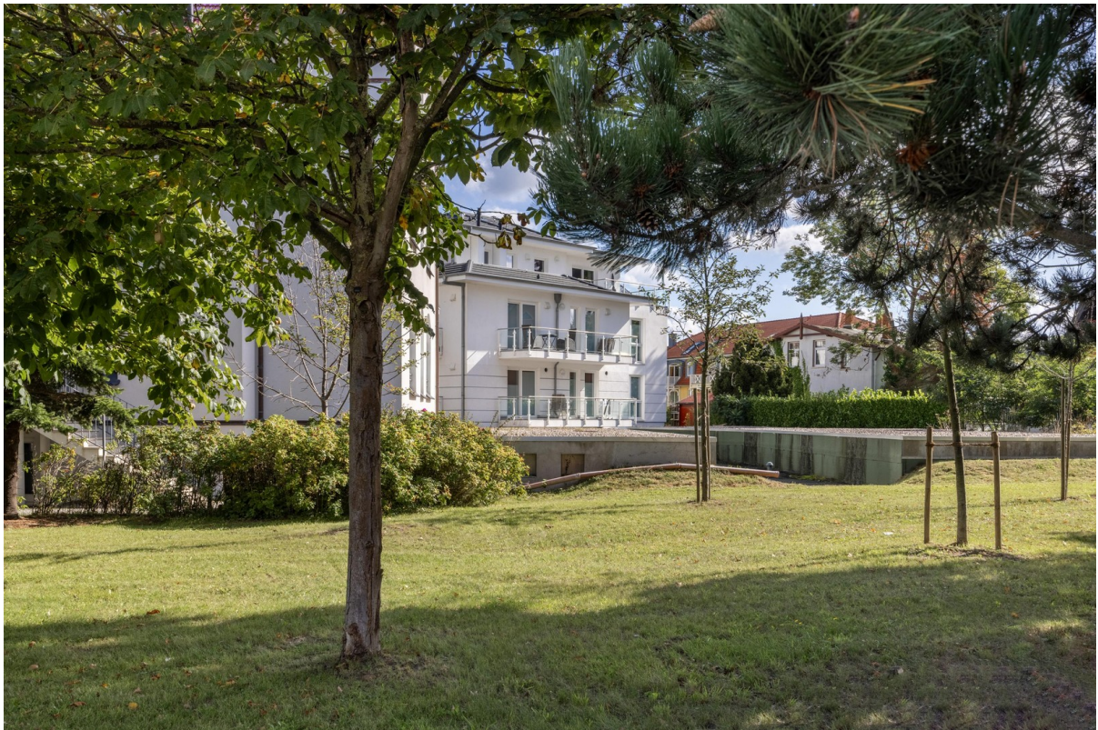
Villa Siegfried aus West