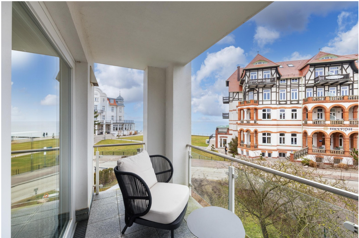
Balkon mit Ostseeblick