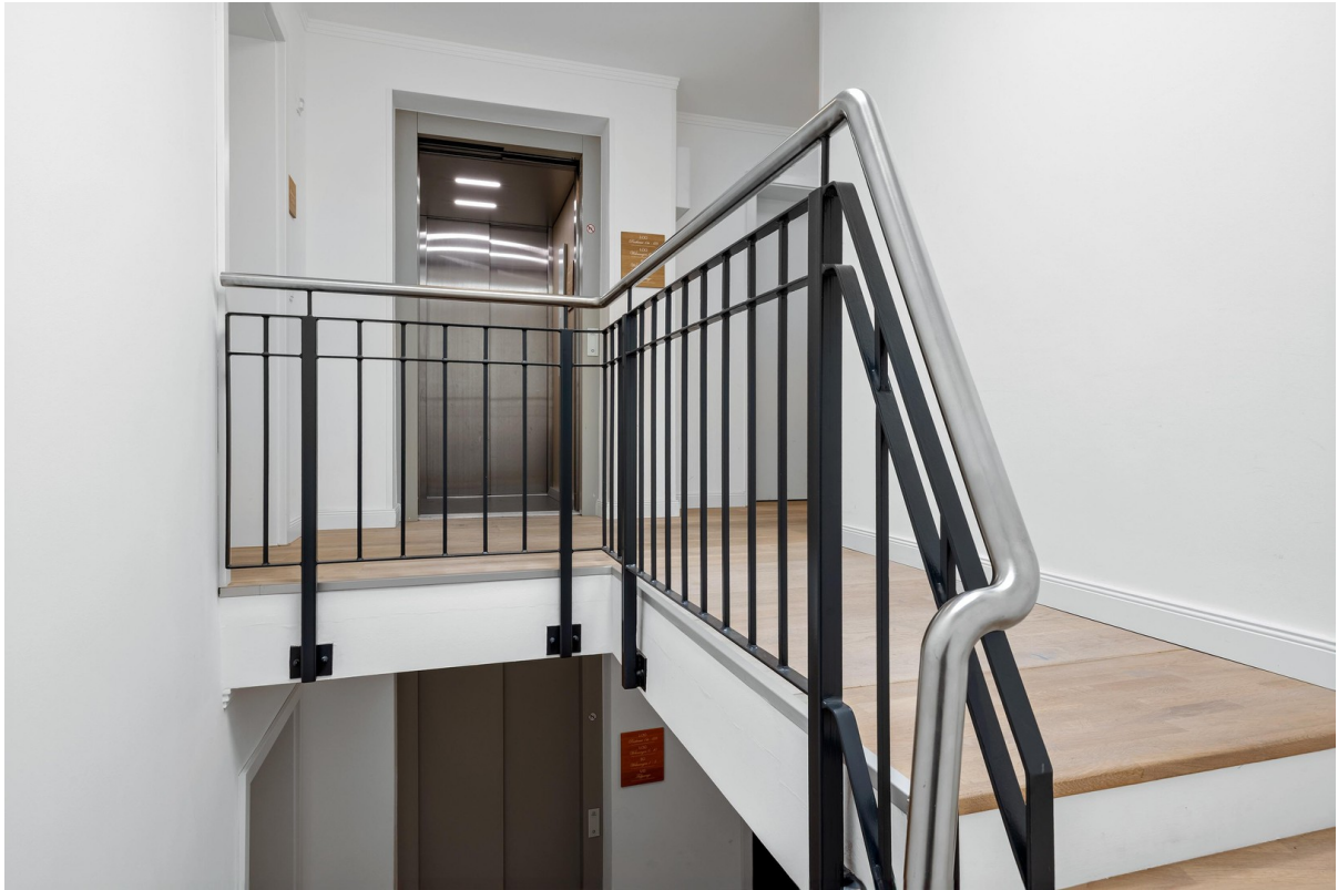
Treppenhaus mit Lift