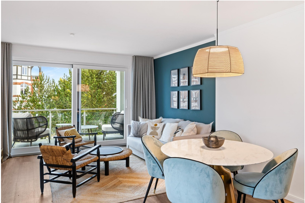
Essen mit Wohnen