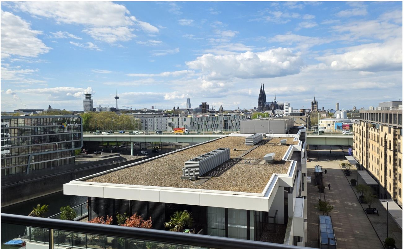
Blick vom Balkon Richtung DOM