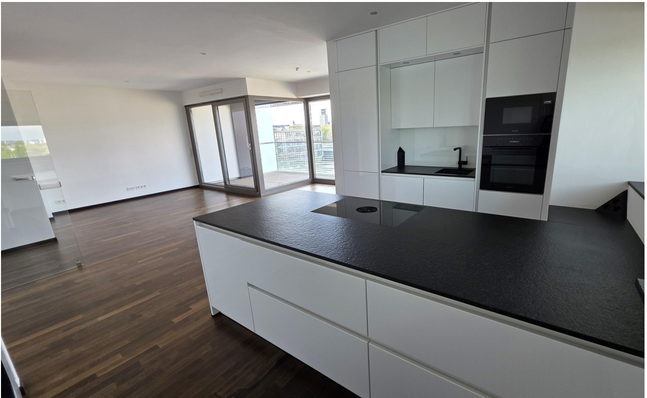
Blick v Küche ins Wohnzimmer