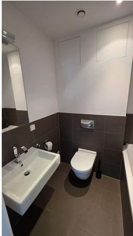
Gäste WC mit Badewanne