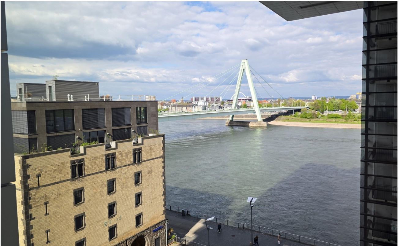
Blick zum Rhein