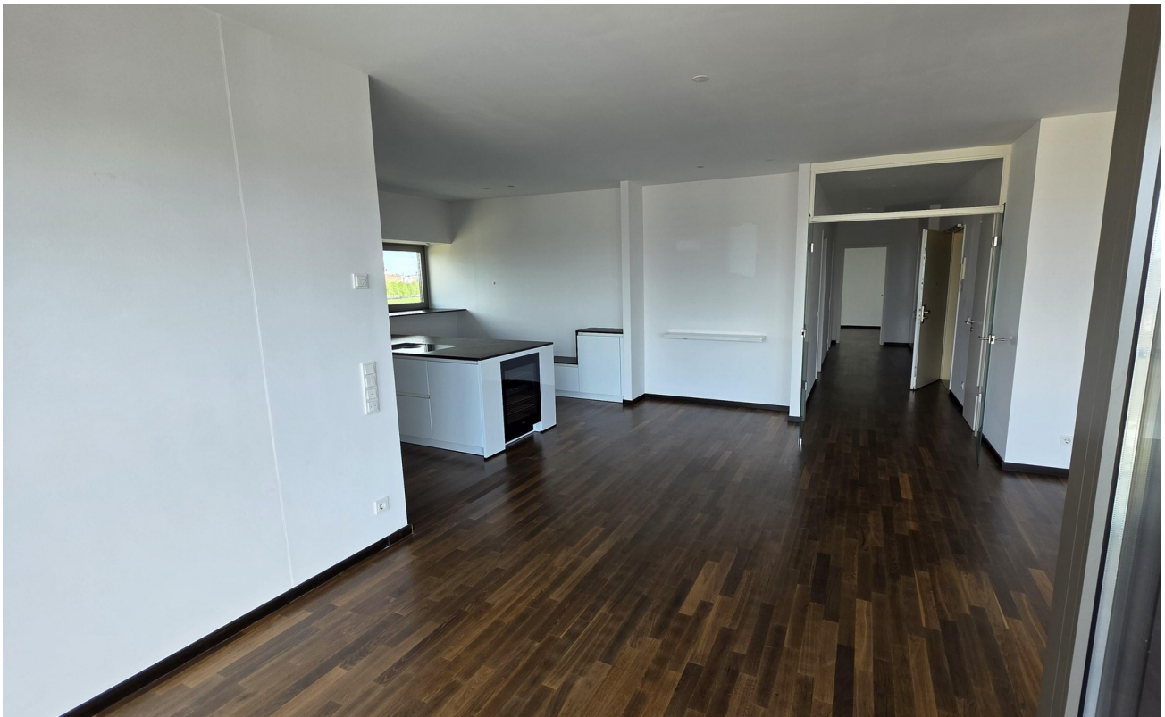
Wohnzimmer m offener Küche