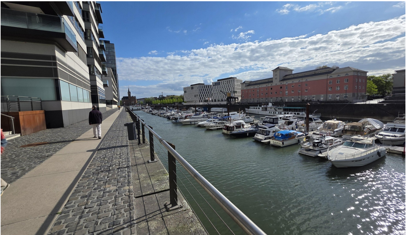
Rückseite der Rheinhafen