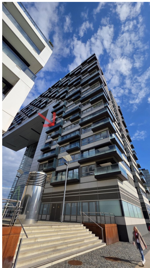
Lage siehe Roter Pfeil