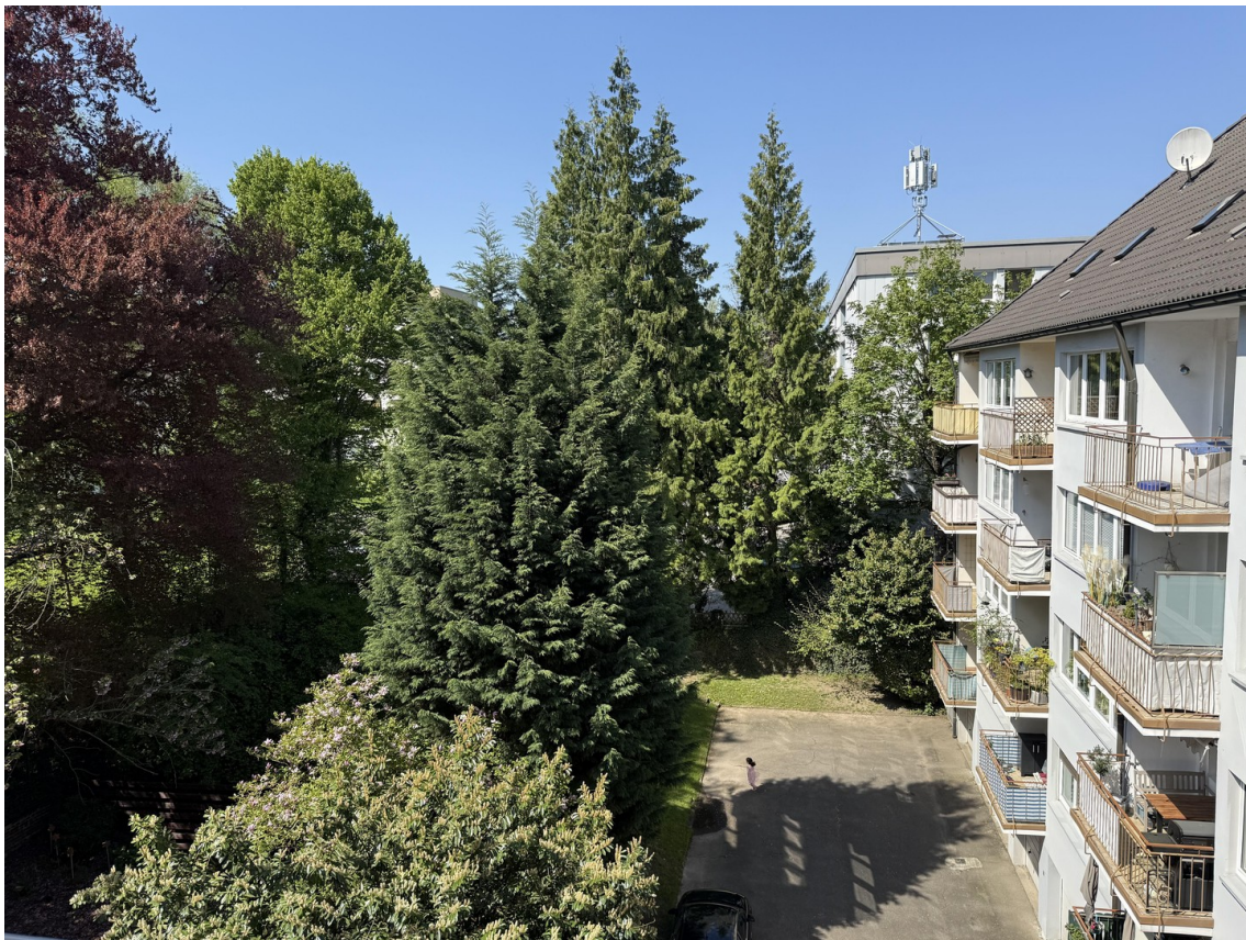
Balkonausblick zum Hinterhof