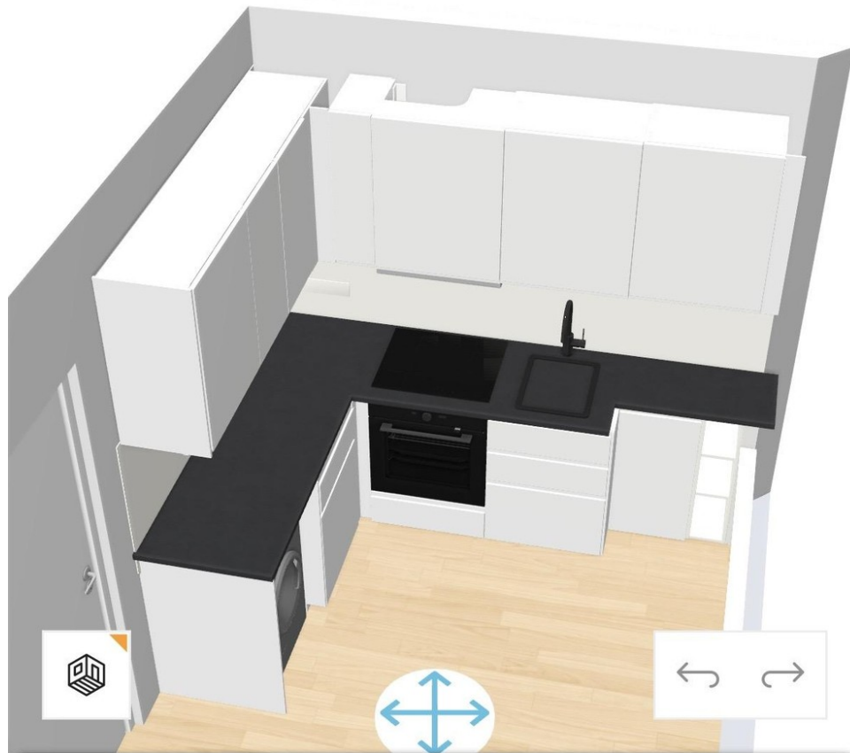
Küche ab Mitte Mai