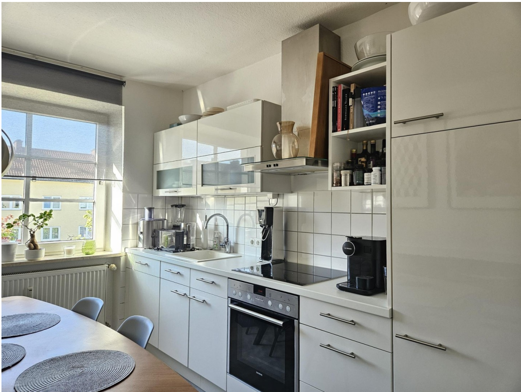
Küche zur Ablöse