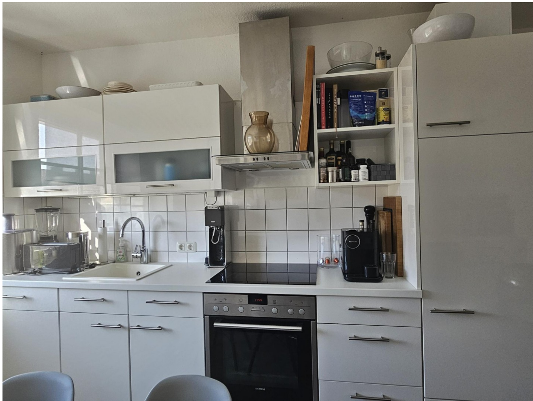
Küche zur Ablöse