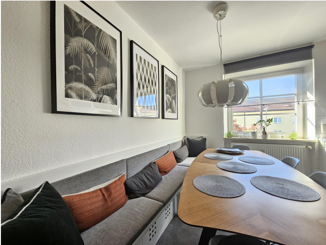
Sitzbank mit Tisch