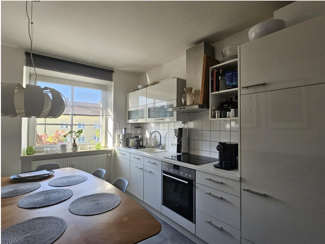
Küche zur Ablöse