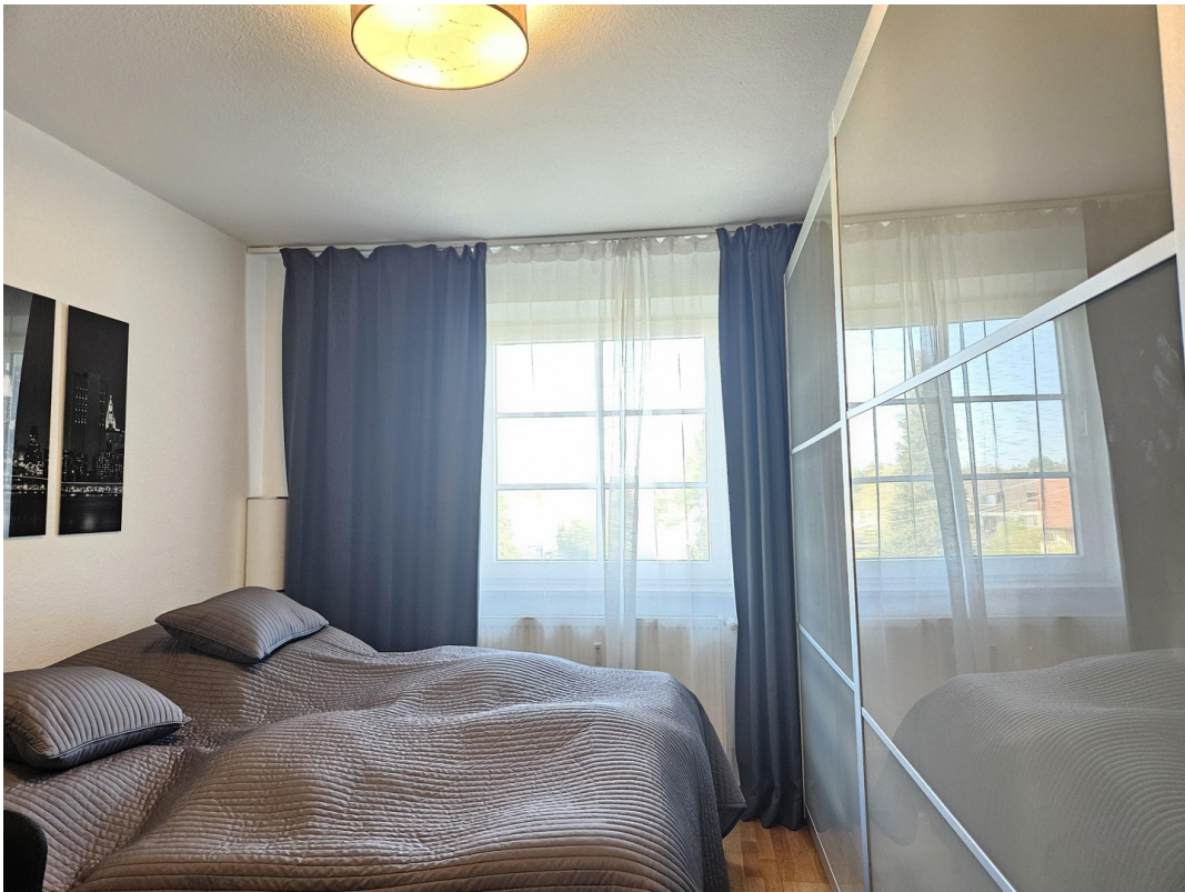
Schlafzimmer mit Schrank