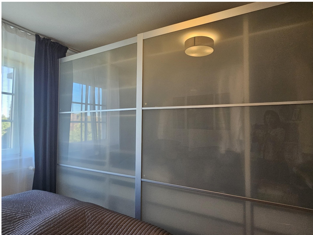
Schrank zur Ablöse