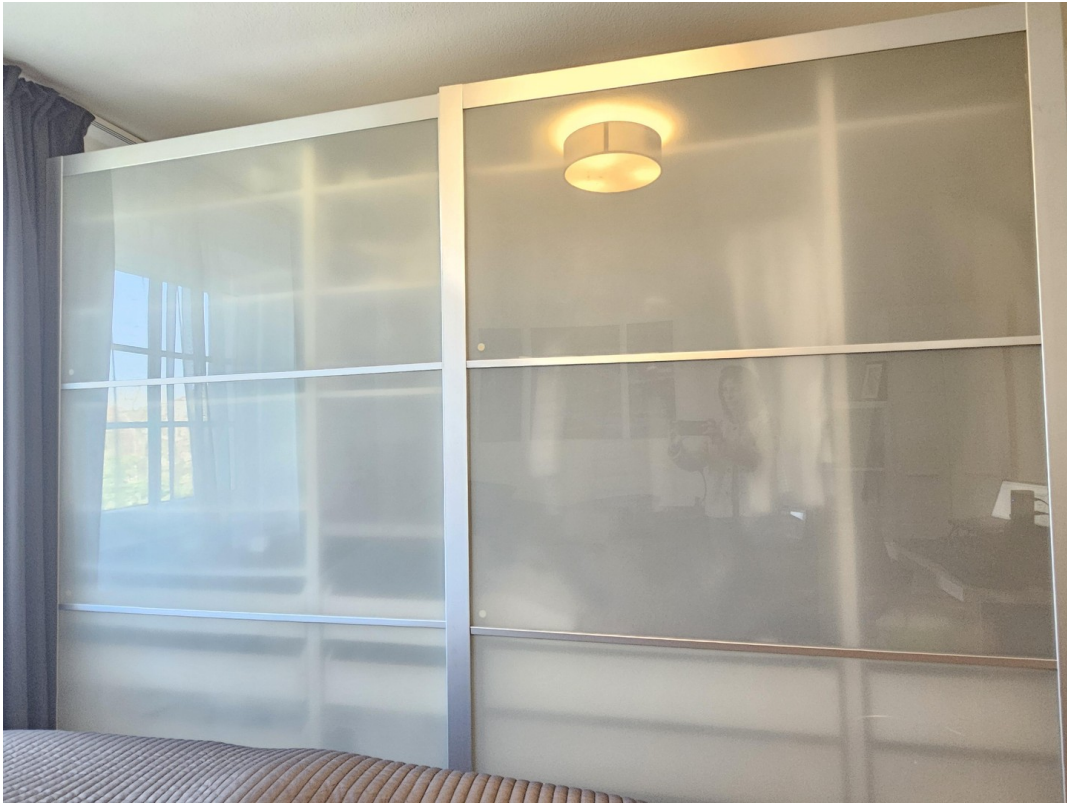
Schrank zur Ablöse