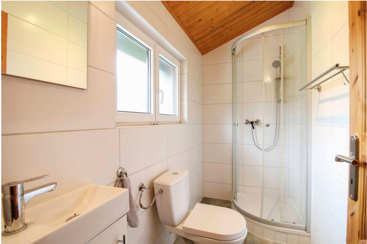
Gästebad im Erdgeschoss