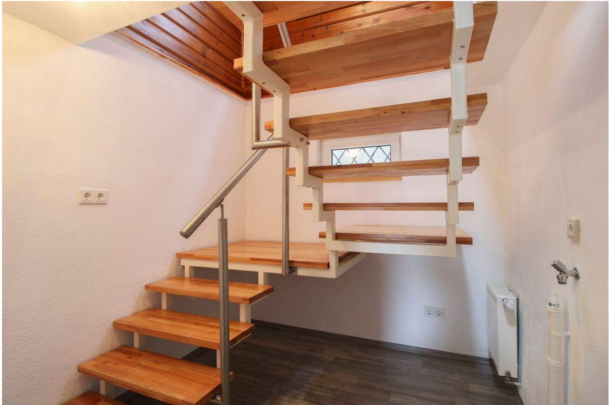
Treppe ins Untergeschoss