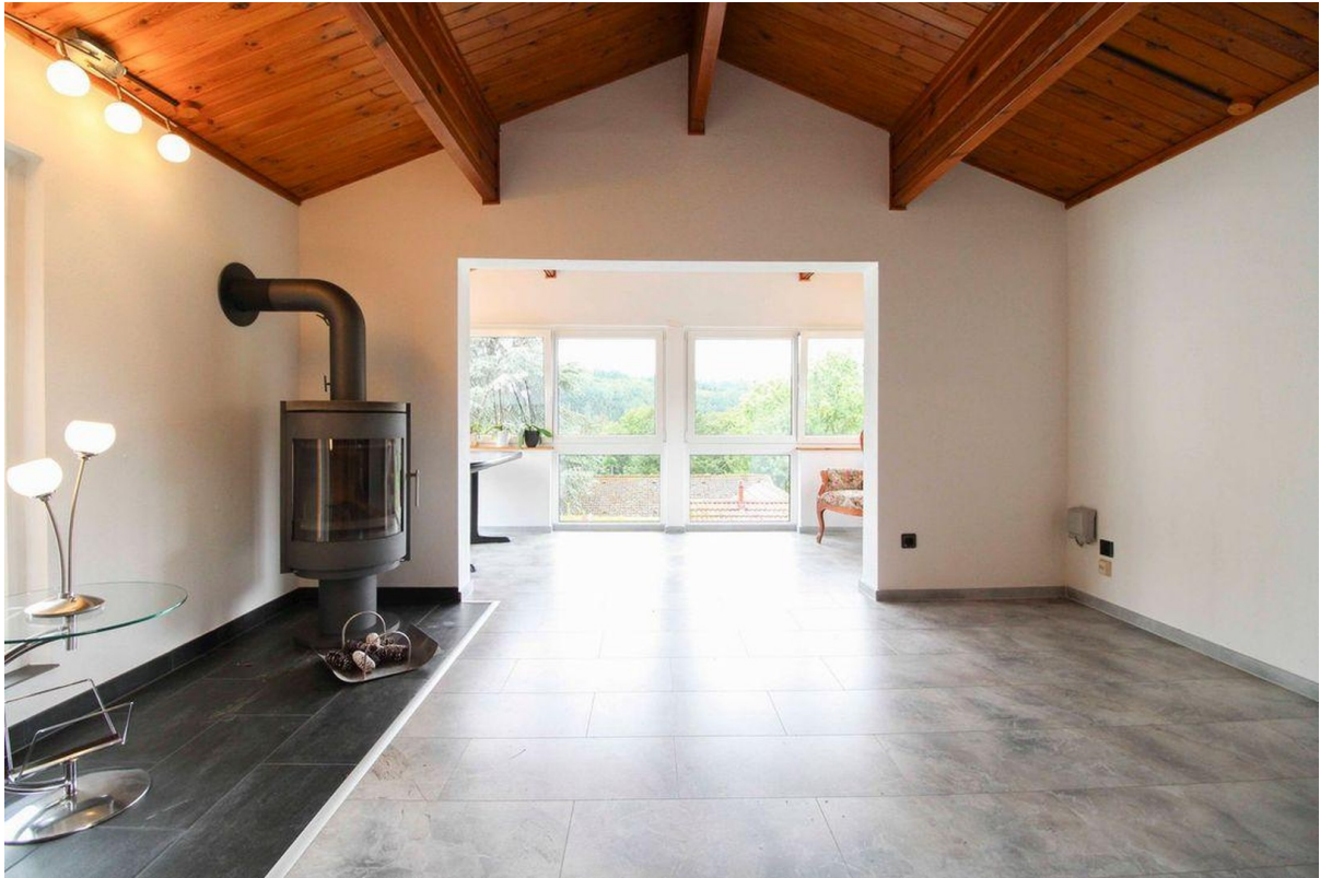
Wohnzimmer mit Kaminofen