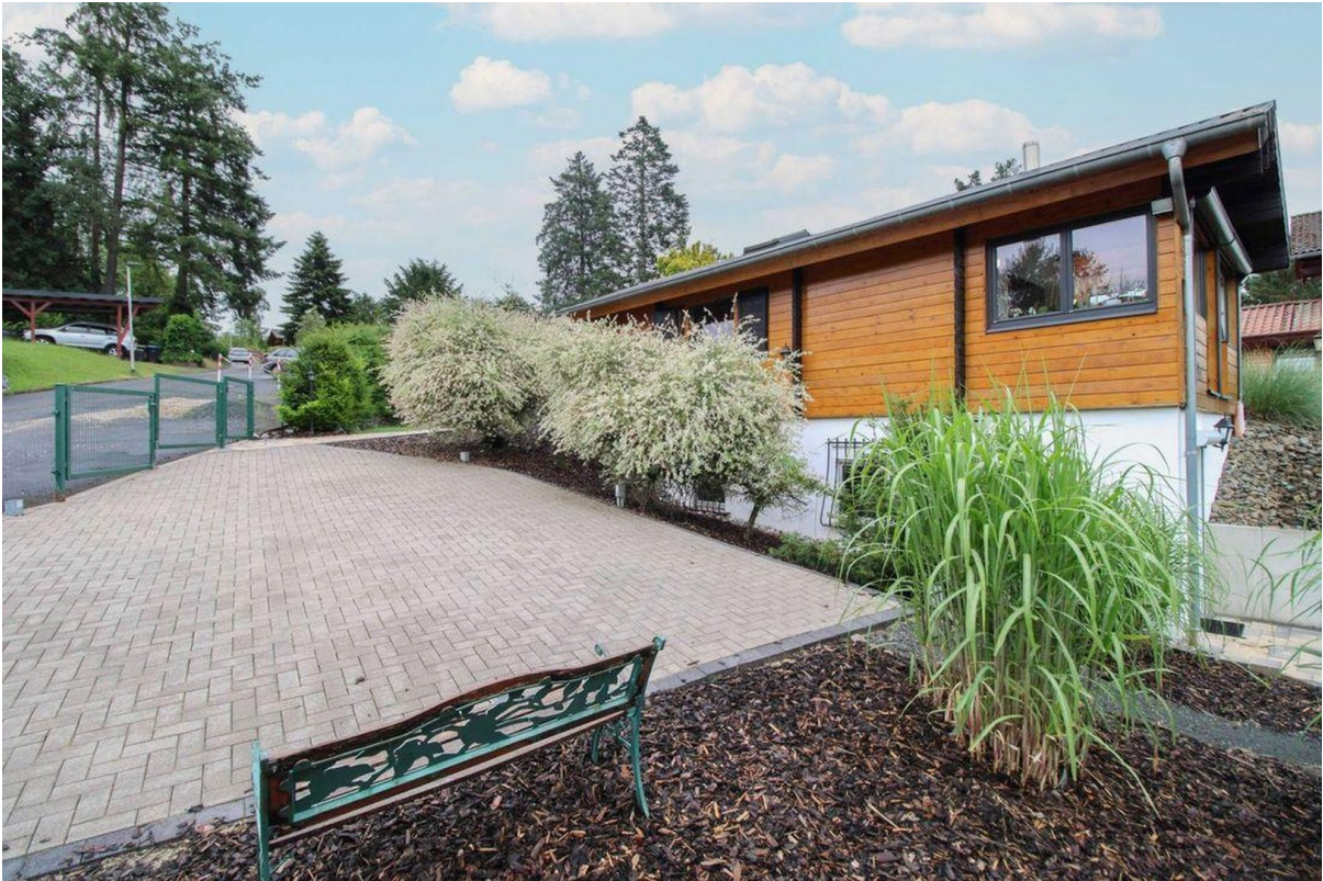
Parkplatz für 2 PKW