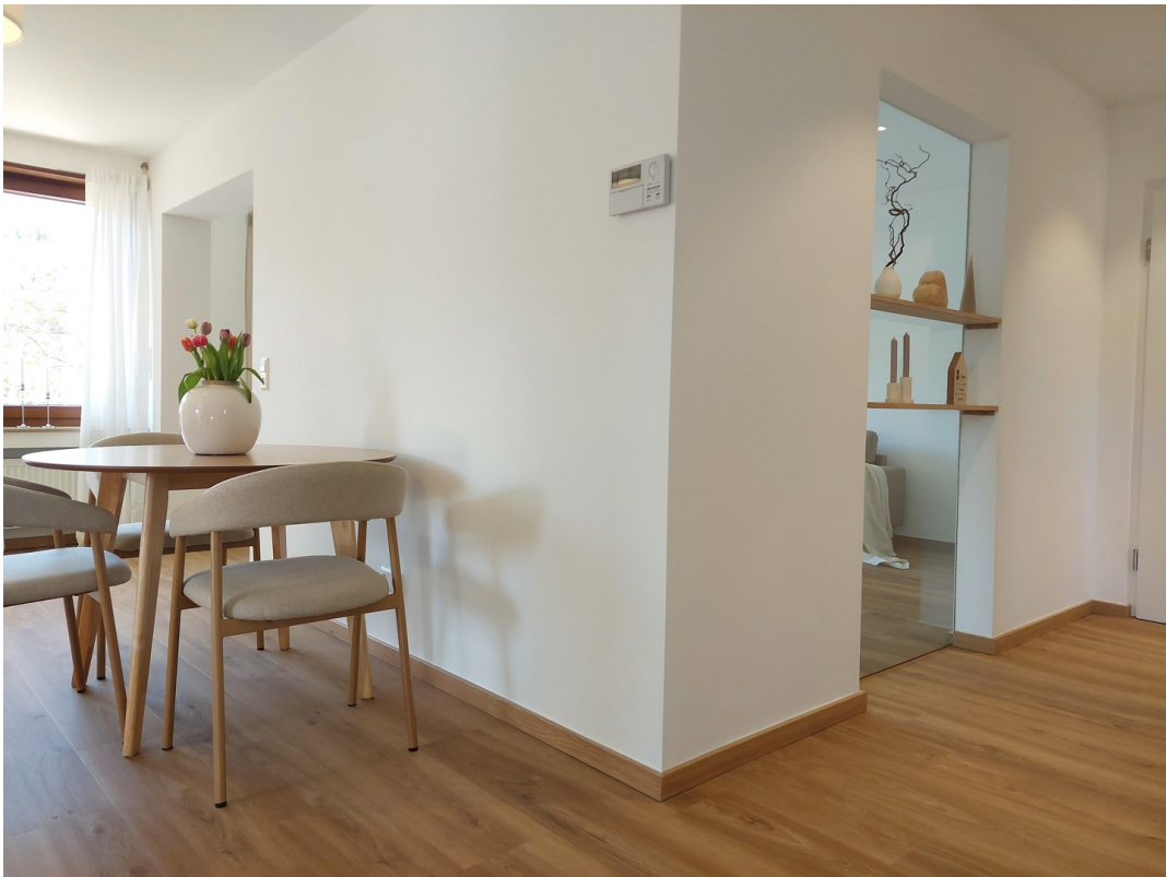
Esszimmer & Flur