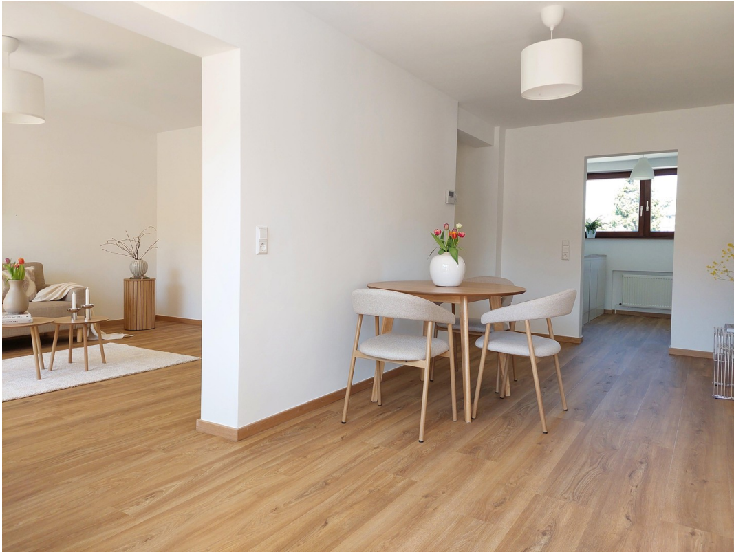
Esszimmer & Flur