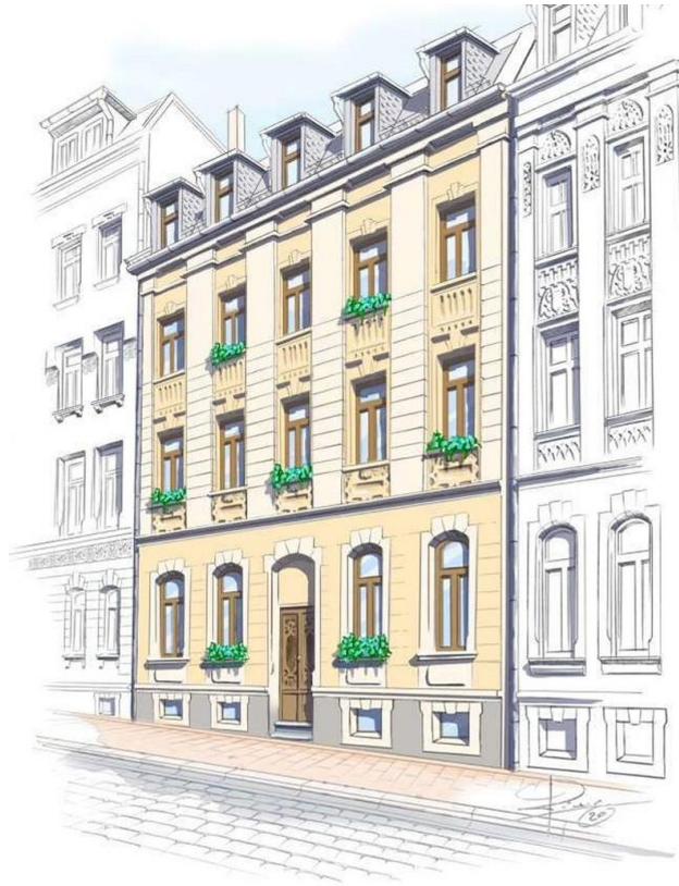
Plauen • Leißnerstraße 72