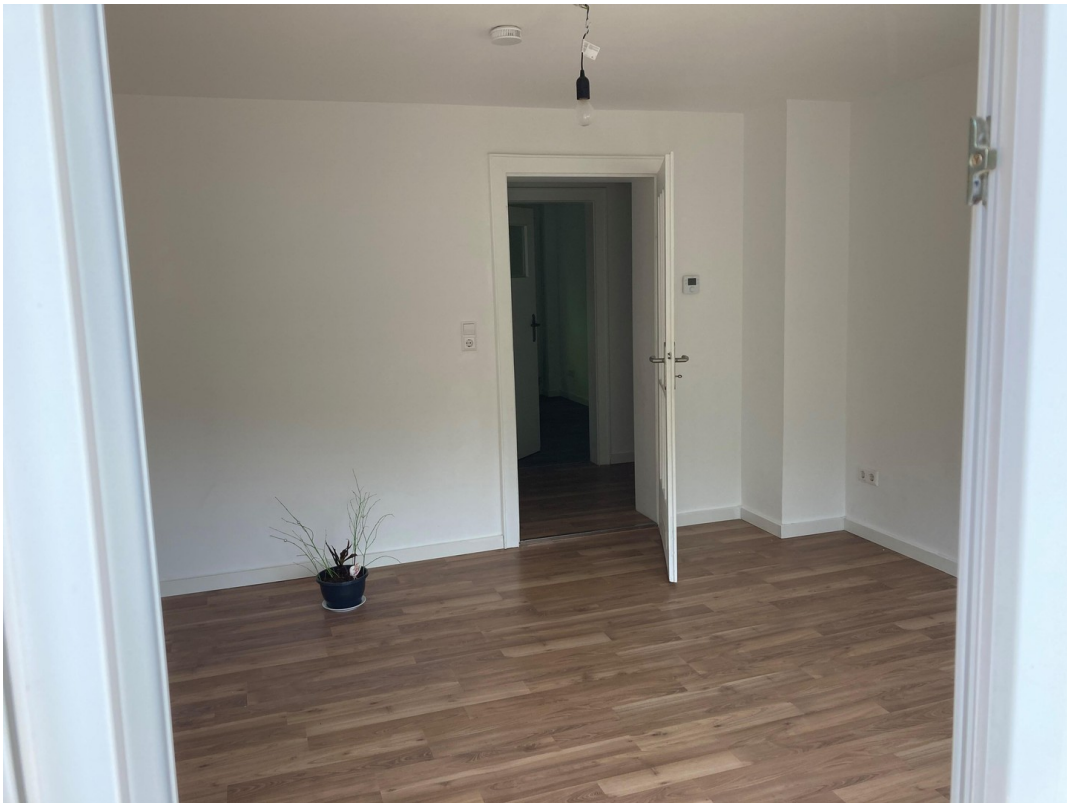
Wohnzimmer vom Balkon aus