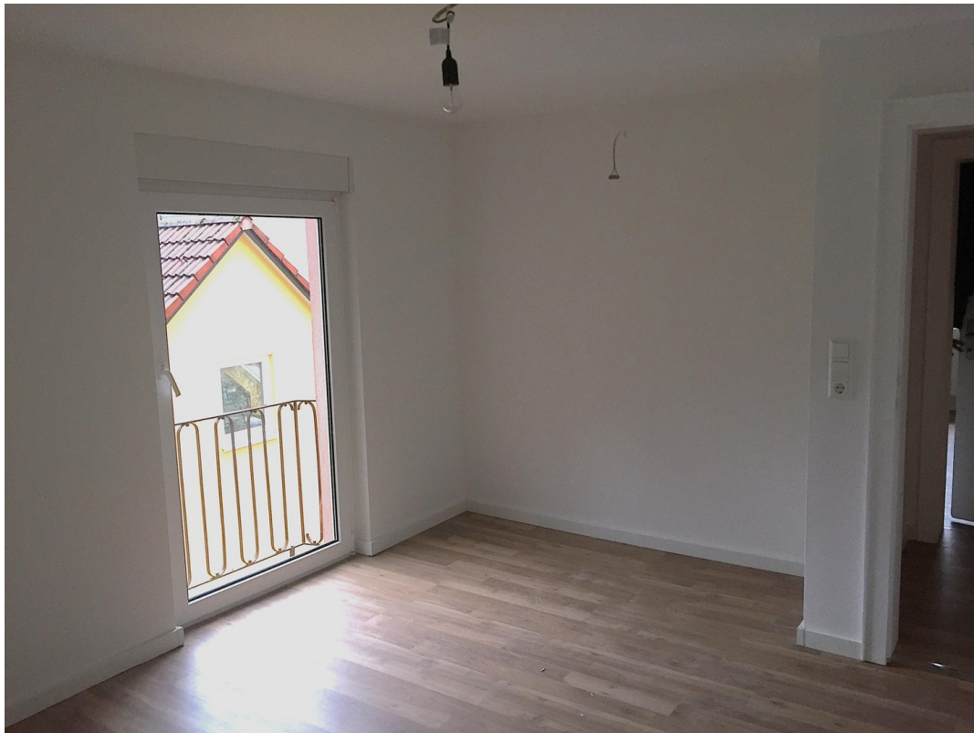
Schlafzimmer 2 Blick West