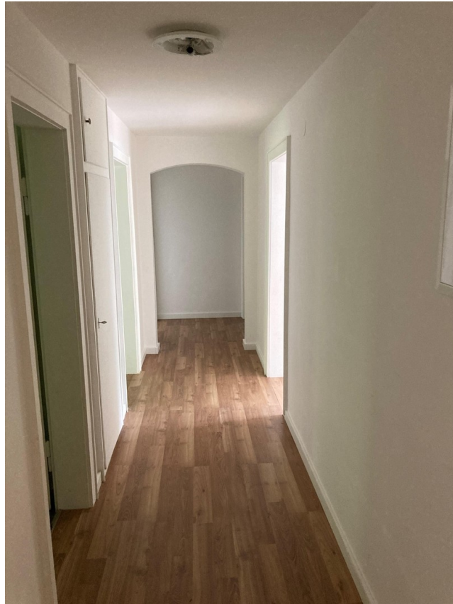
Flur Blick von Wohnungseingang