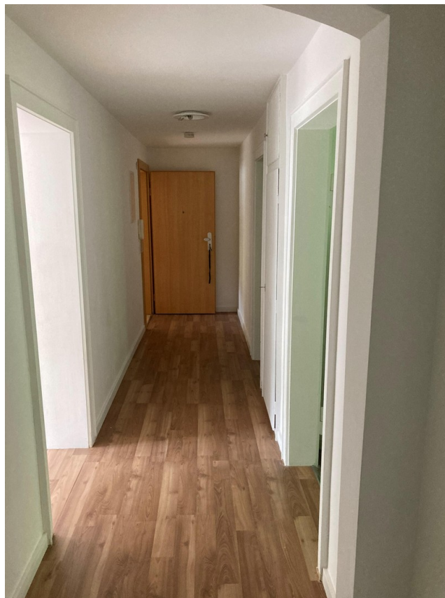
Flur - Blick zur Wohnungstür