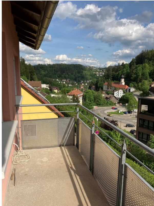
Balkon mit Süd-West-Ostblick