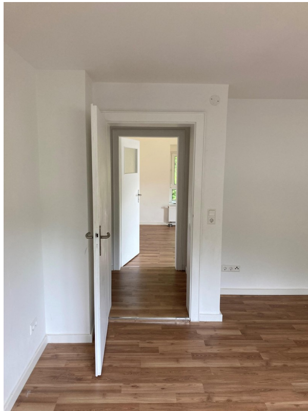
Blick Schlafzi.1 - Schlafzi.2