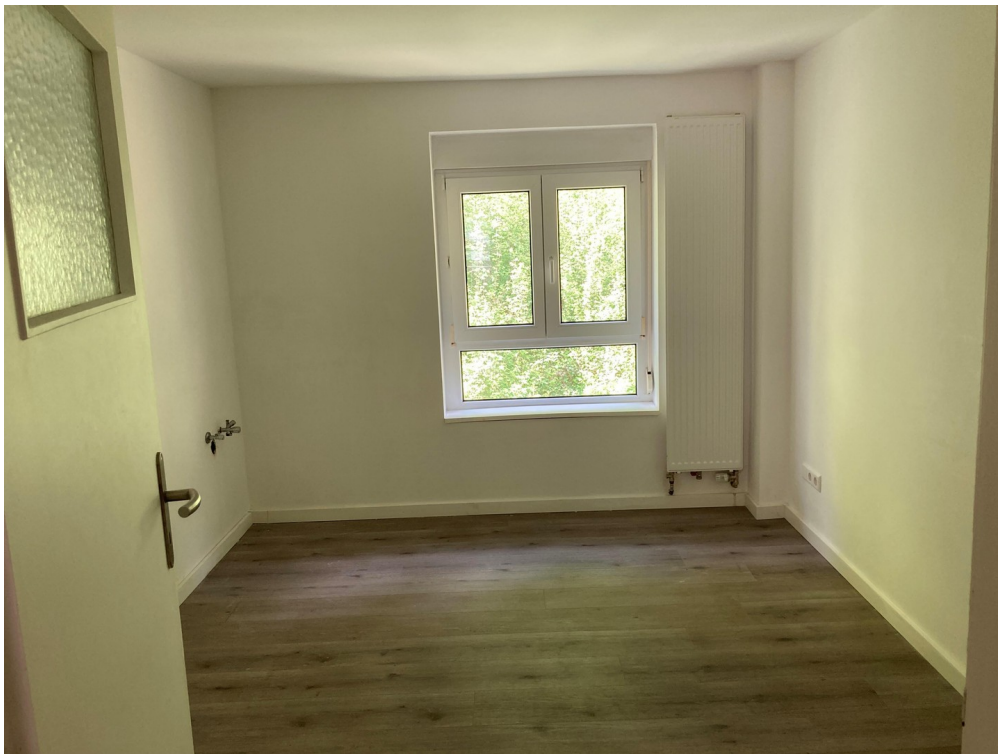
Küche (noch ohne EBK)