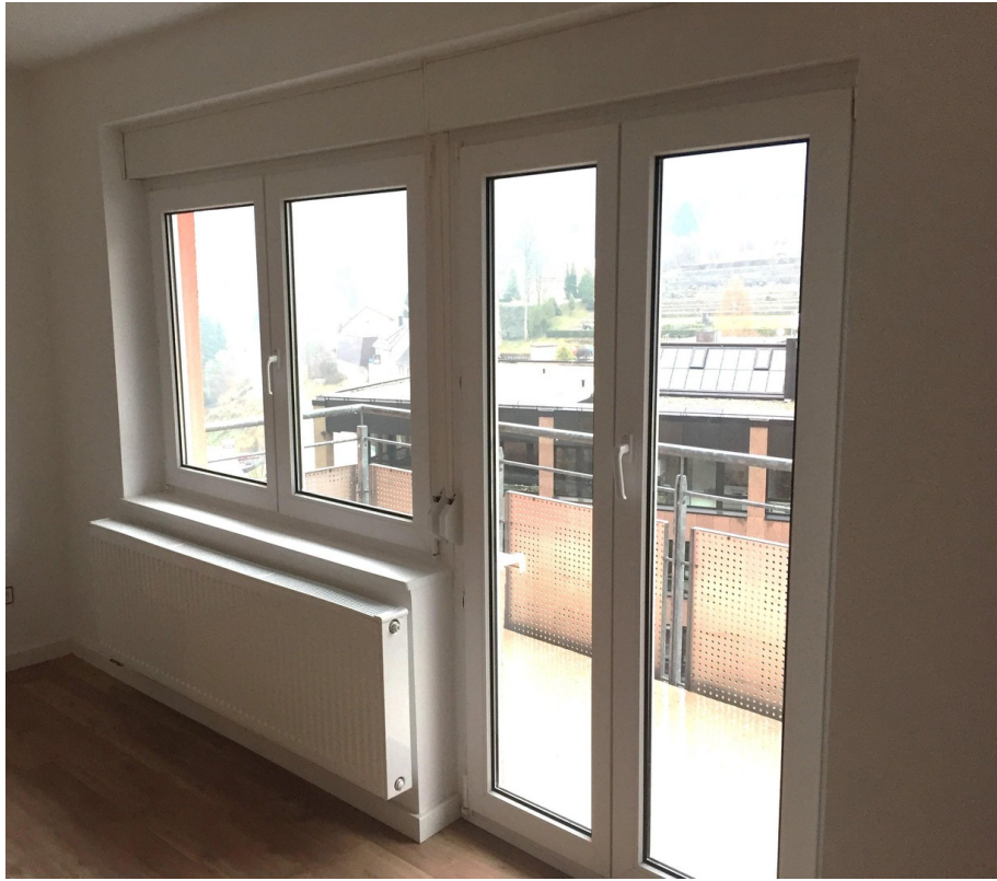
Wohnzimmer - Ausgang Balkon