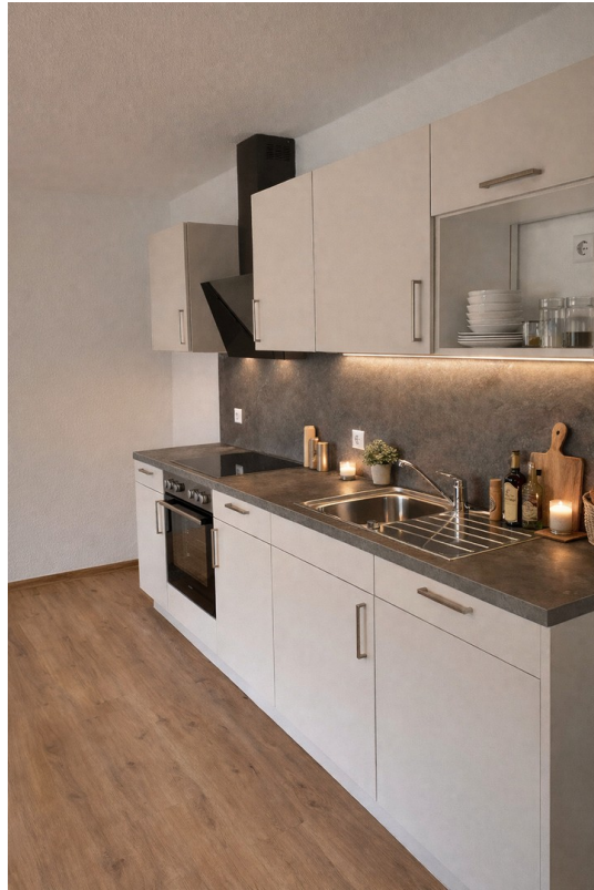
Einbauküche neu W5