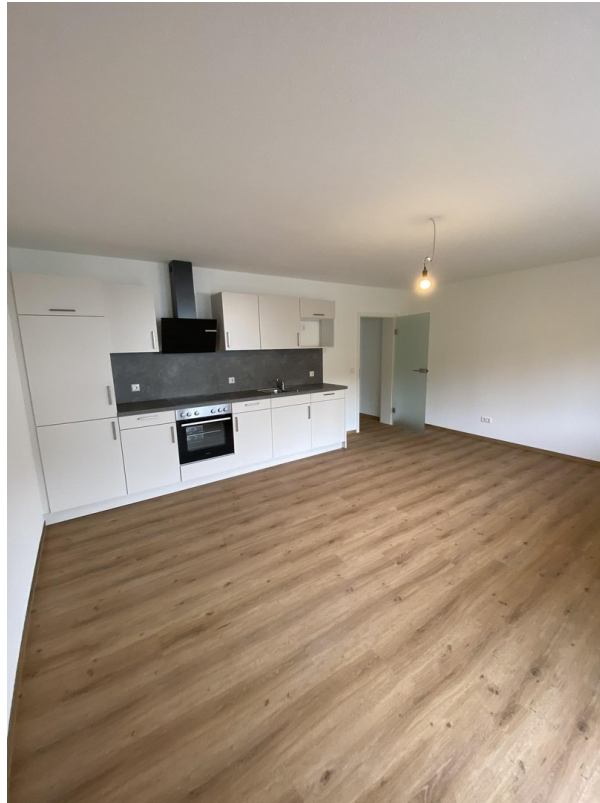
Wohnraum/ Essbereich/ Küche W5