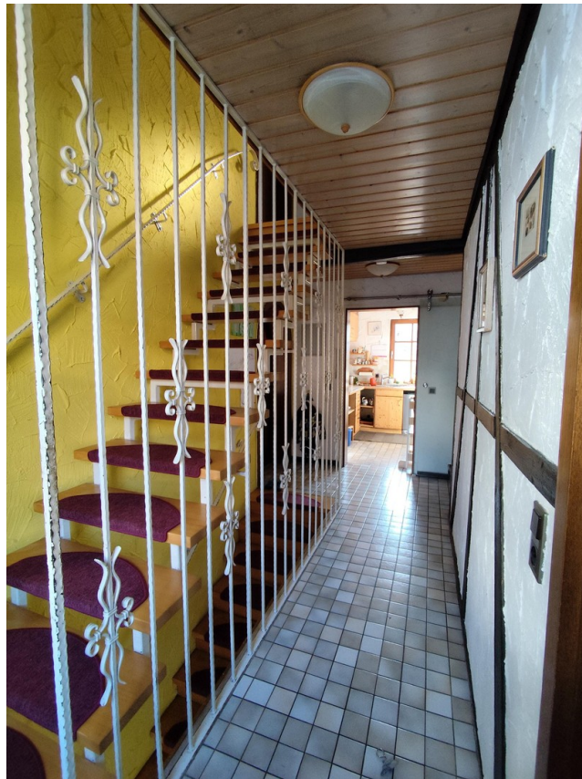
Flur mit Ausgang 2. OG