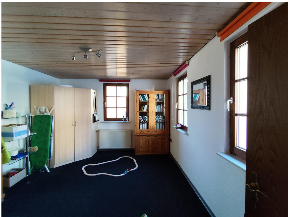
Zimmer 1. OG