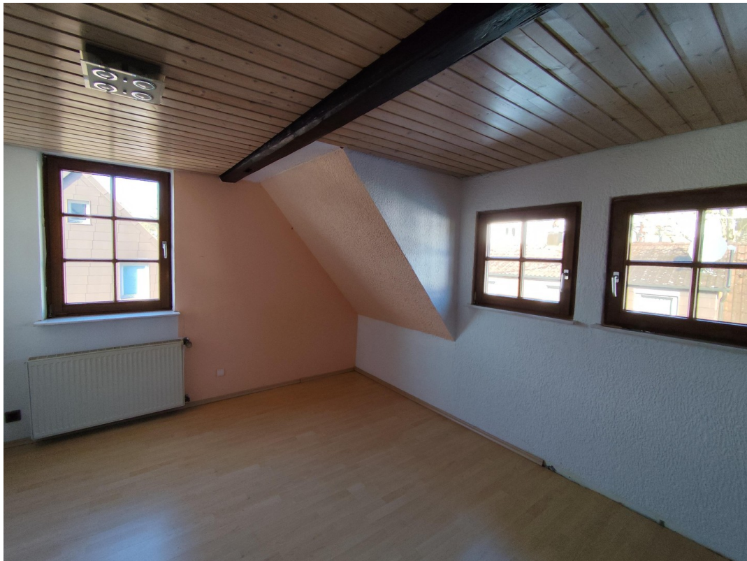
Zimmer 2. OG (Nord-West)