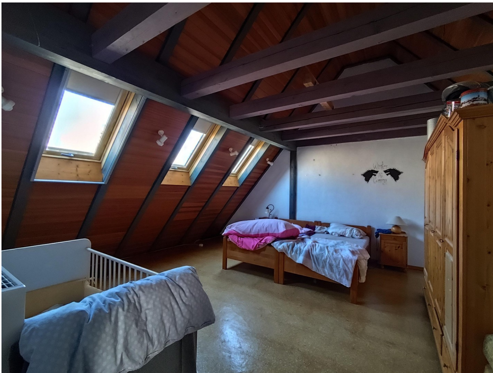
Schlafzimmer 2. OG