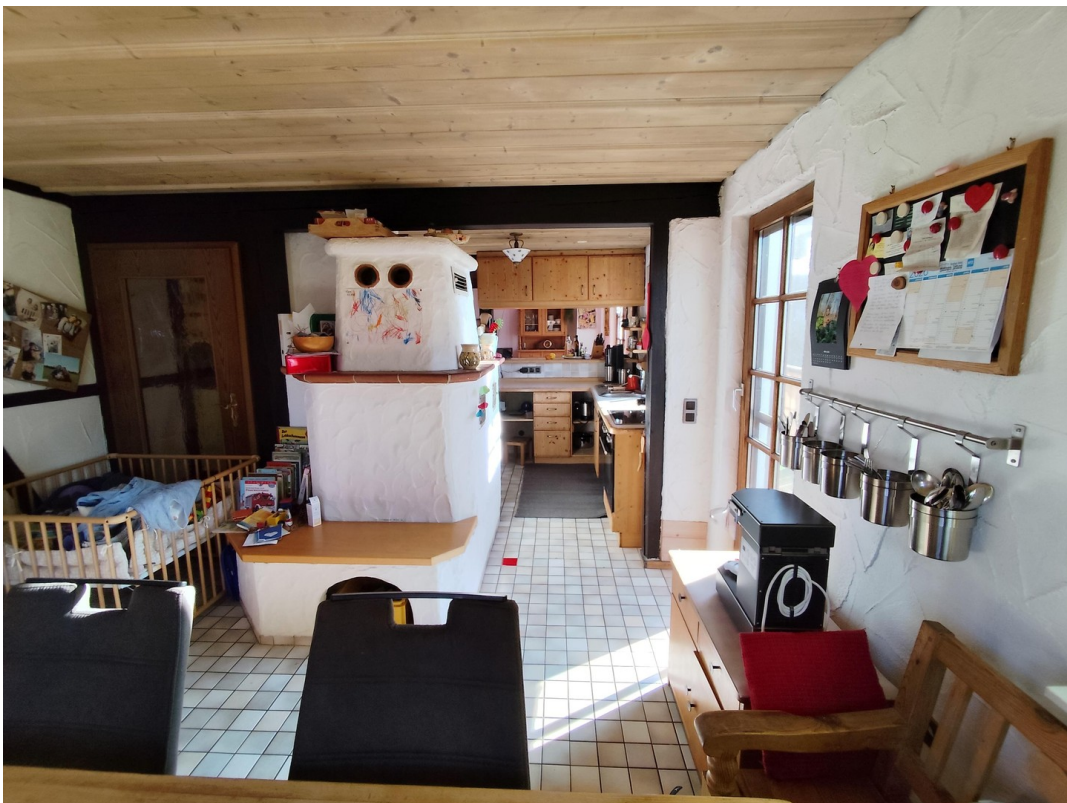
Esszimmer mit Ofen