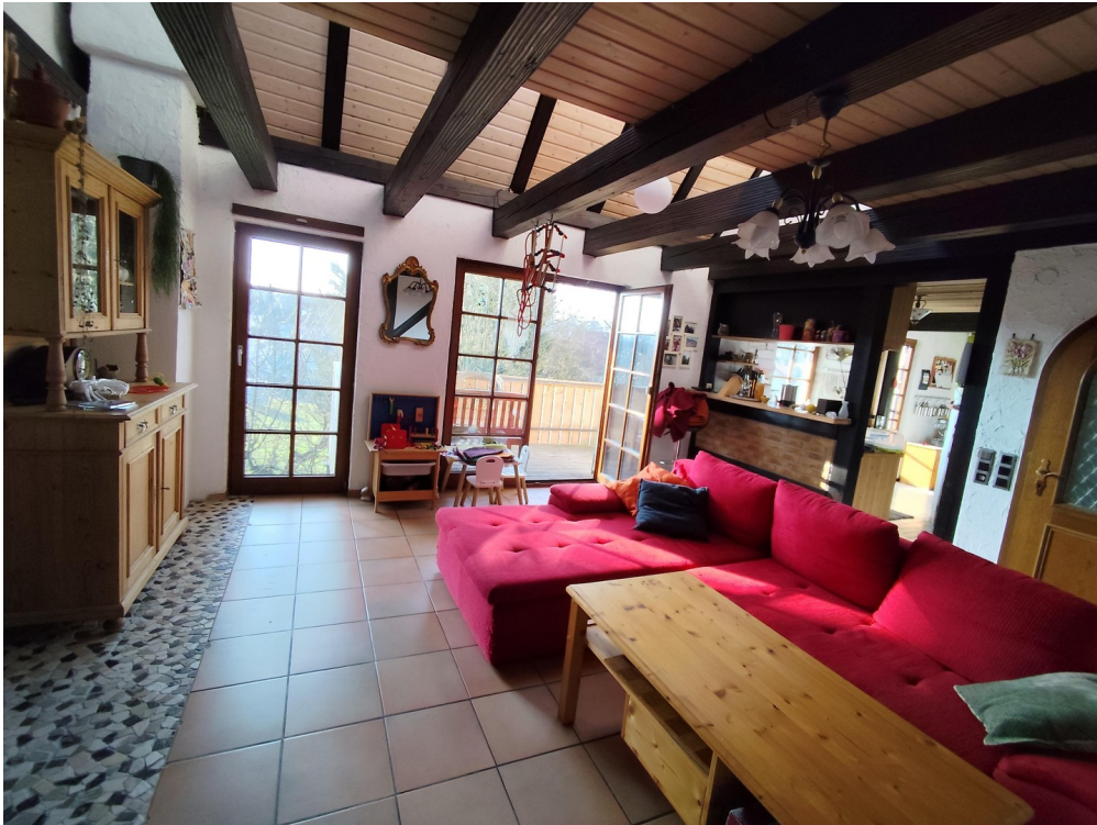
Wohnzimmer mit Balkonzugang