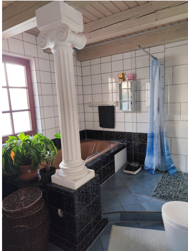
Badezimmer 1. OG