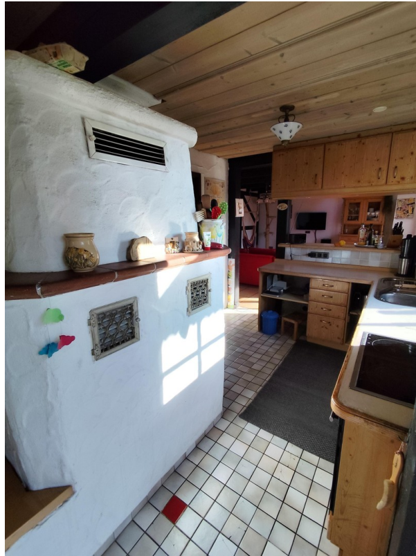
Küche mit Ofen