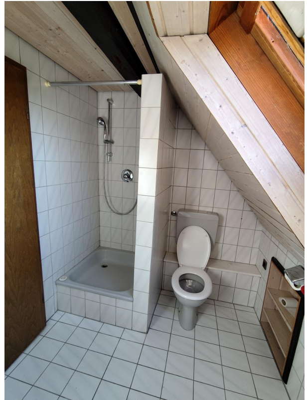
Bad 2. OG