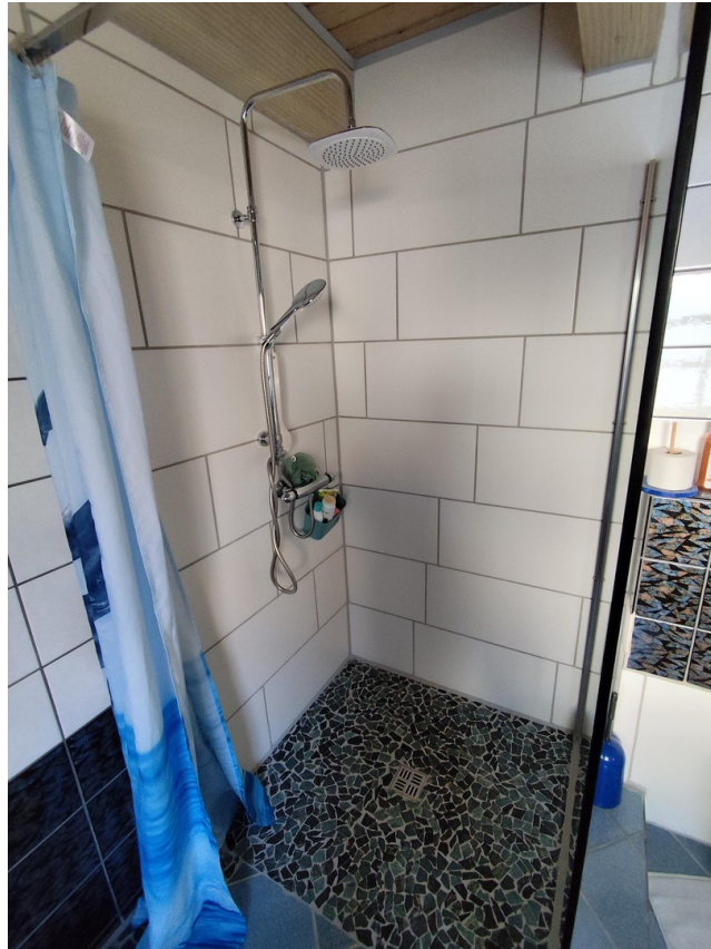
Badezimmer 1. OG