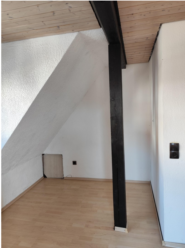
Zimmer 2. OG (Nord-West)