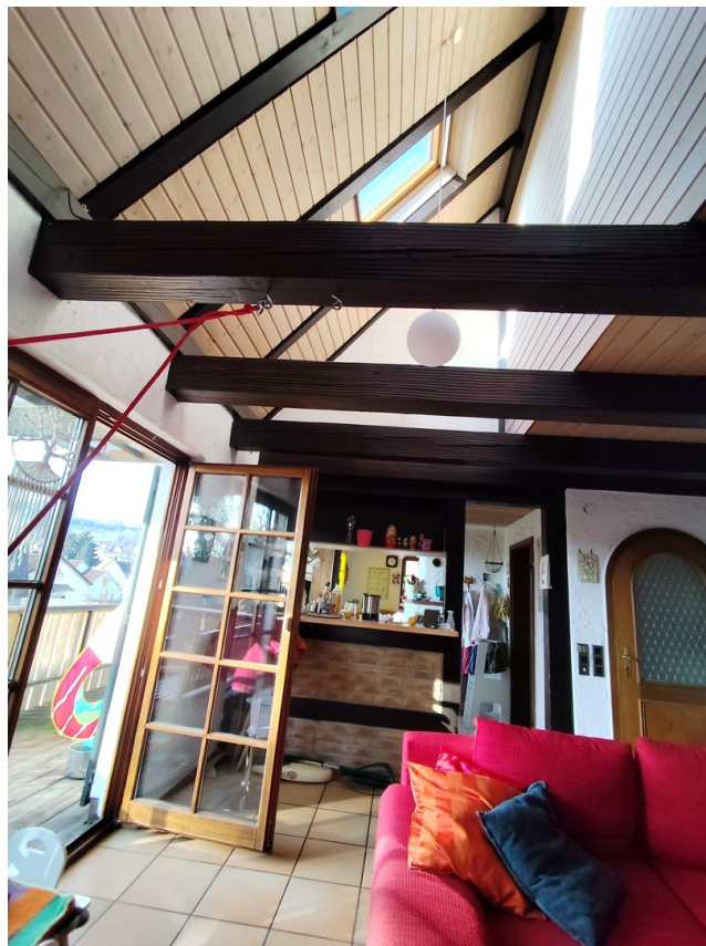
Wohnzimmer mit Blick zur Küche