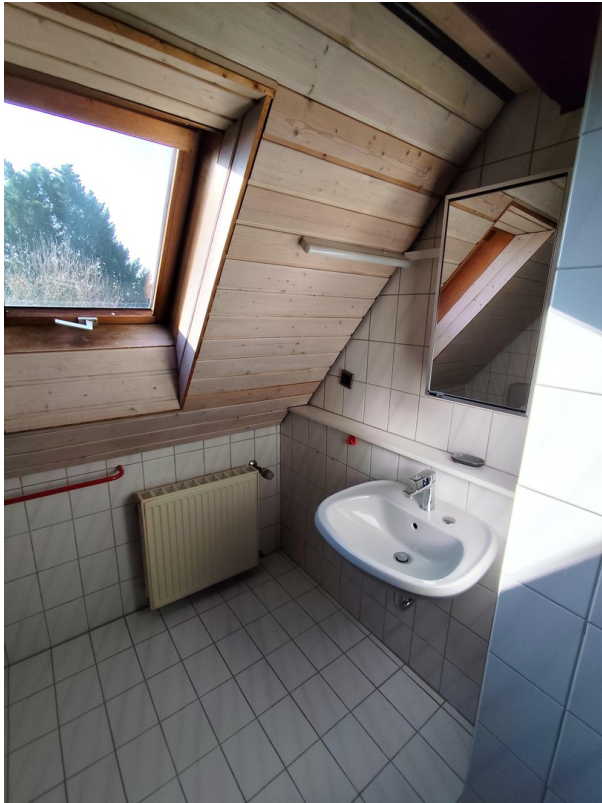
Bad 2. OG