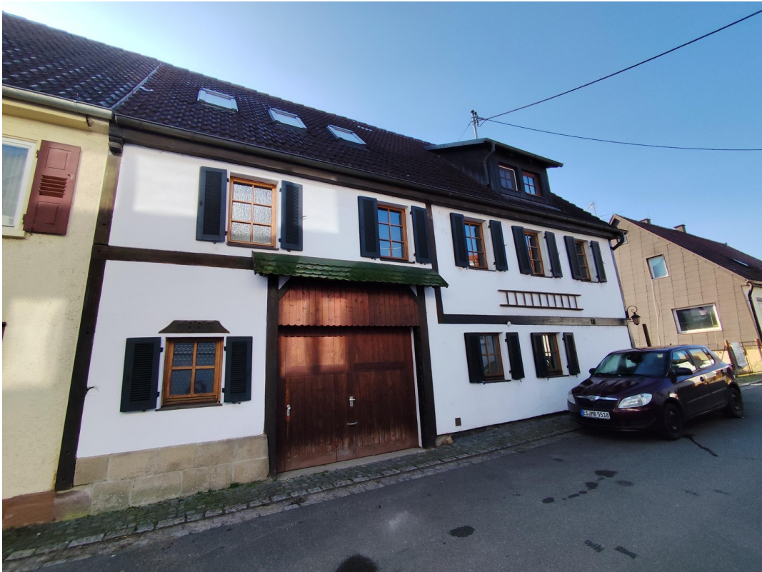
Ansicht von Norden