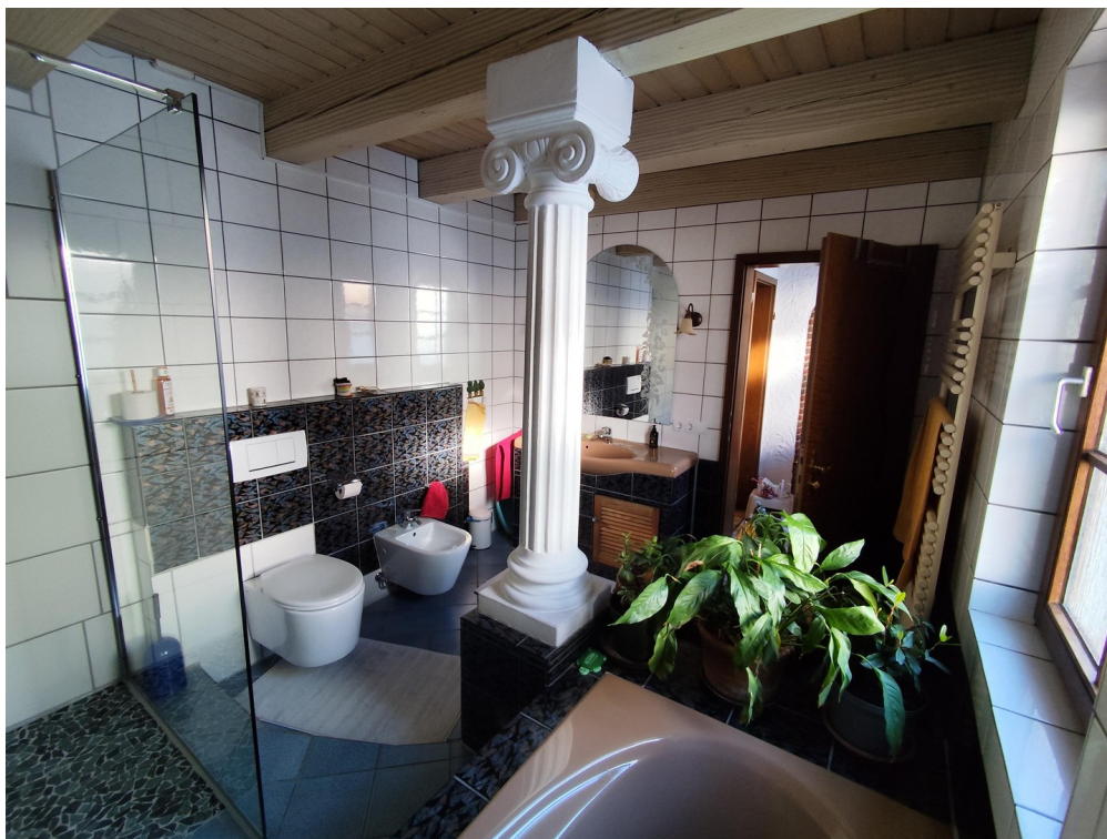
Badezimmer 1. OG