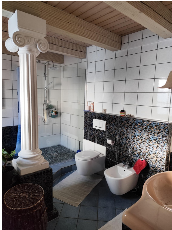
Badezimmer 1. OG