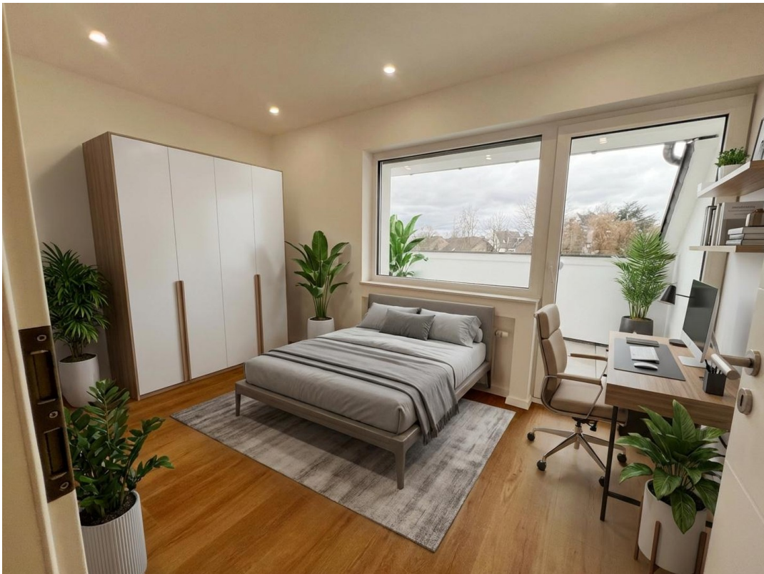
Jugendzimmer (KI Vorschlag)