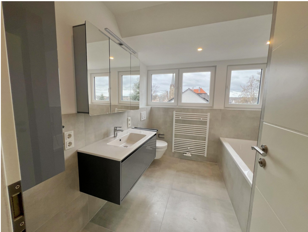
Hauptbad mit Wanne & Dusche