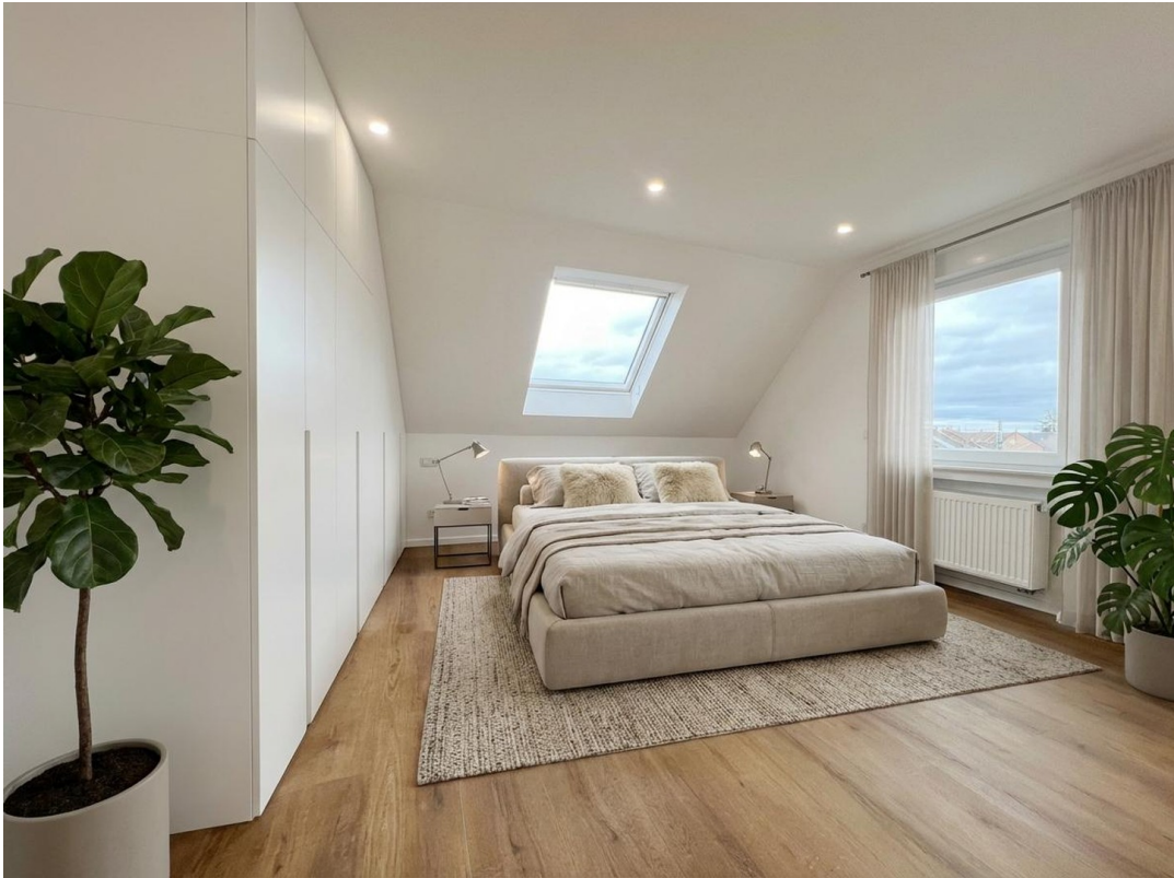
Schlafzimmer (KI Vorschlag)