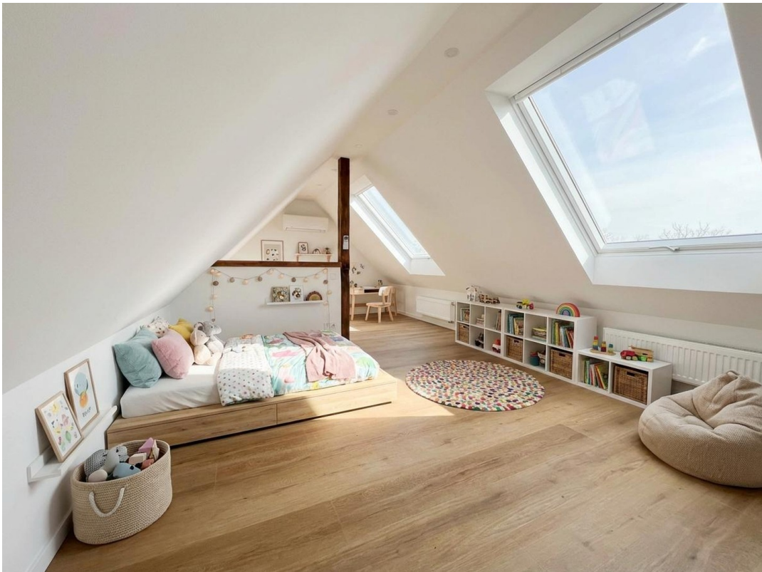
Kinderzimmer (KI Vorschlag)