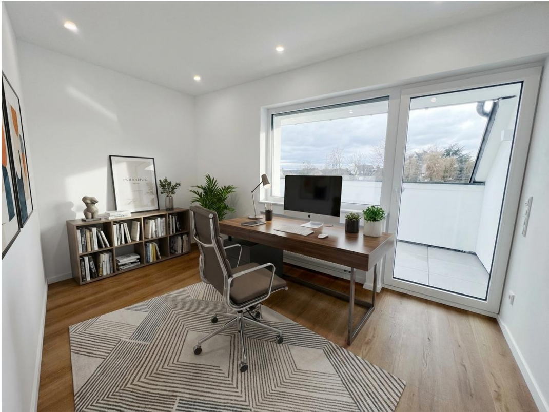
Büro (KI Vorschlag)