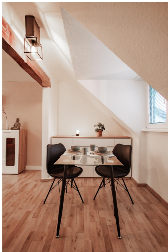
dining area place for 4