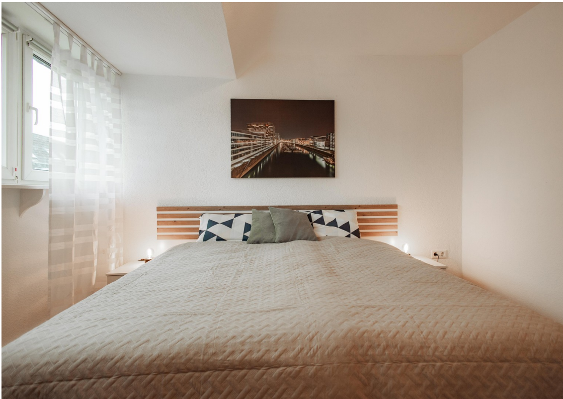
new sleep oasis