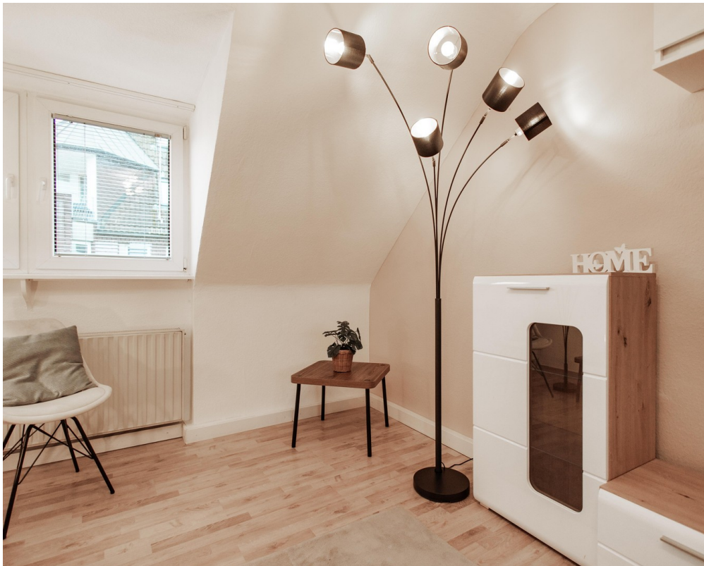
pleasant lighting everywhere