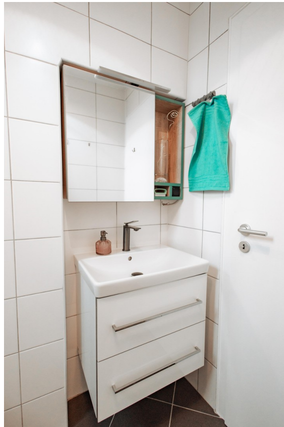
built-in mirror cabinet