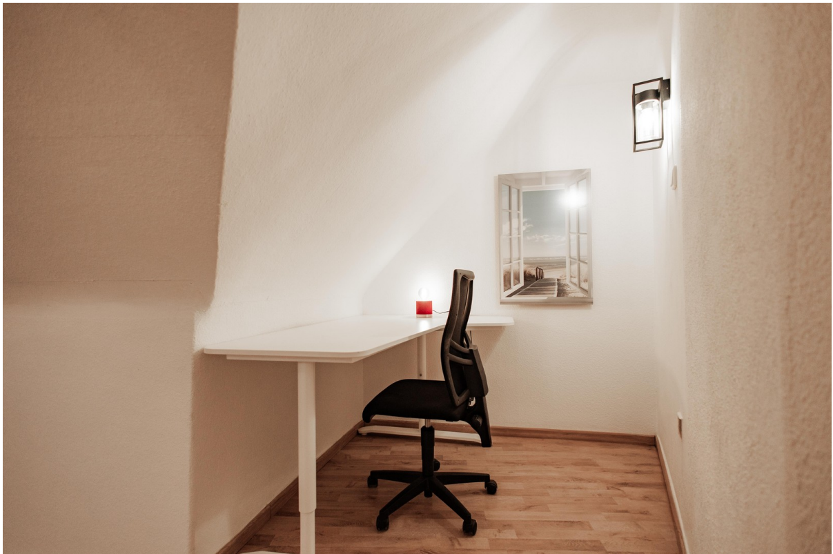
practical work corner