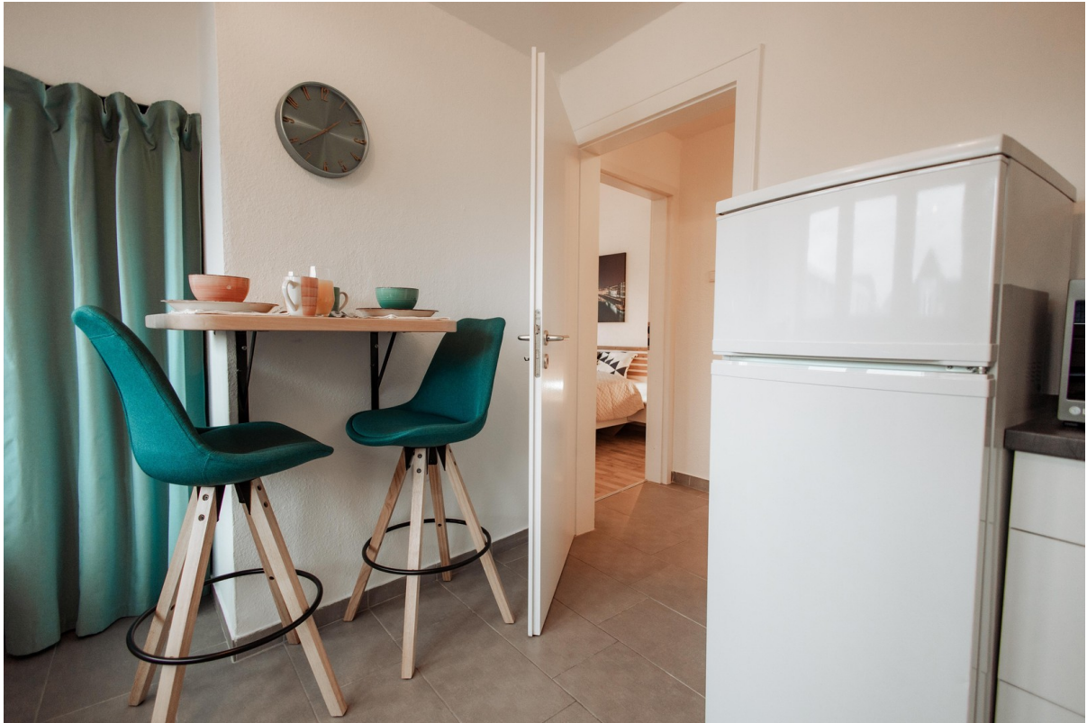
very nice dining area