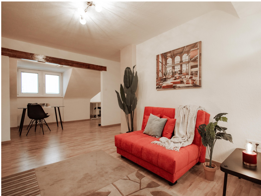
nice living room