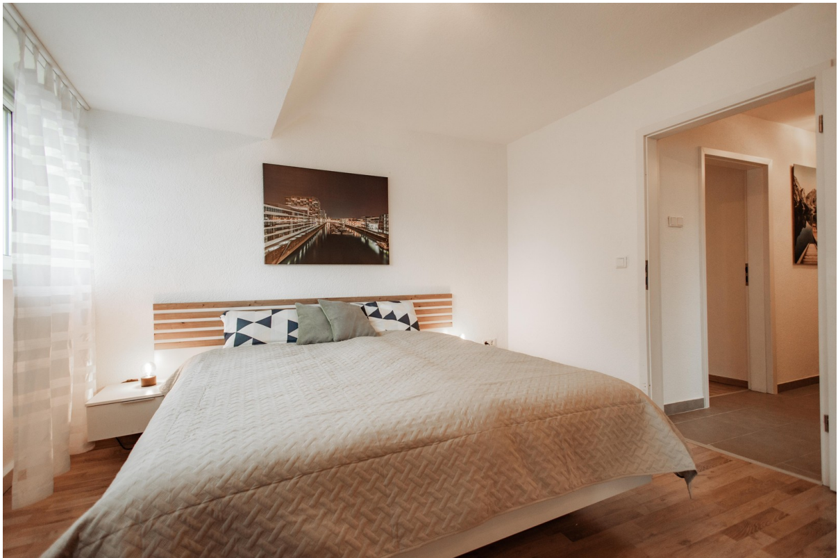
two mattresses brand Möve