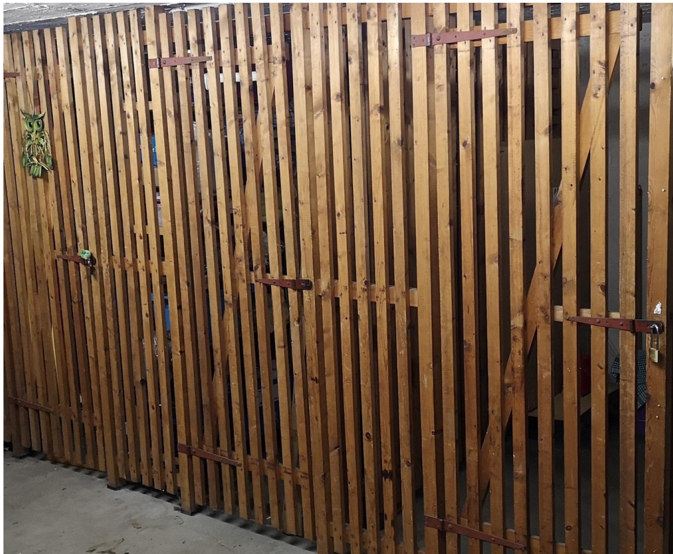
separate basement storage