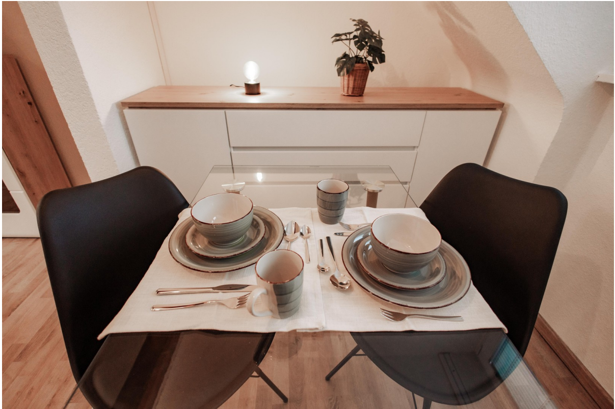
pleasant dining area