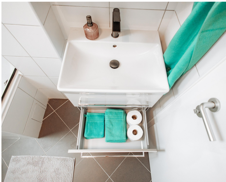
built-in mirror cabinet_