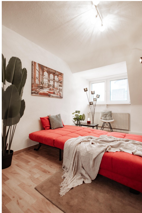
sofa bed brand ell+ell