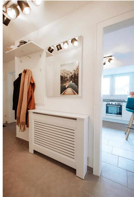
view hallway kitchen