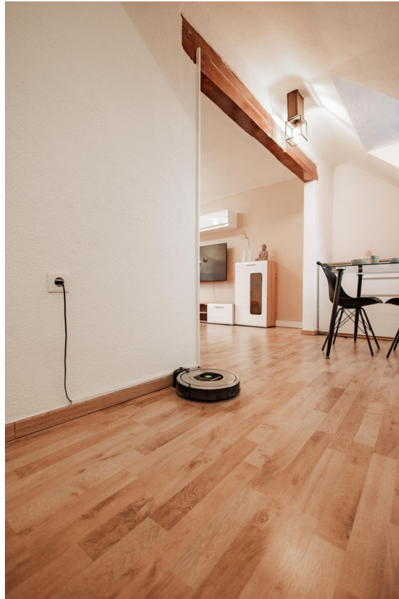
view from working Area