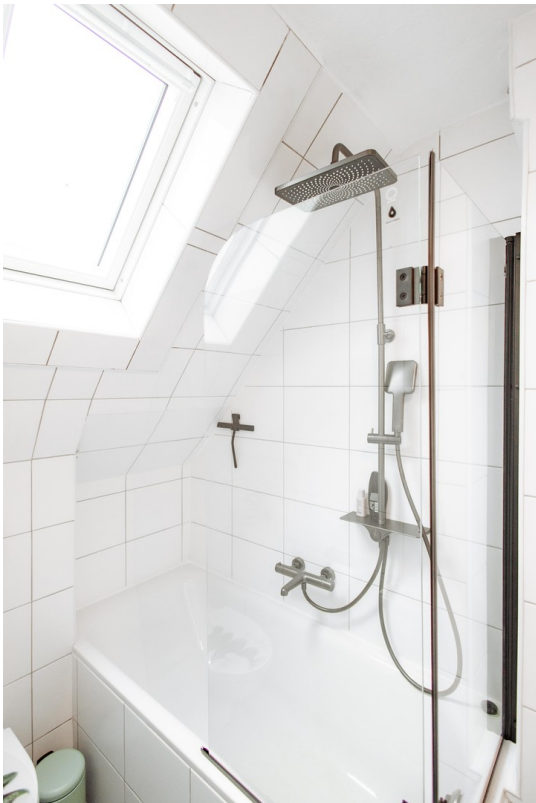
bathtub with rain shower