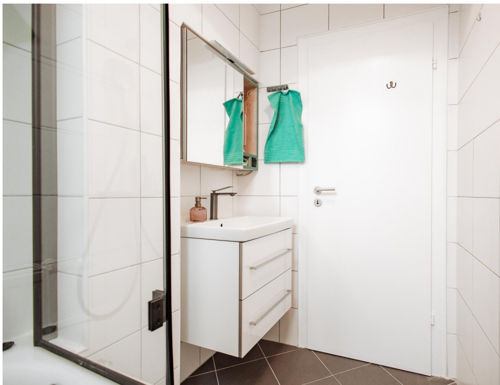
branded washbasin and base cab