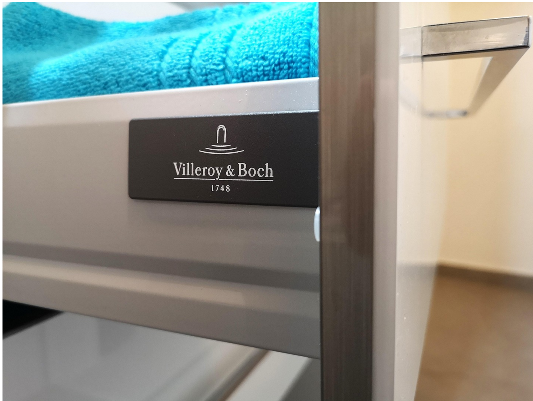
Villeroy and Boch