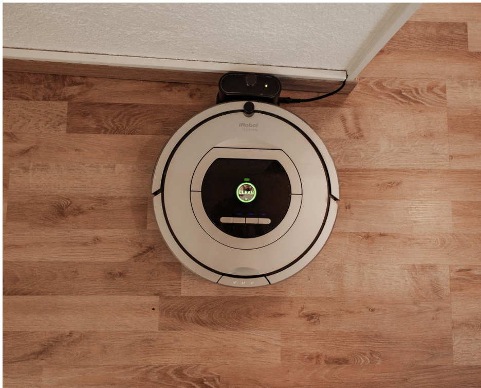
robot vacuum cleaner