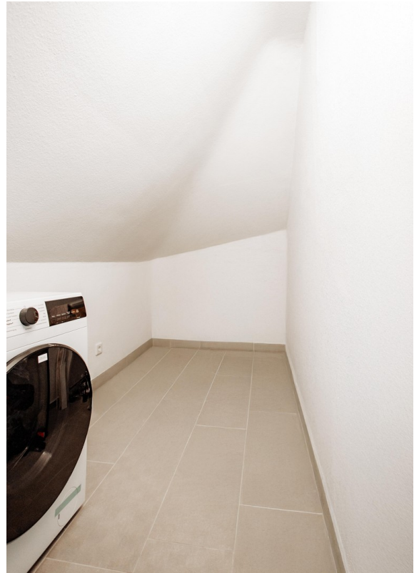
Storage room now fully equippe