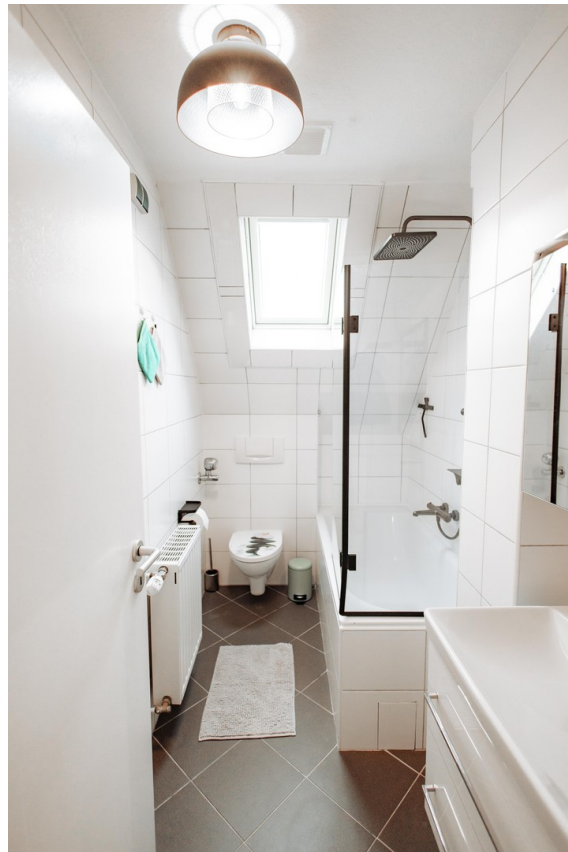
new equipped bath room