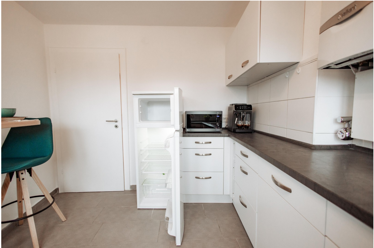
new fridge-freezer combination