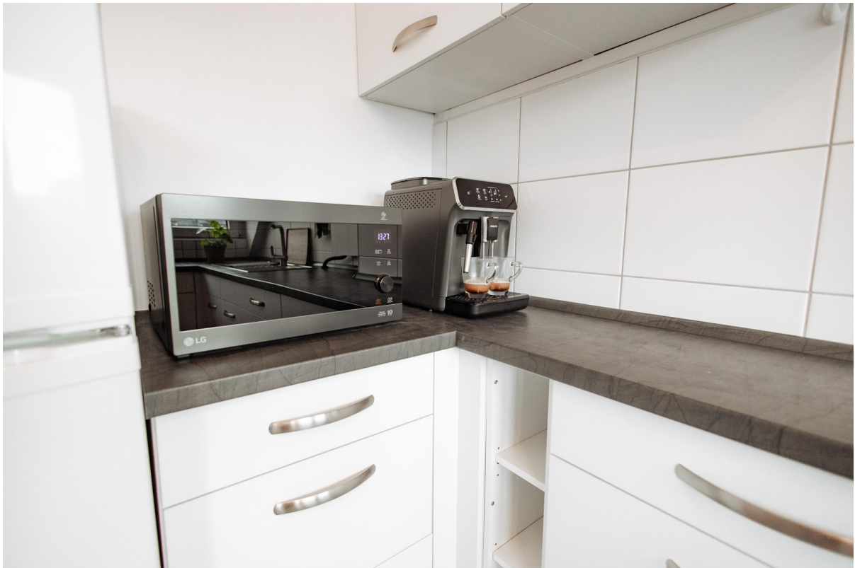
brand new devices