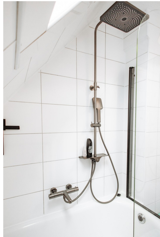
new rain shower