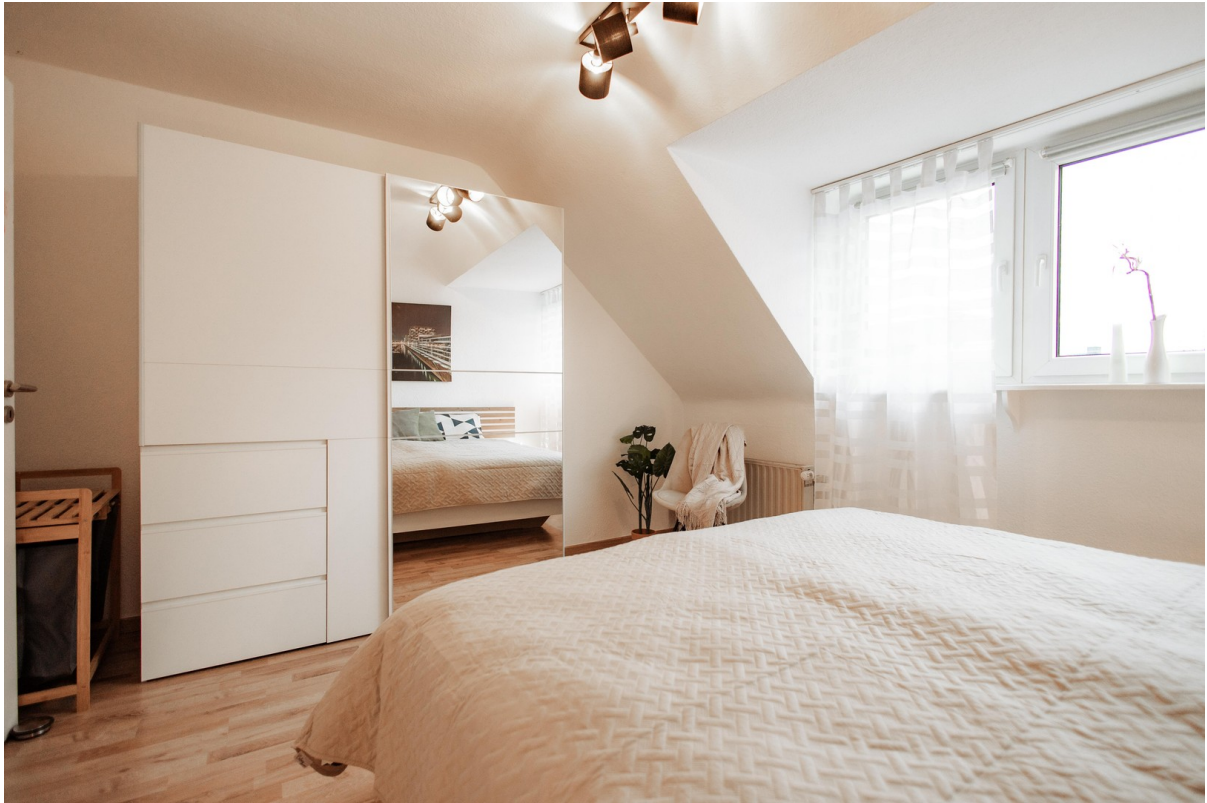
large sliding door wardrobe