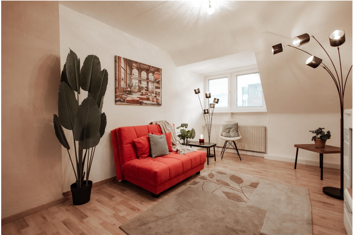
spacious living room