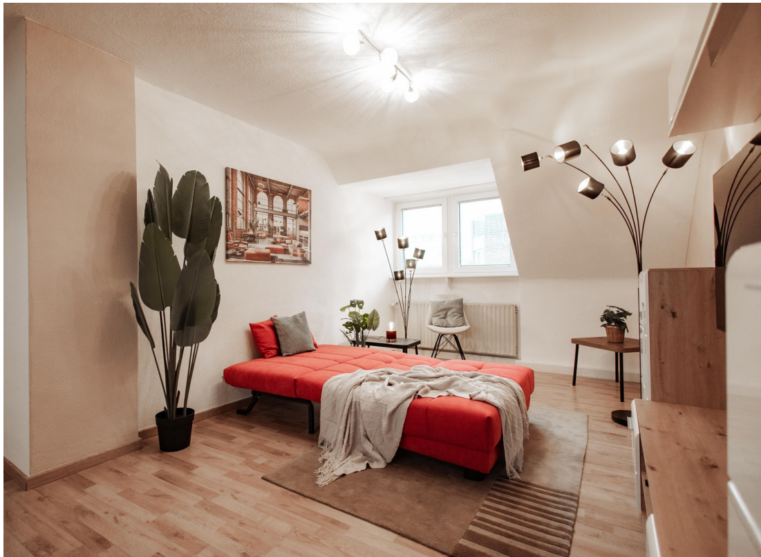
TV and bed