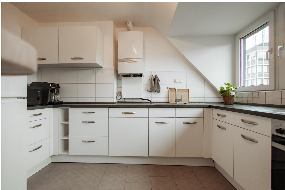
very spacious kitchen