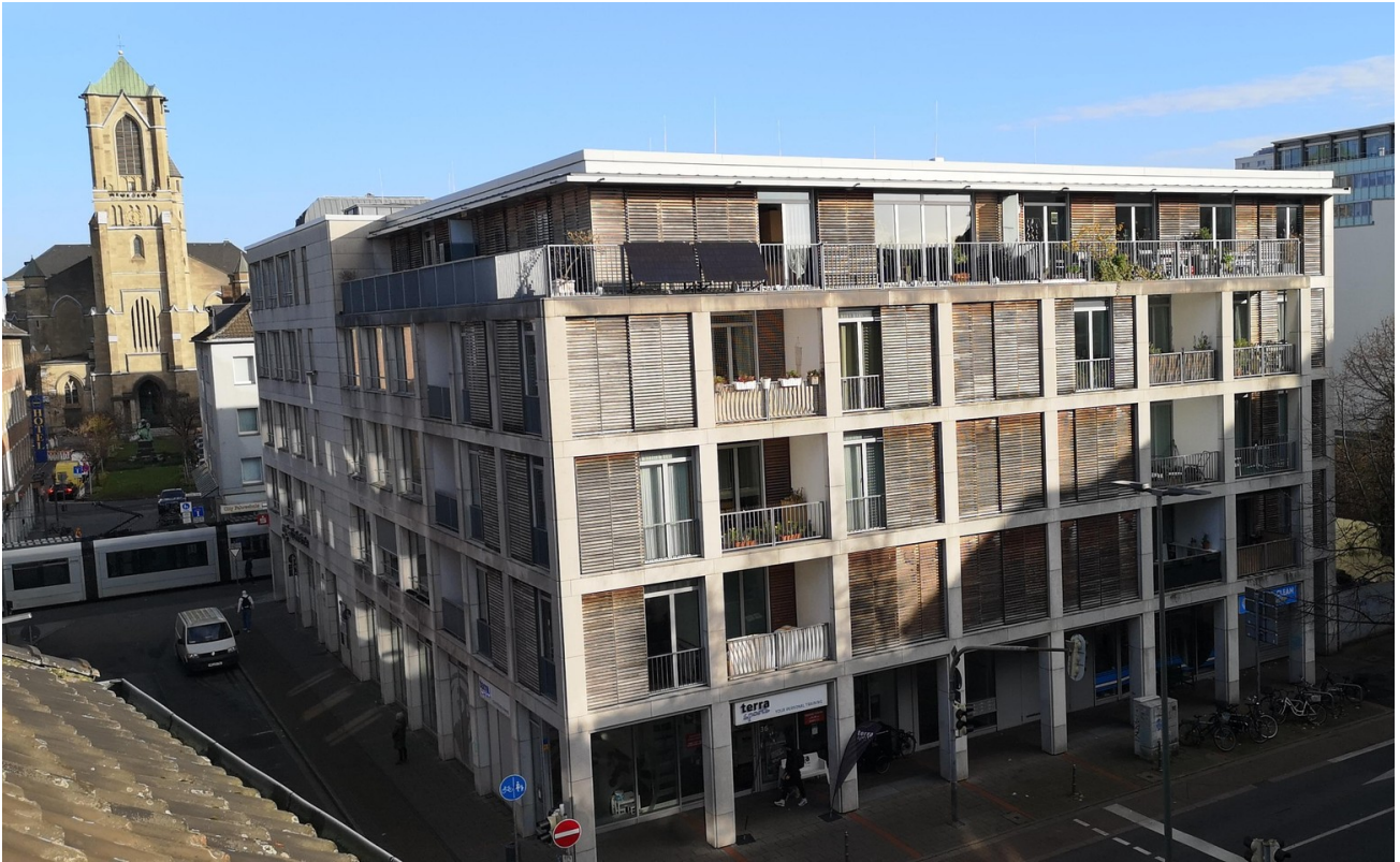
view from the kitchen