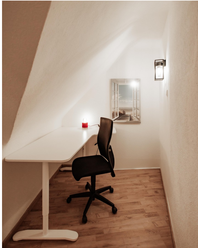
new desk with charging + USB