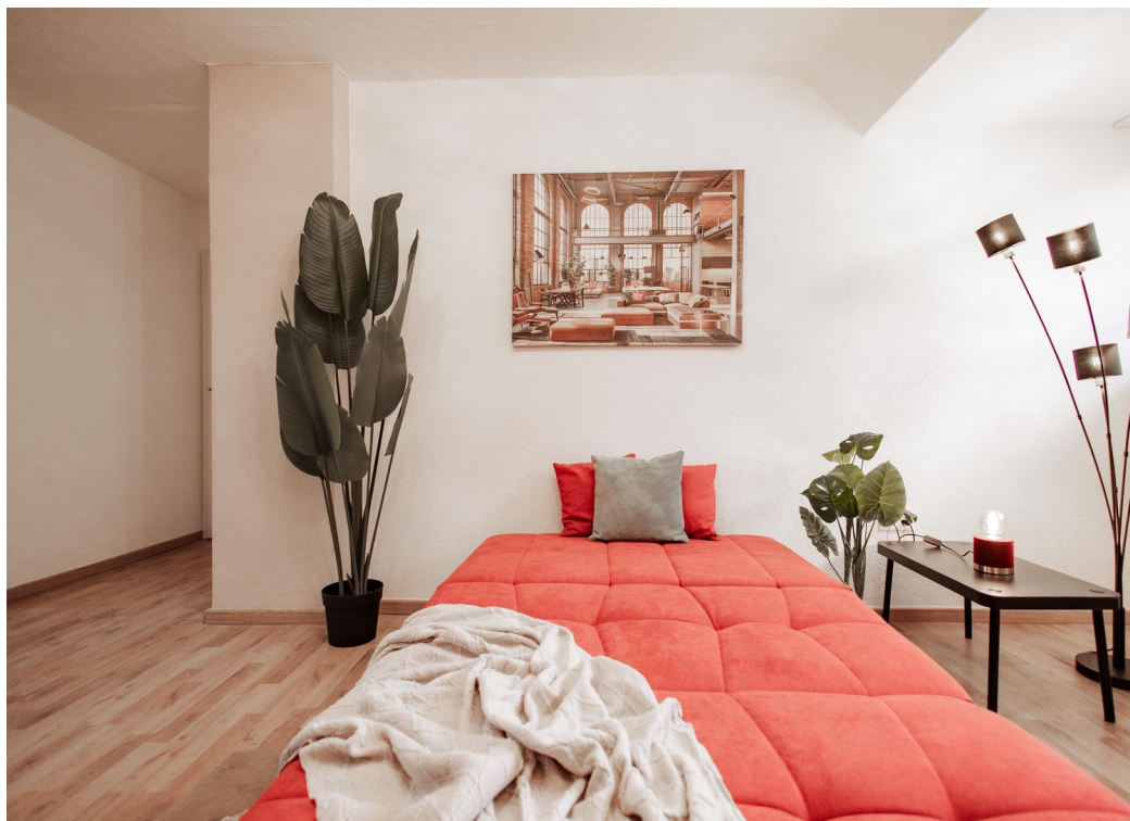
spacefull living room