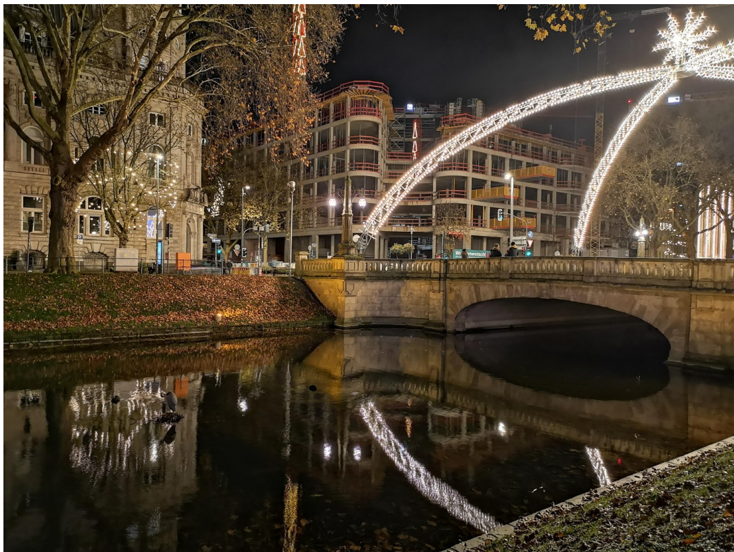
Düsseldorf Kö on cristmas