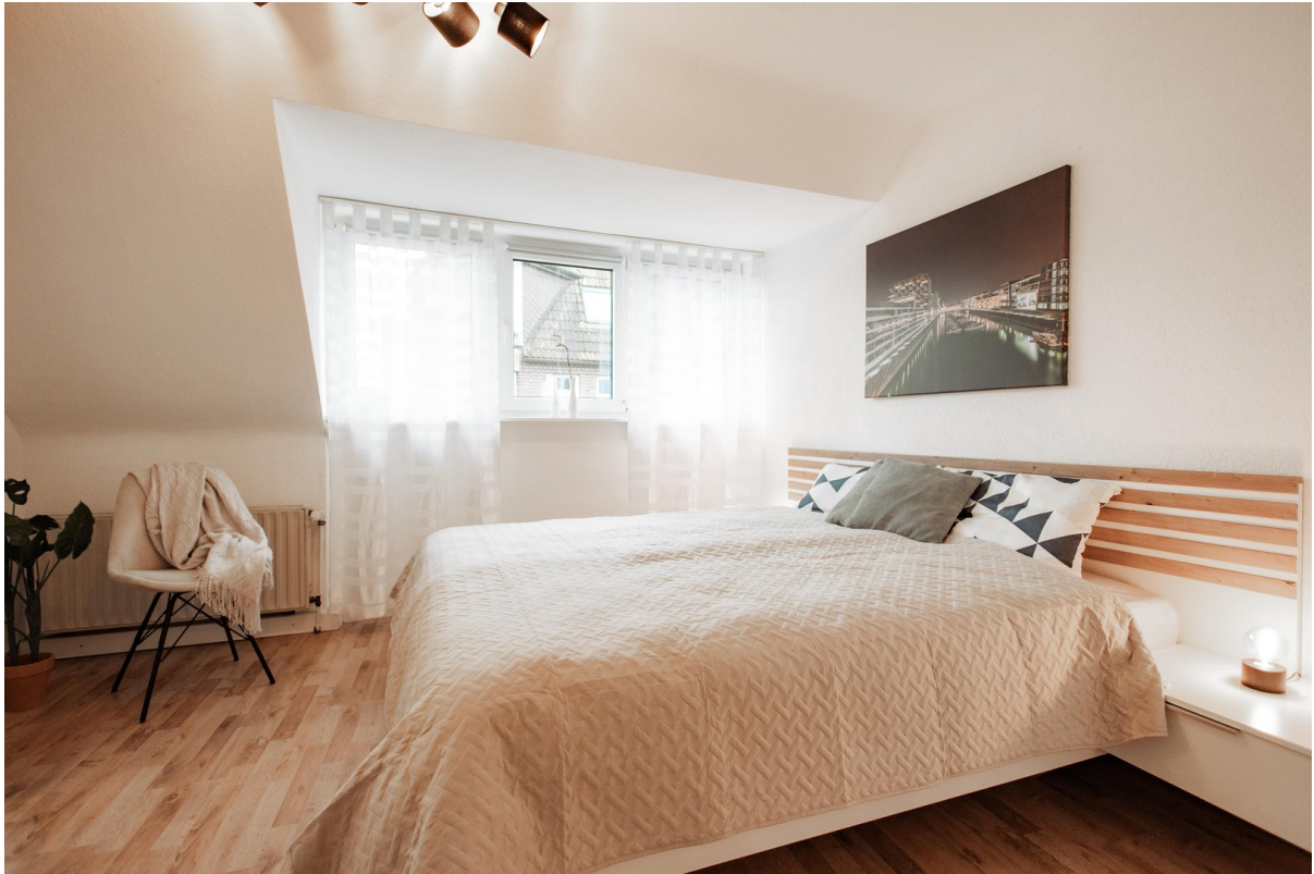
sleeping with nice view