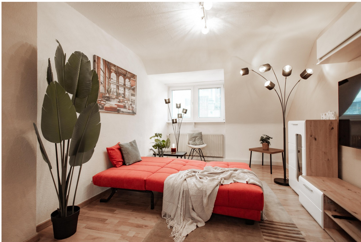
large sofa bed