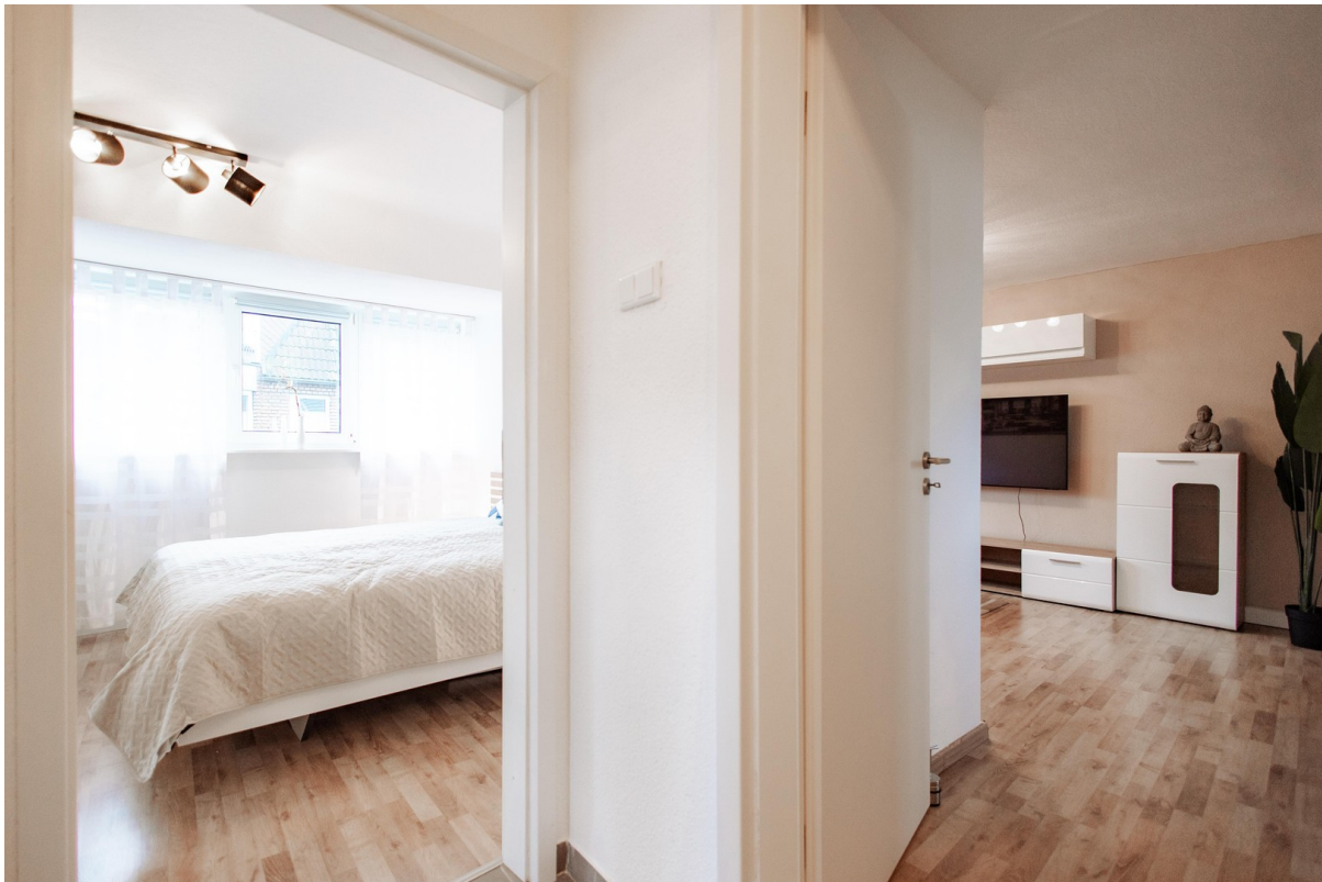
view bedroom living room