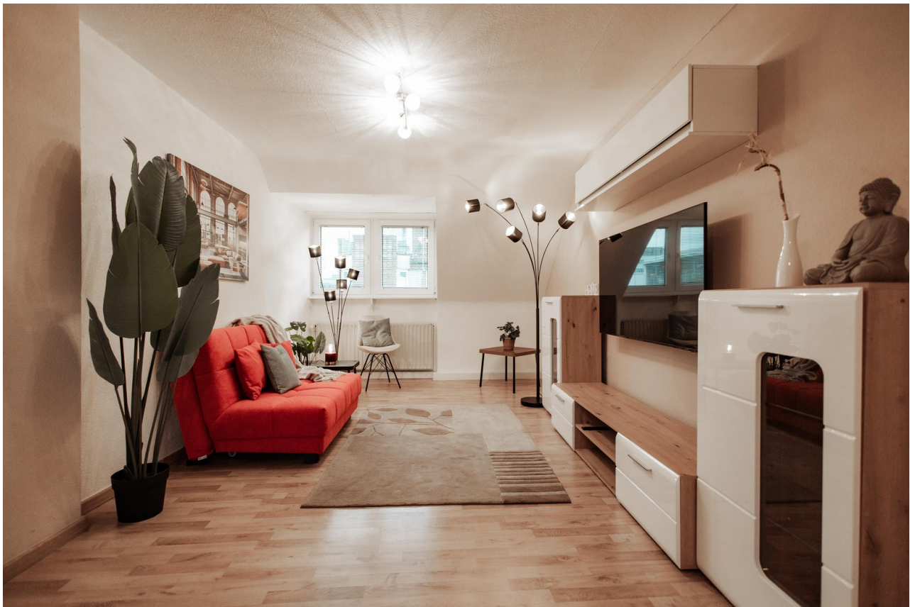
large living room 55' TV