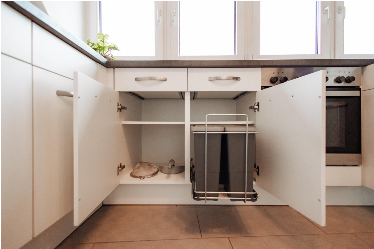
new wast separator