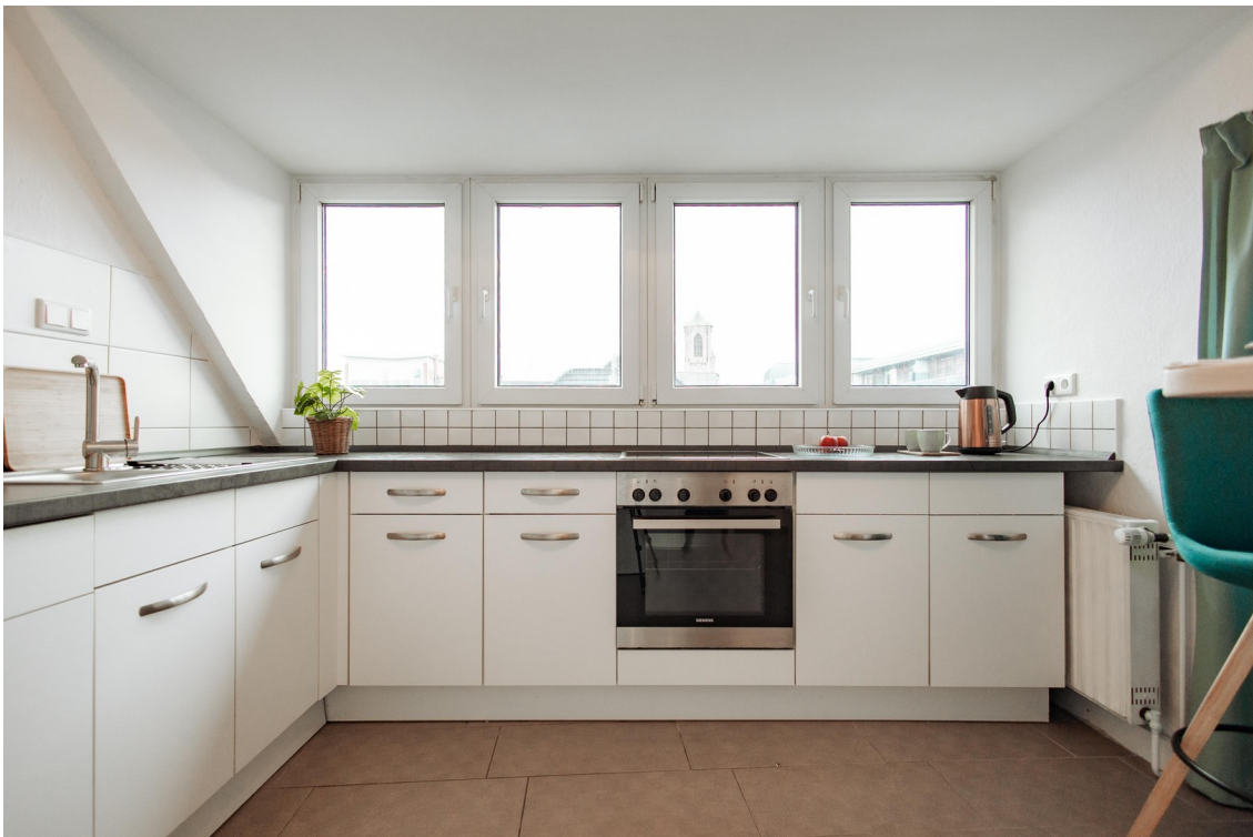
very spacious kitchen