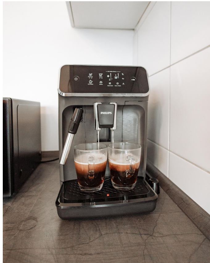
new fully automatic coffee mac