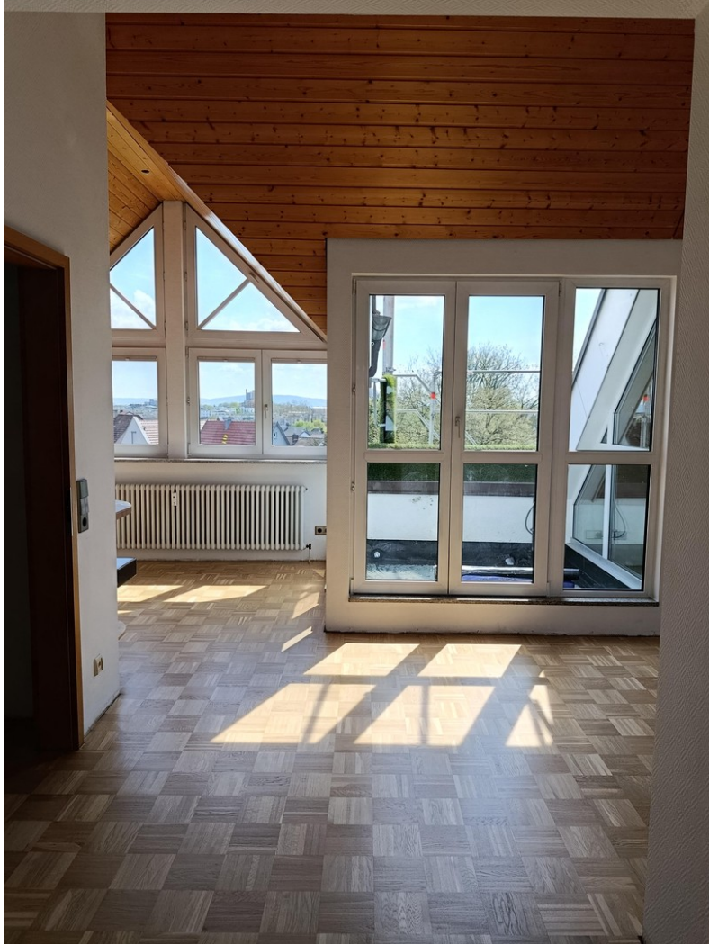
Blick auf die Dachterrasse