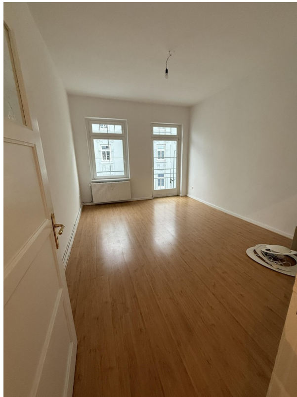
Zimmer 2 mit Balkon