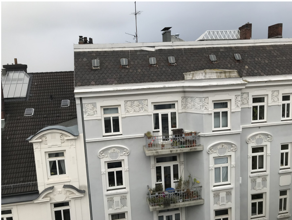
Blick aus dem Fenster