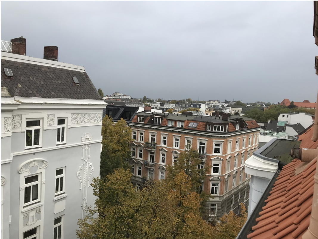
Blick aus dem Fenster