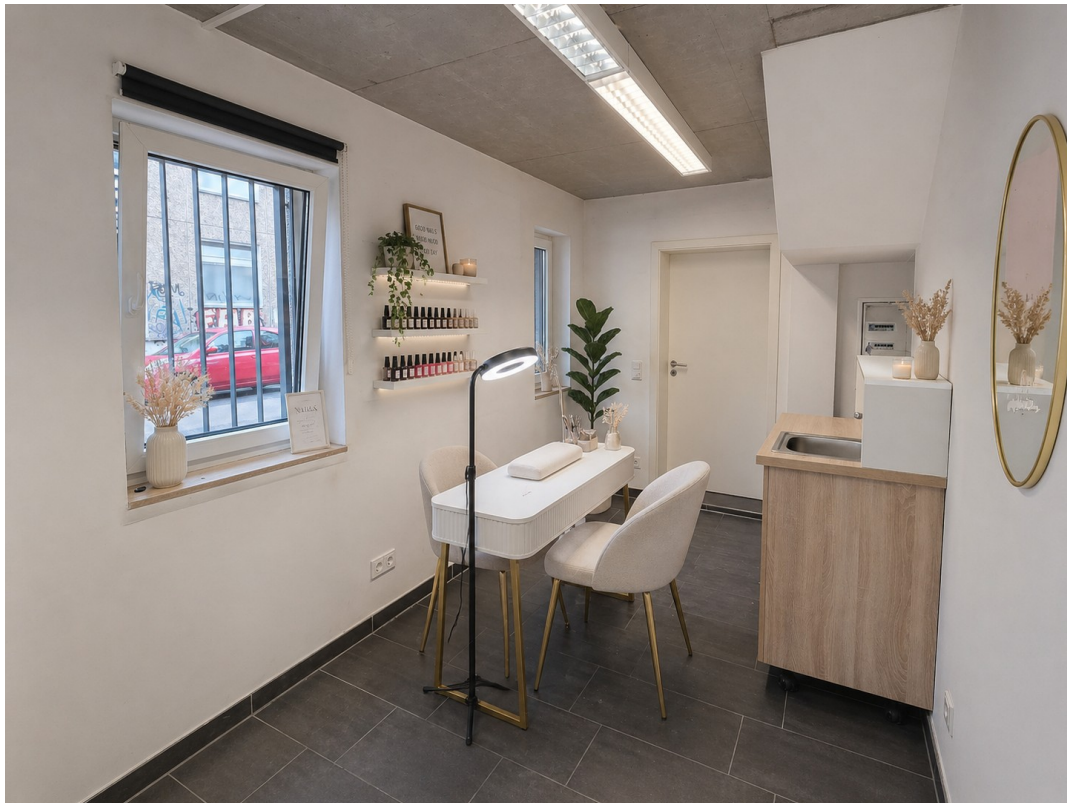
Innenbereich 3D Möbliert