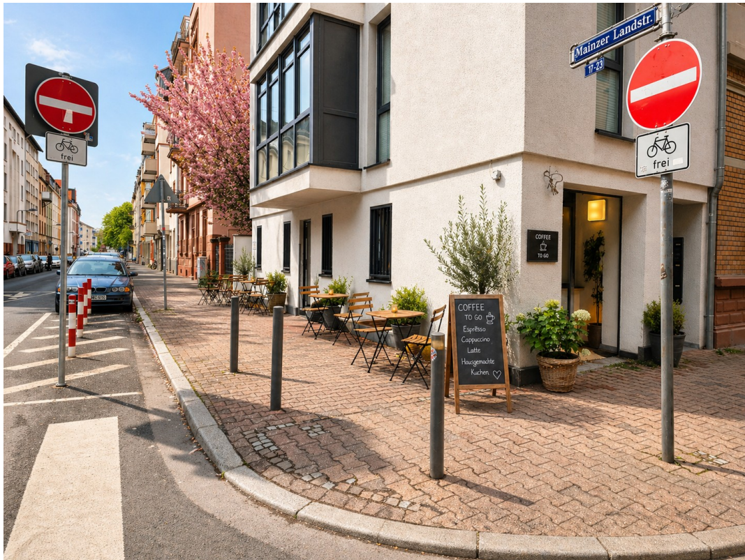
Außenbereich 3D Möbliert