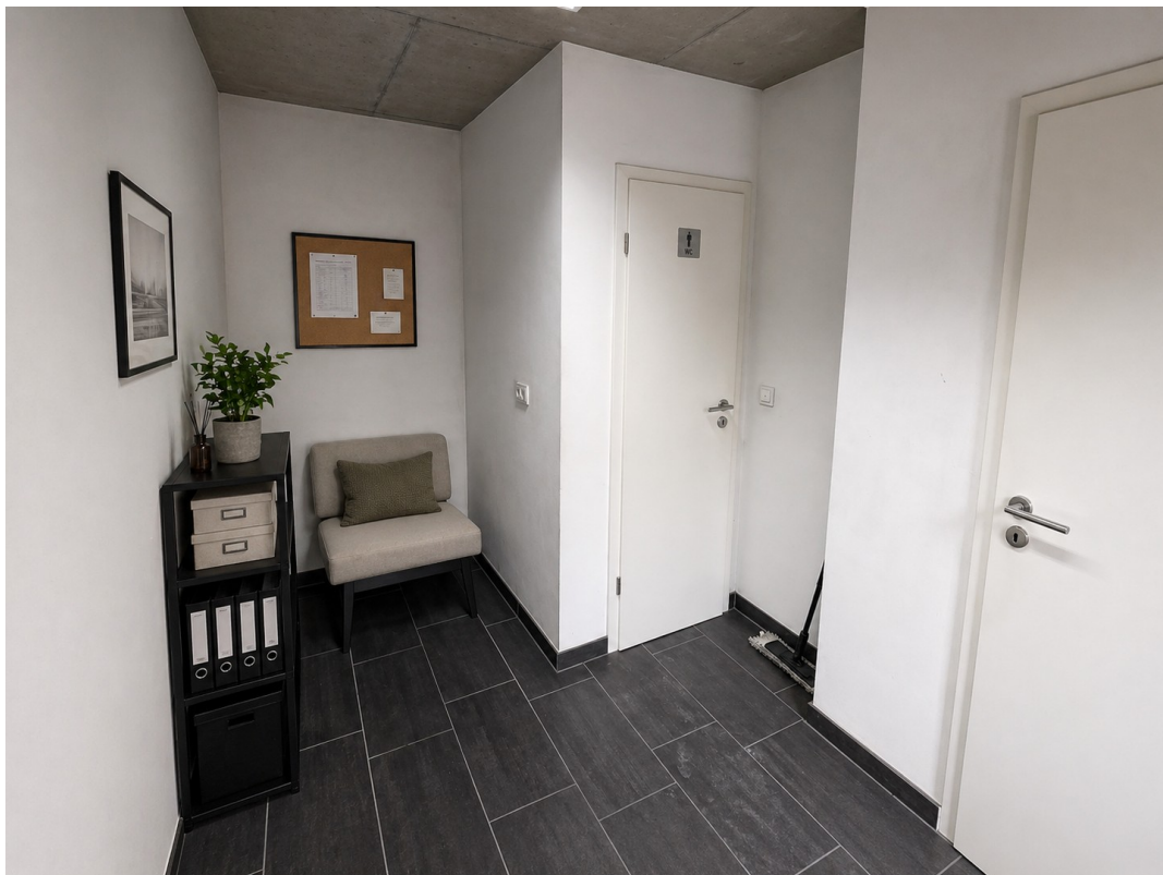
Innenbereich 3D Möbliert