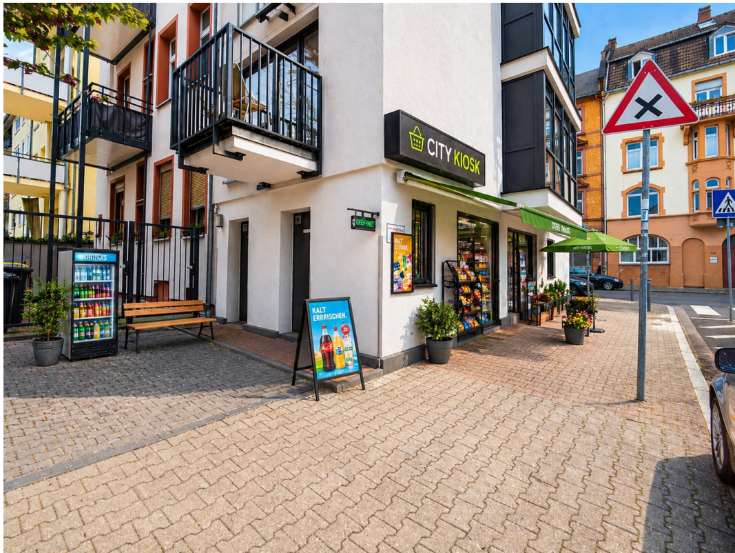
Außenbereich 3D Möbliert