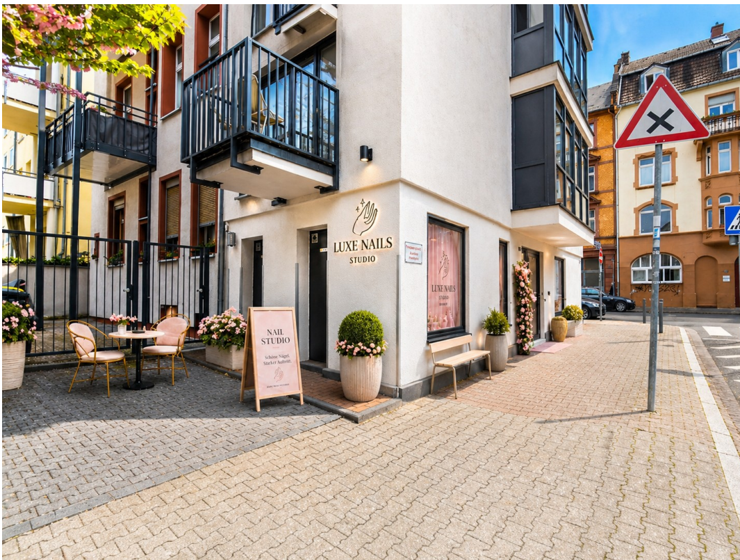
Außenbereich 3D Möbliert