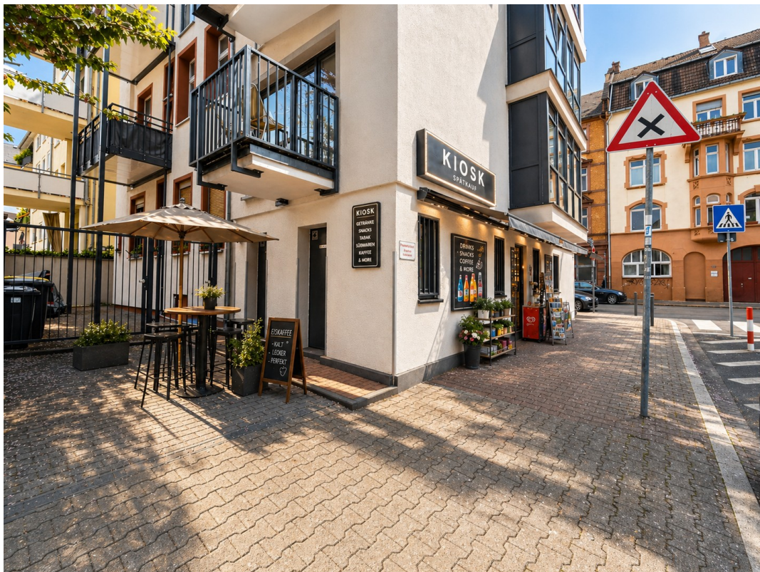
Außenbereich 3D Möbliert