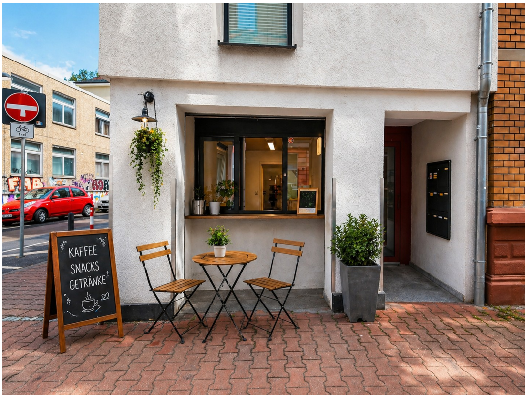
Außenbereich 3D Möbliert