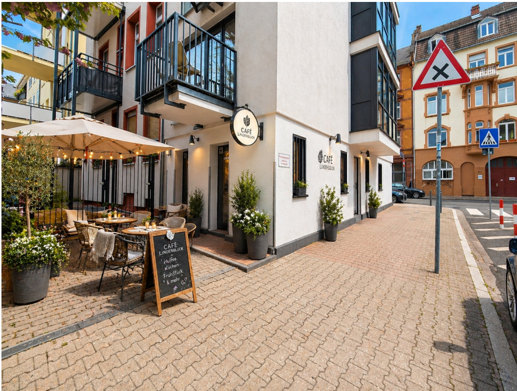
Außenbereich 3D Möbliert