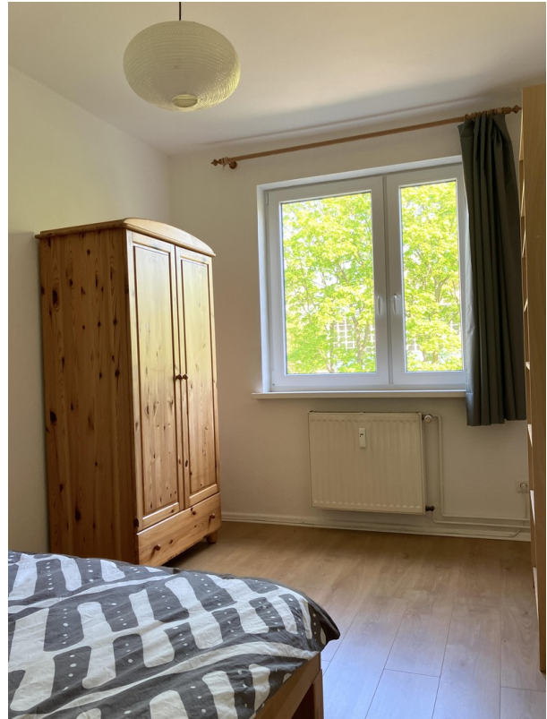
Schlafzimmer Bild 1