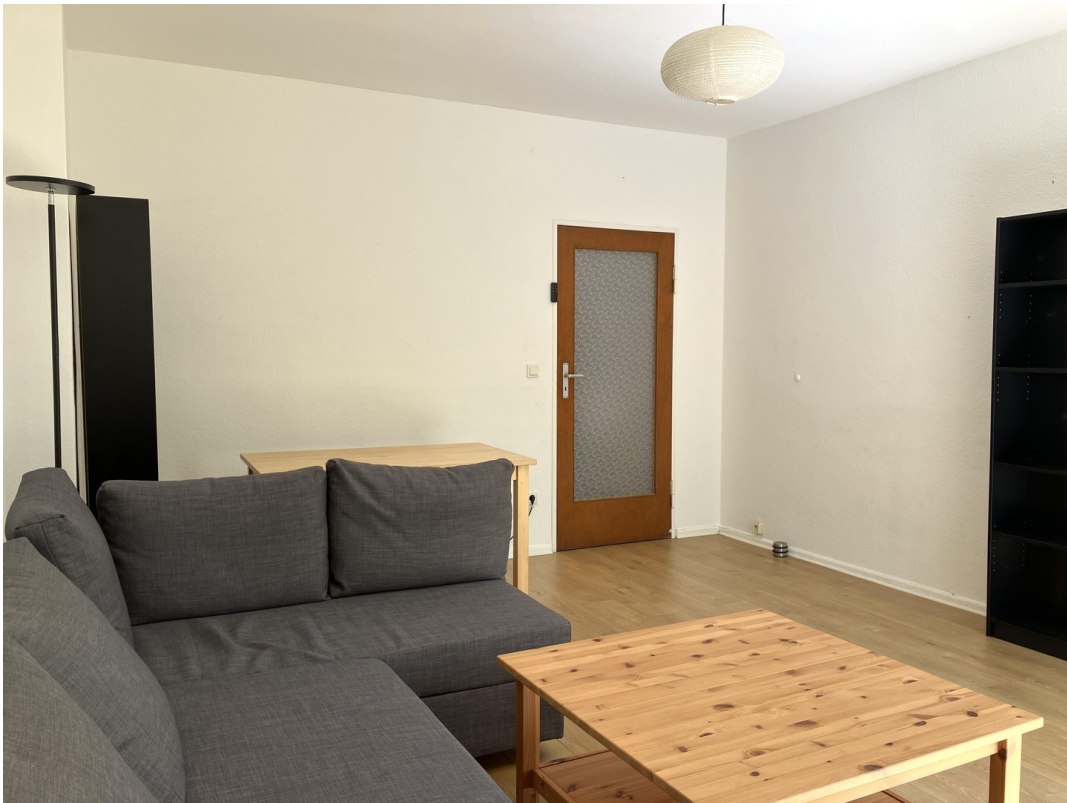
Wohnzimmer, Blick zur Tür