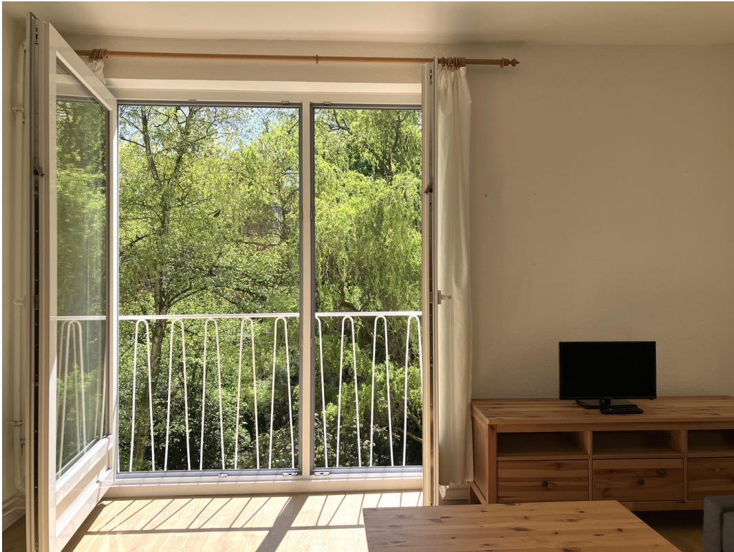
Wohnzimmer, Blick aus Fenster