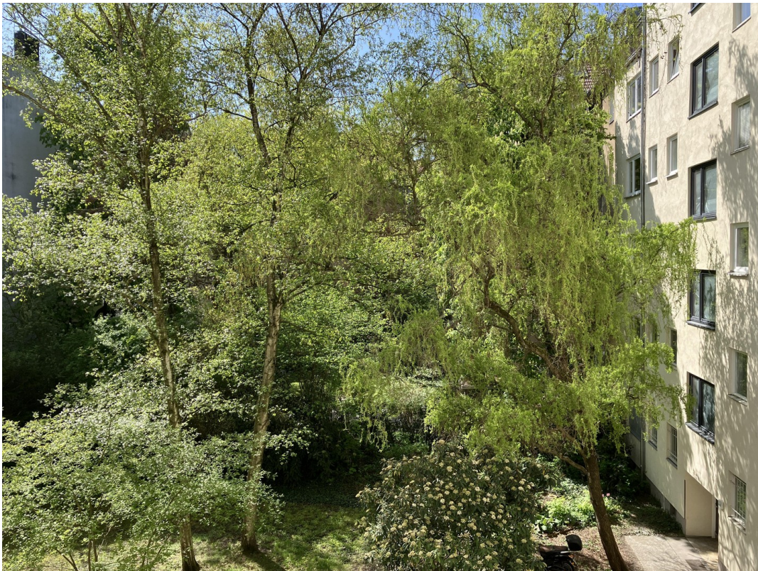
Blick in den Innenhof