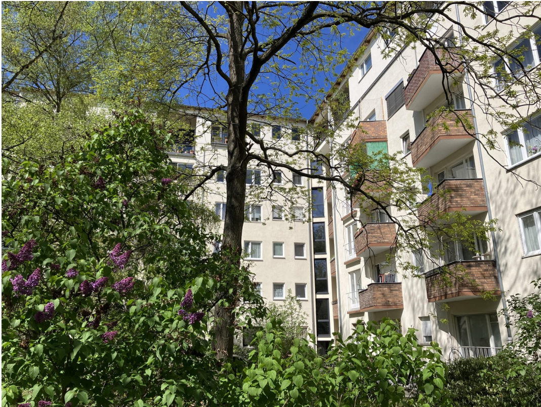
Innenhof und Fassade