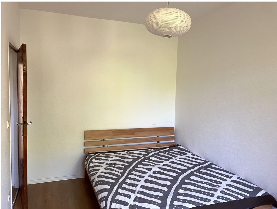
Schlafzimmer Bild 2