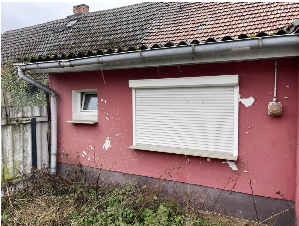
Fassade vom Garten 3