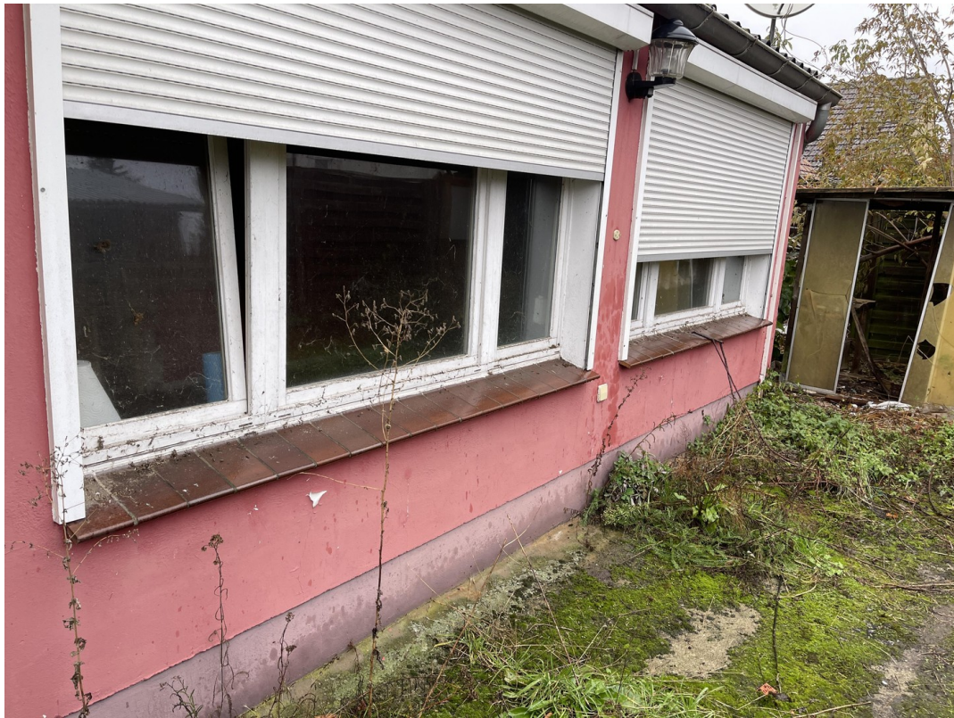
Fassade vom Garten 2