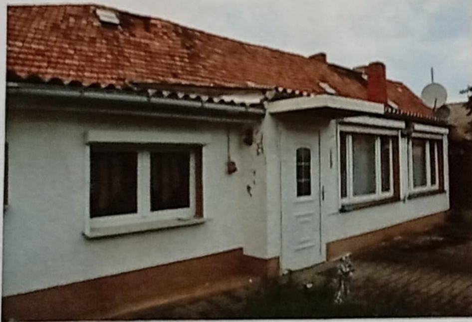
Hofseite des Hauses