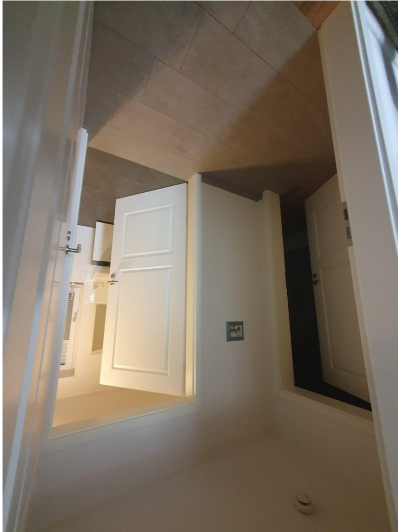
Flur zum Schlafzimmer und Bad