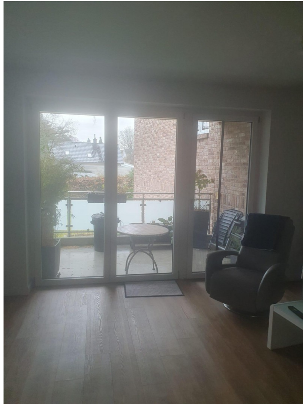
Blick auf den Balkon