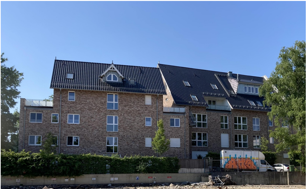
Ansicht Nordseite, Eingang