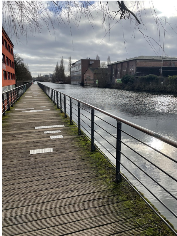
Veringkanal 5 min Fußläufig