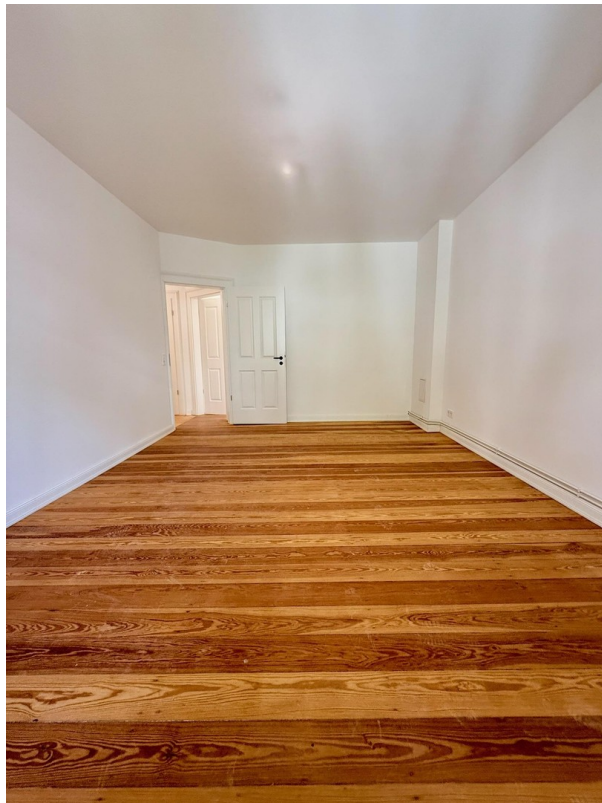
Zimmer 2 Rückansicht