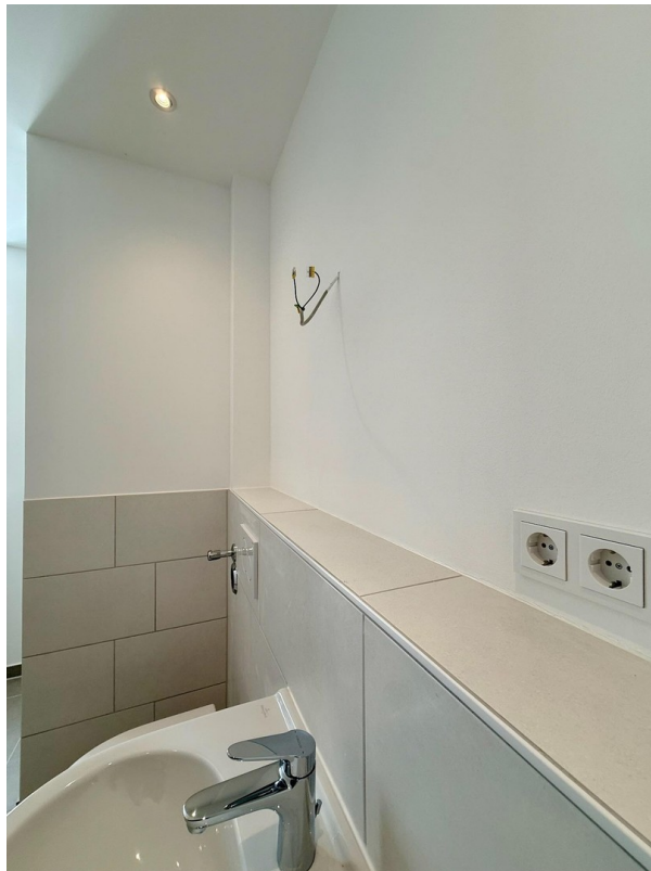
Anschluss für Spiegel etc.