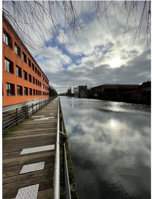
Veringkanal 5 min Fußläufig