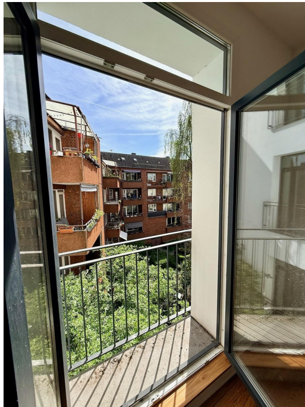
Aussicht Franz. Balkon