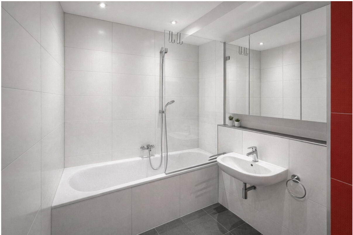
Bad mit WC