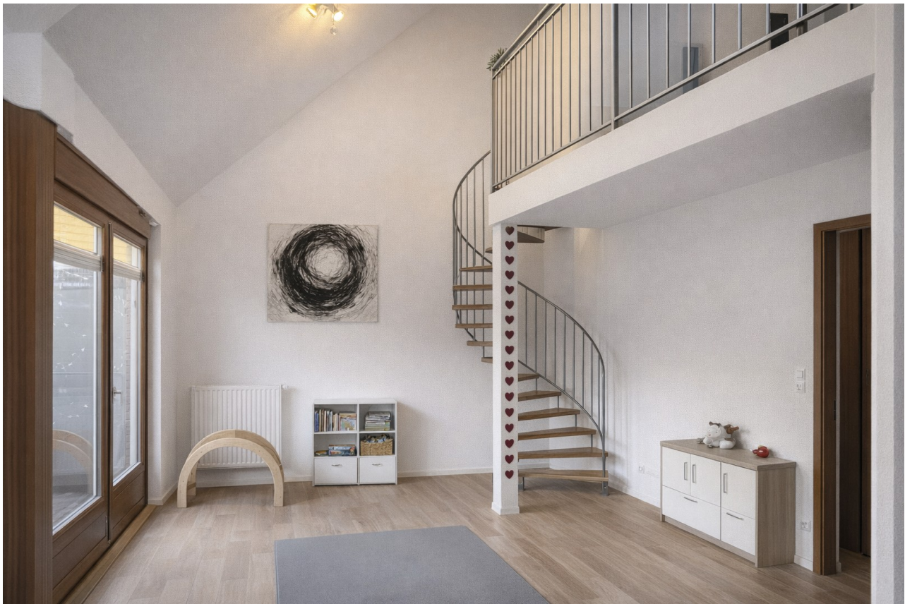
Wohnbereich - Ausgang Galerie