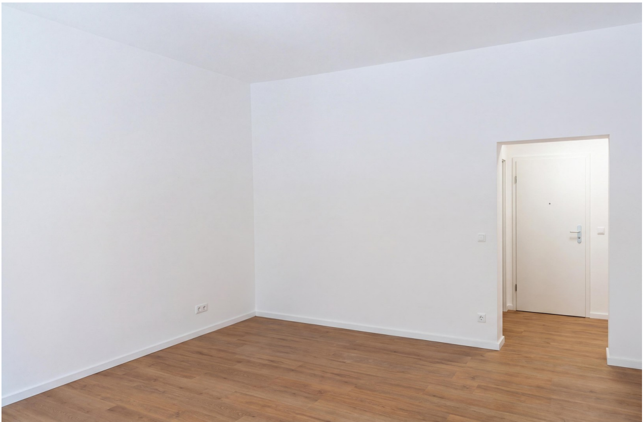
Wohn & Schlafzimmer zum Flur