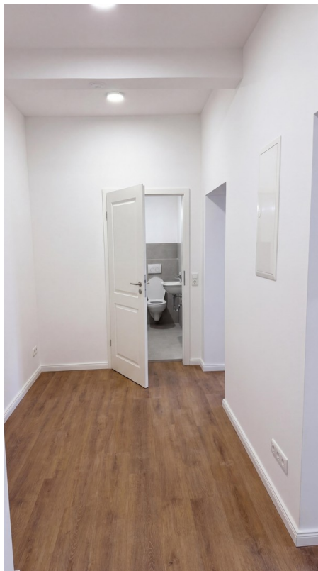
Flur mit Blick auf das Bad