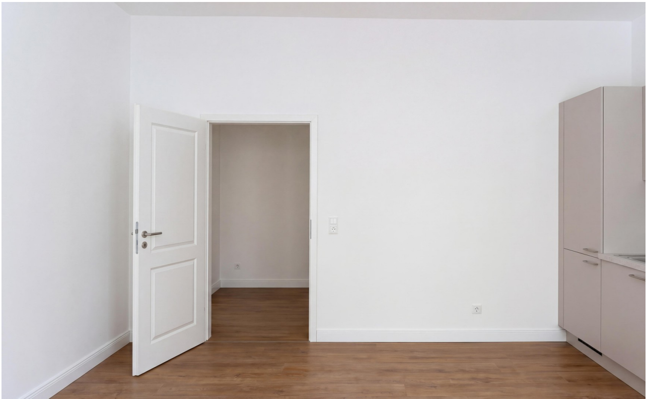
Küche zum Flur