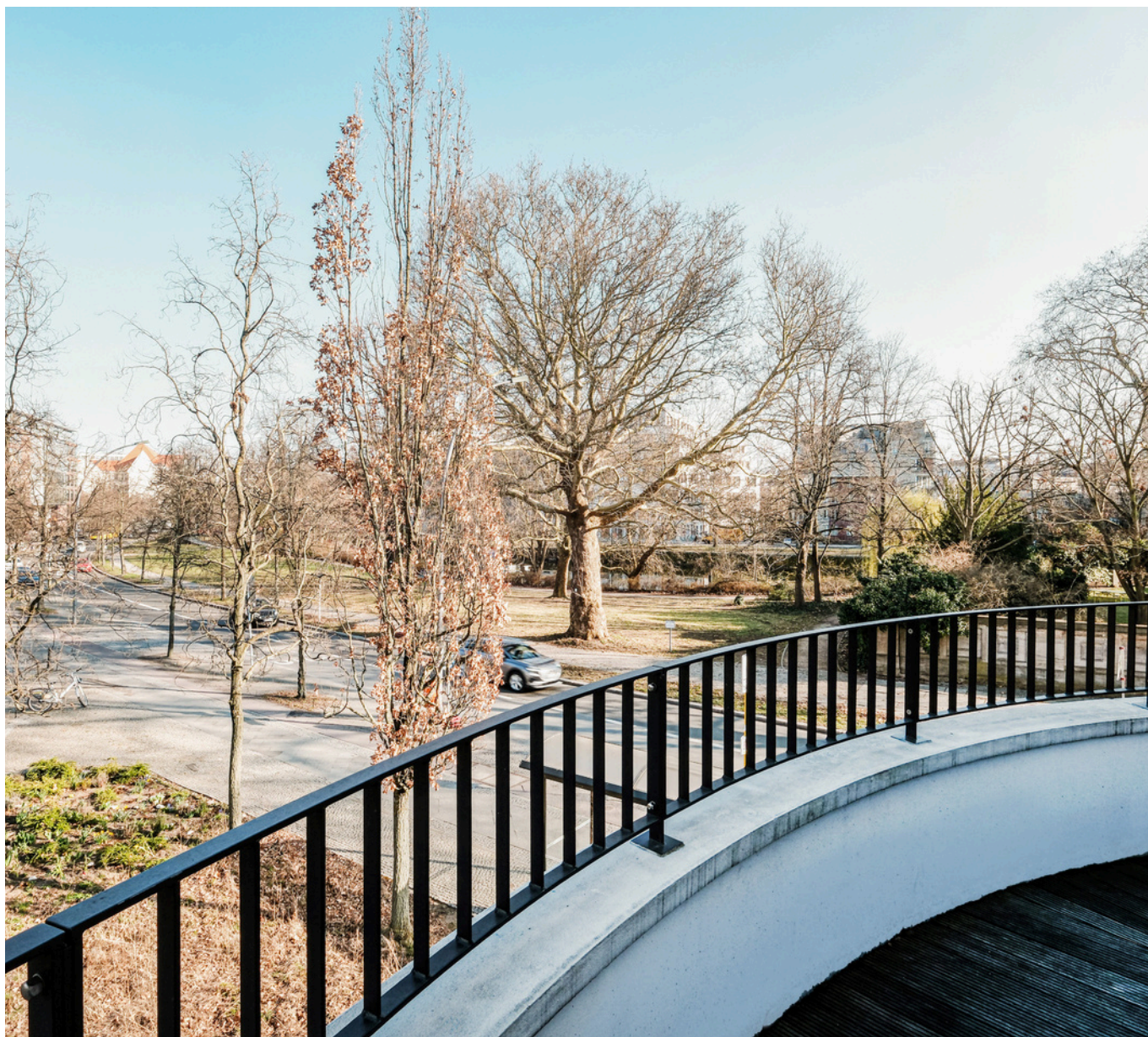
Balkon mit Blick zum Herkulesufer