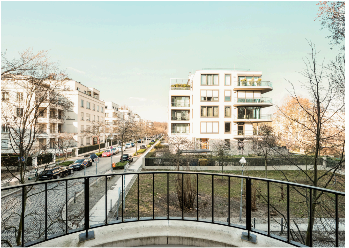
Balkon mit Blick in den Diplomatenpark