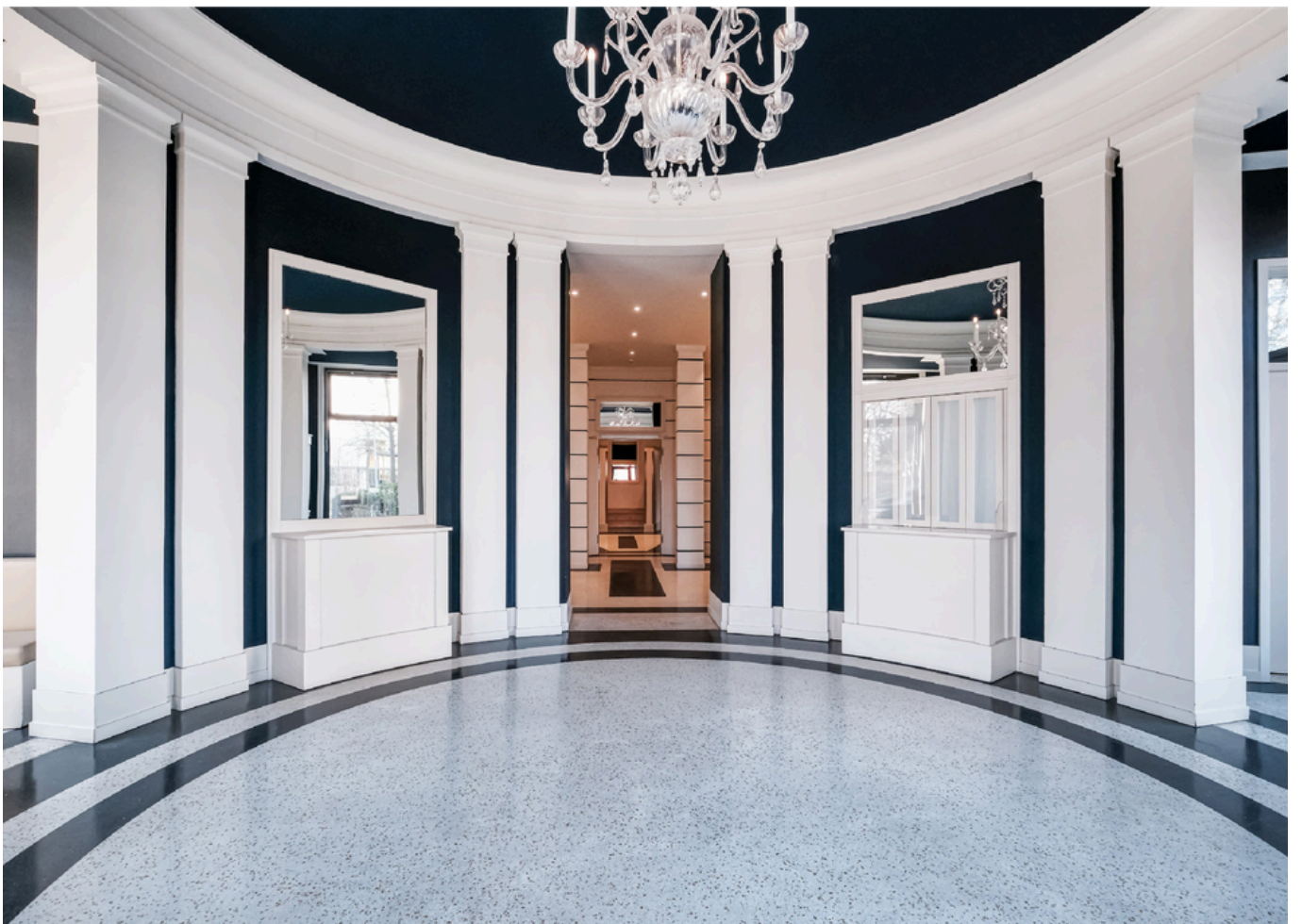
Repräsentativer Eingangsbereich mit Concierge