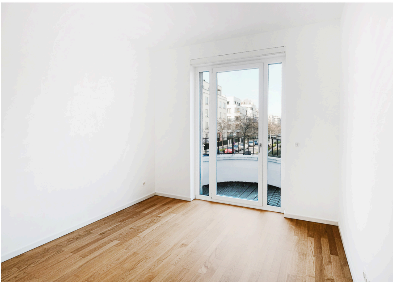
Weiteres Schlafzimmer mit Balkon