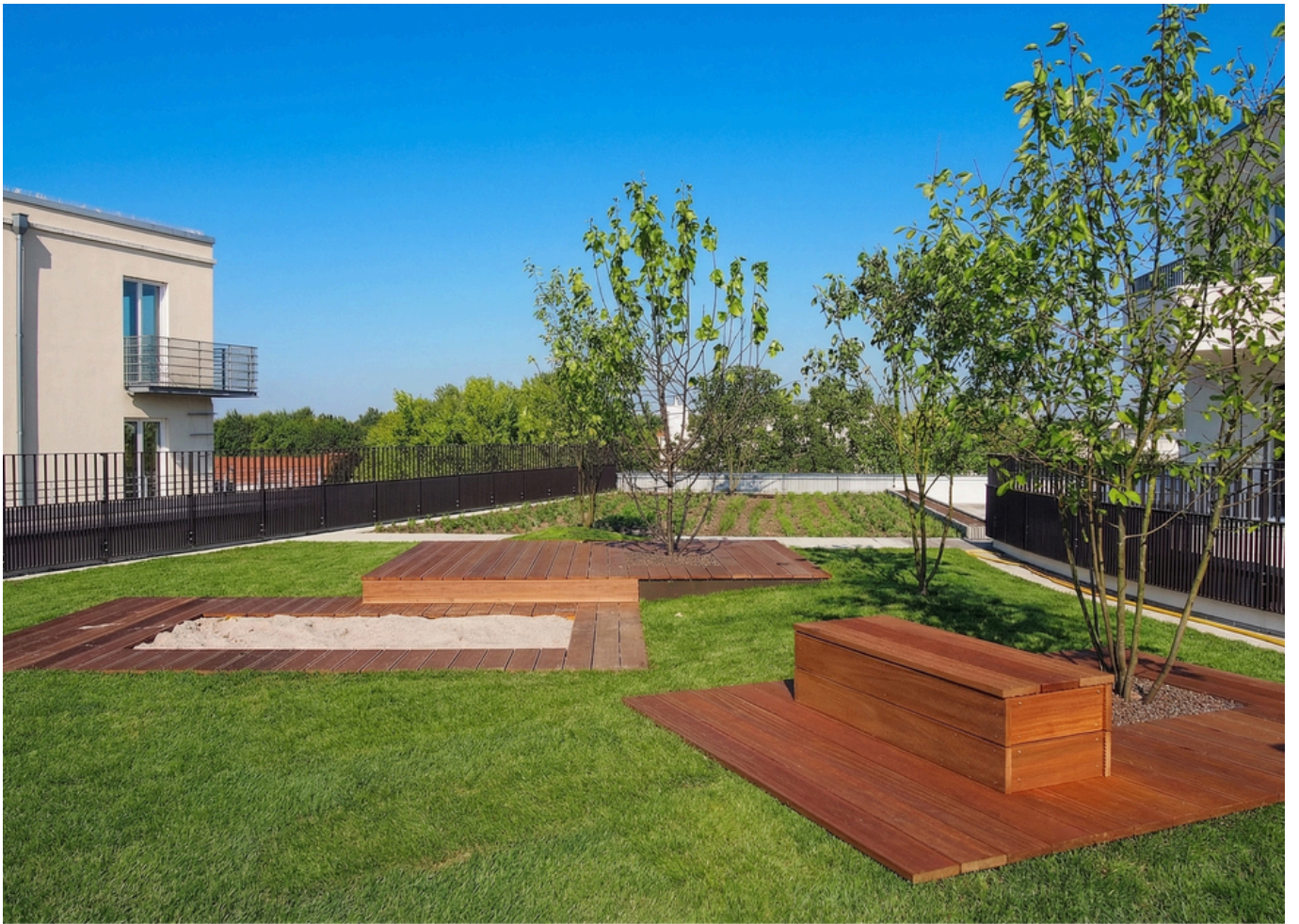
Gemeinschaftsdachterrasse im Sommer