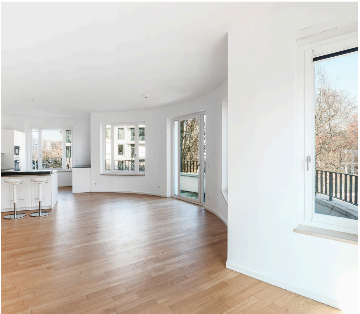
Wohnbereich mit Zugang zum Balkon