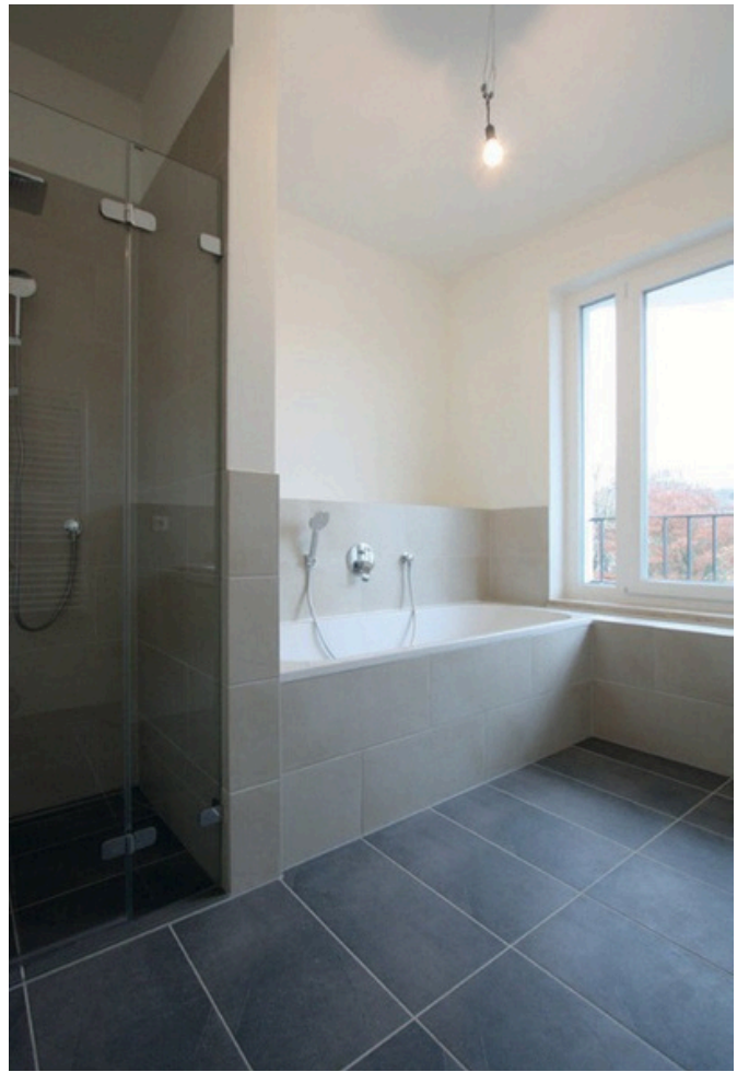
Weitere Ansicht Vollbad