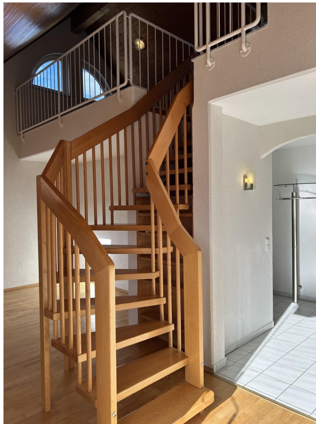
Flur und Treppe zur Galerie