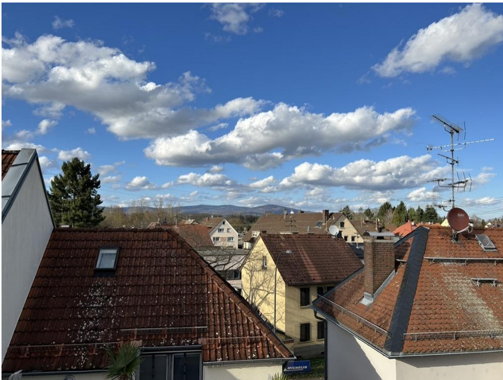
Blick nach draußen von Galerie