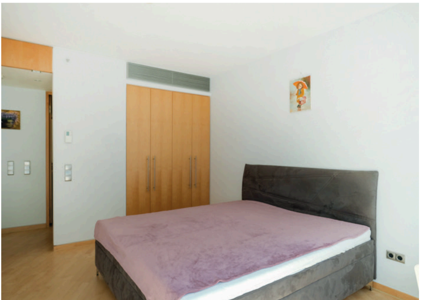
Schlafzimmer mit Einbauschränk