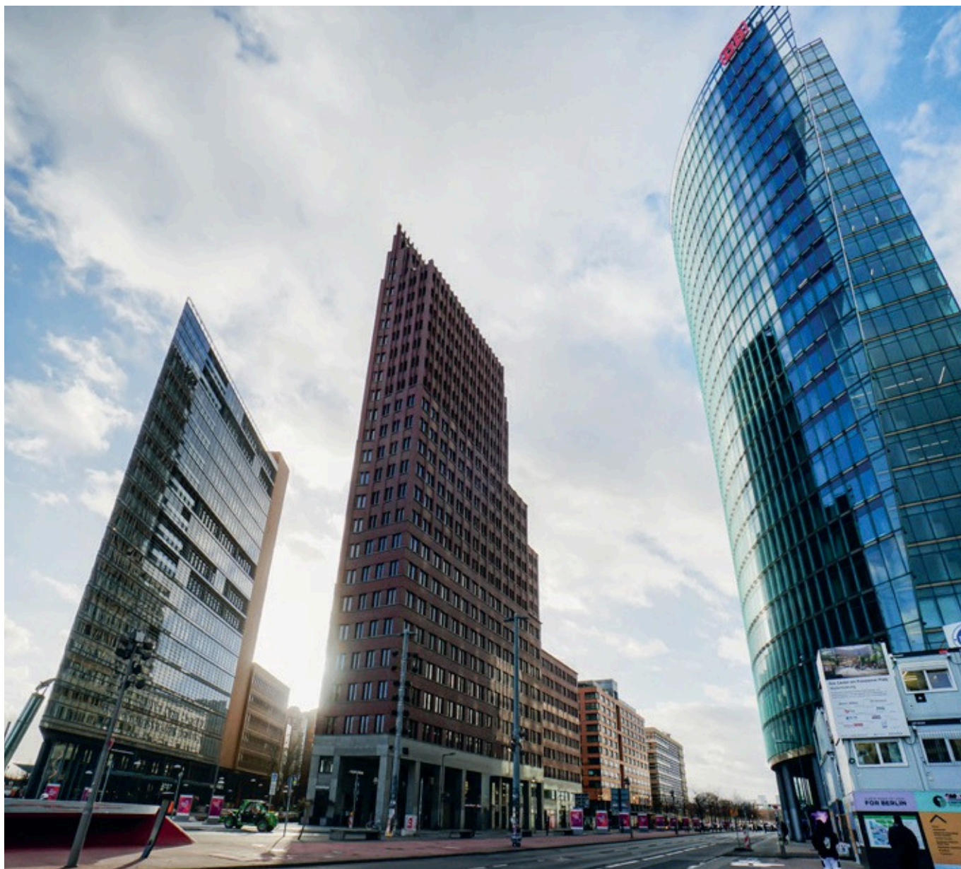
Der Potsdamer Platz