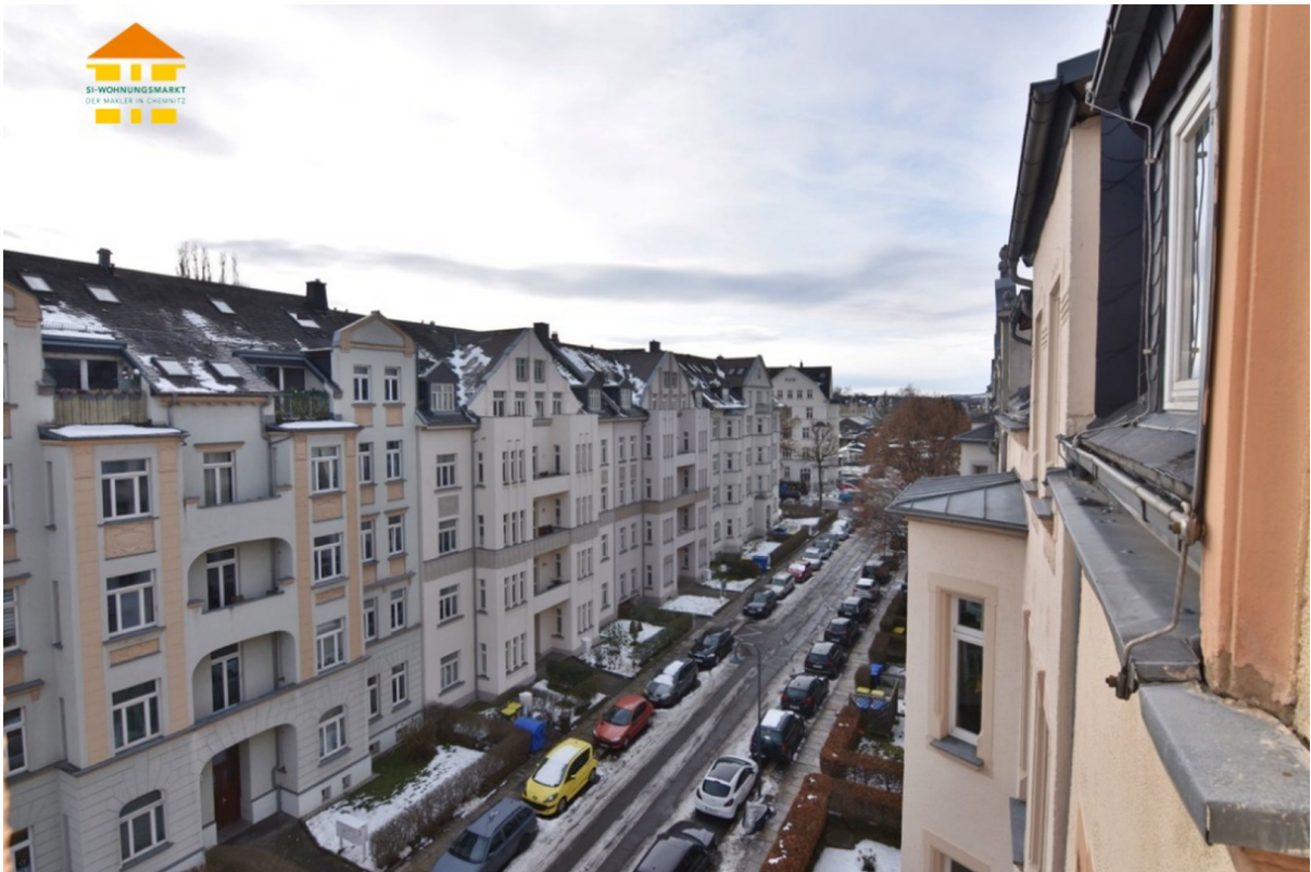
Ausblick auf den Kaßberg