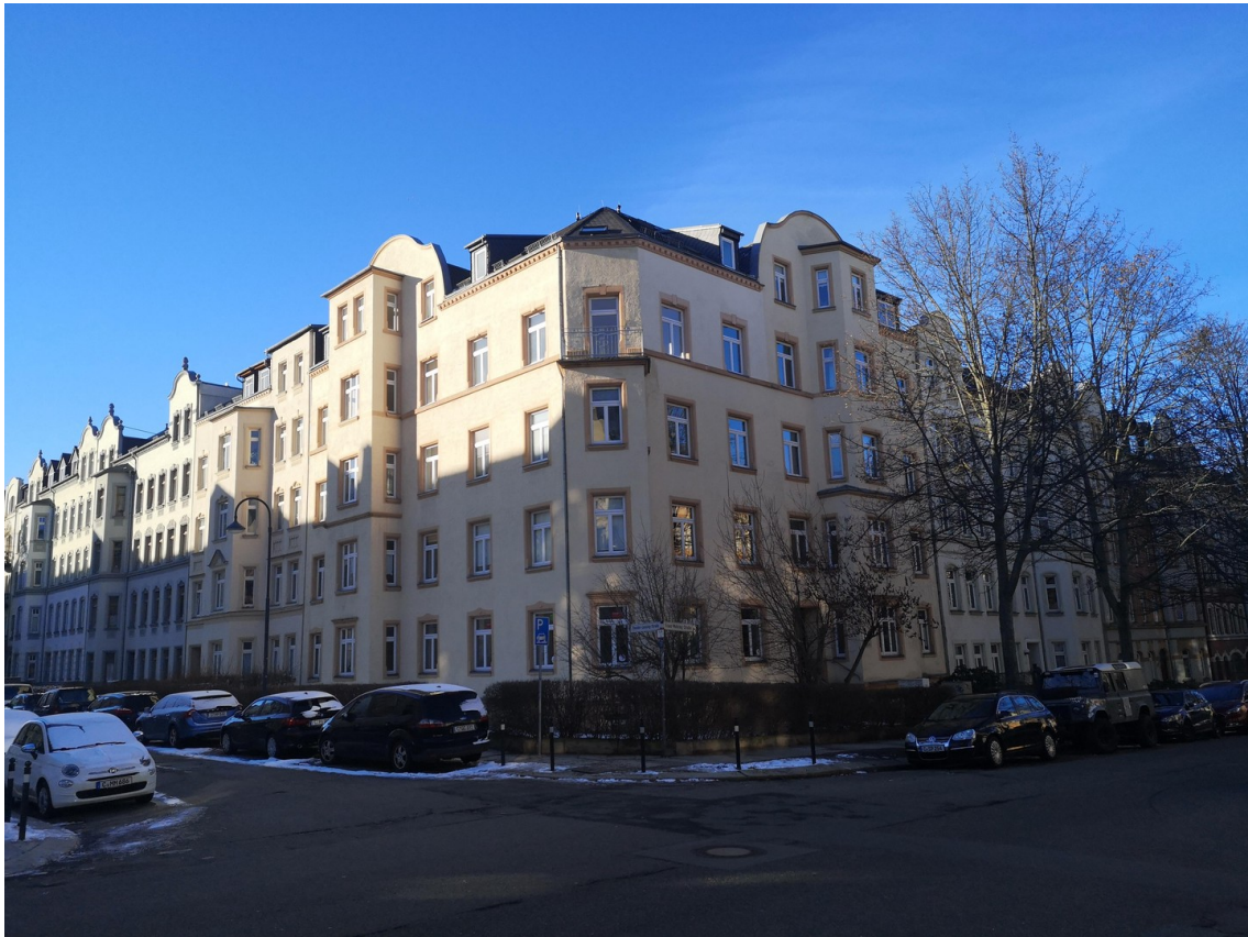
Blick auf das Haus