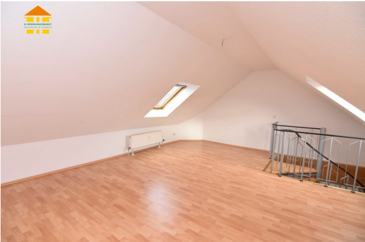
Oberes Stockwerk 1