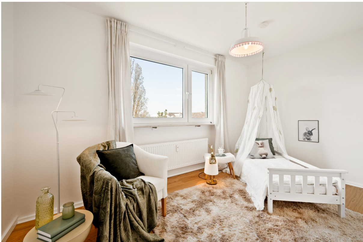
Kinderzimmer oder Arbeitszimme