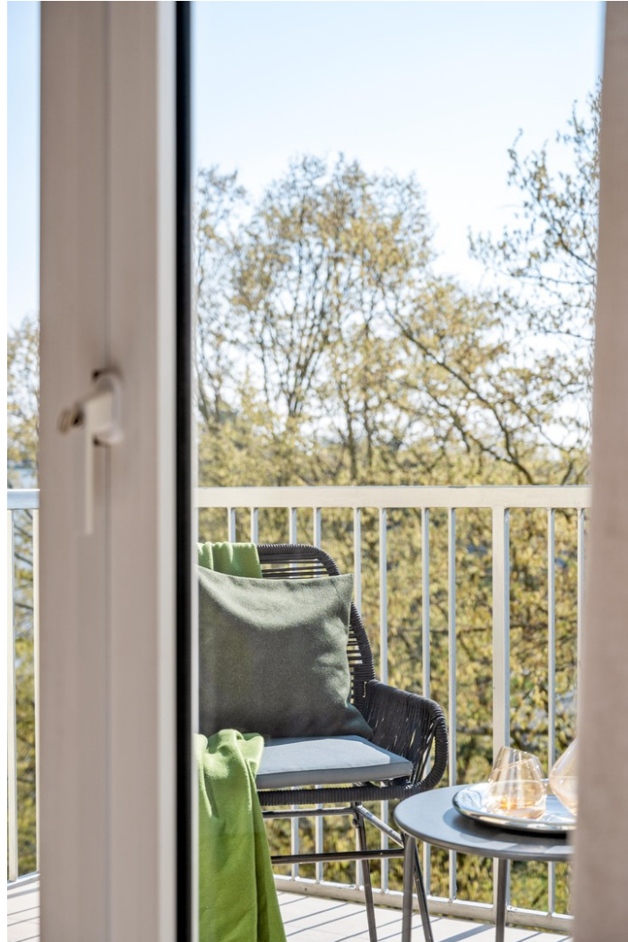
Blick ins grüne