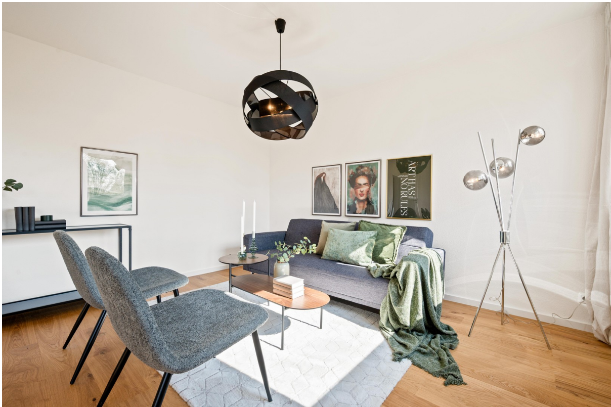
Wohnbereich - Ausschnitt