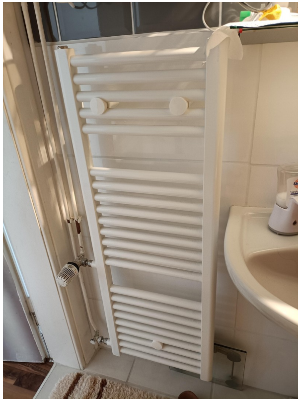
HK - Bad