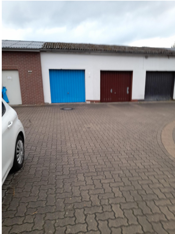
Garage links - momentan braun