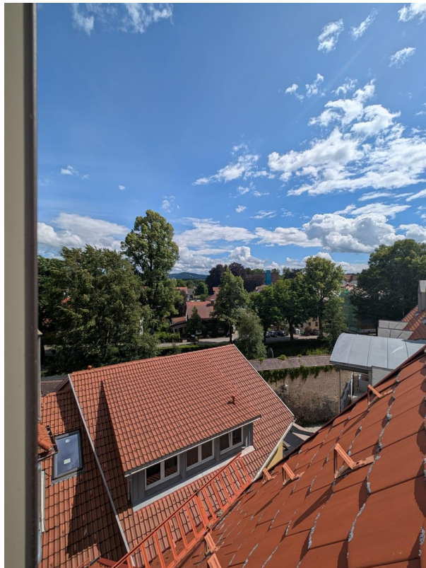
Ausblick Richtung Stadtmauer