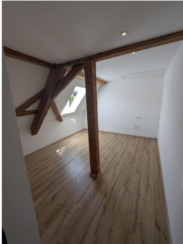
ein SZ im OG mit el. Dachfenst