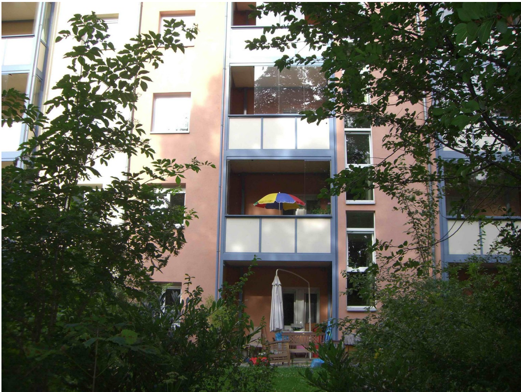
Balkon vom Garten