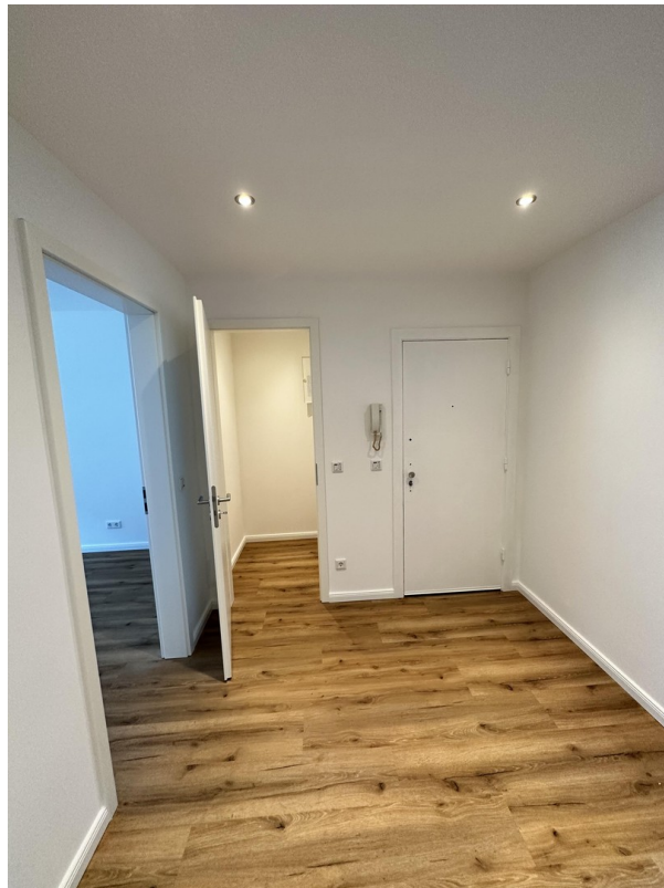
Flur mit Abstellkammer