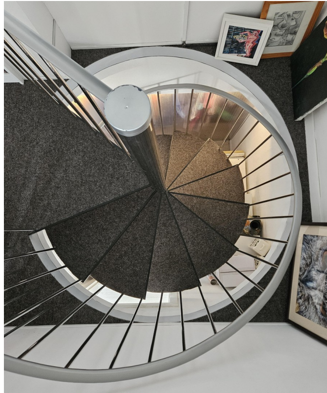
Wendeltreppe zur 1. Etage