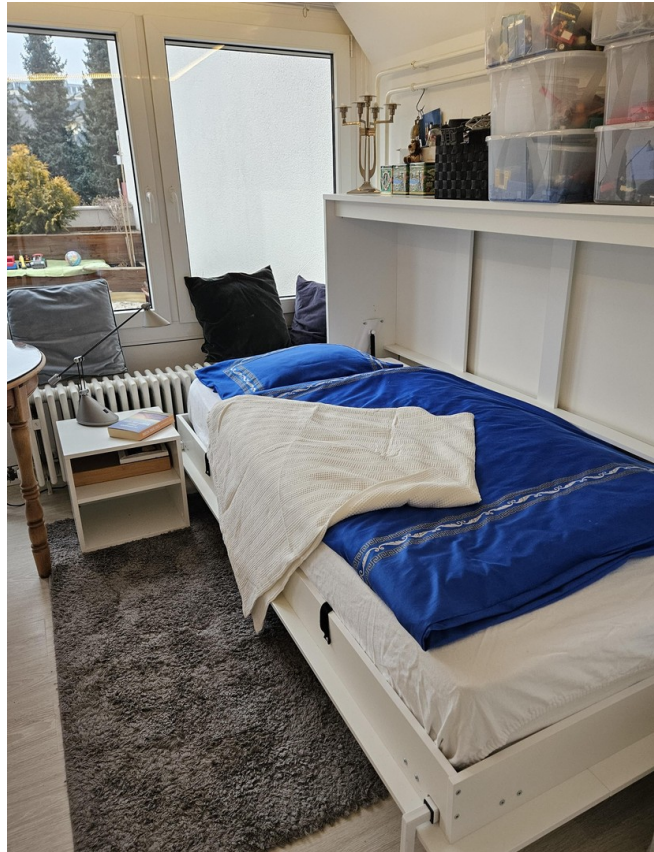
Raum im 1. Stock/Gästezimmer