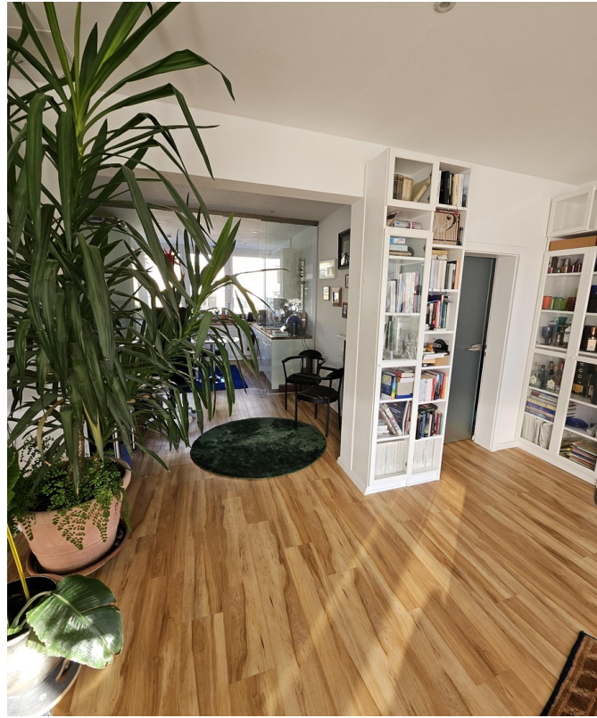
Blick in den Küchenbereich