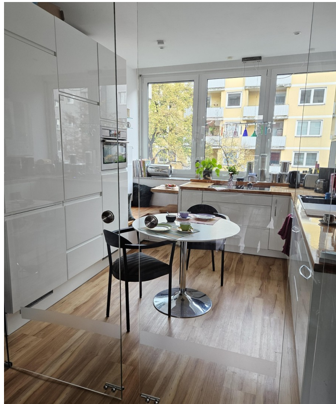
Küche mit großen Glastüren