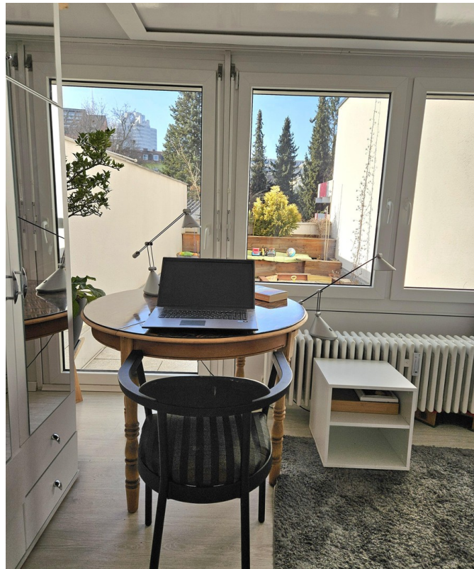
Raum im 1. Stock/Arbeitsplatz