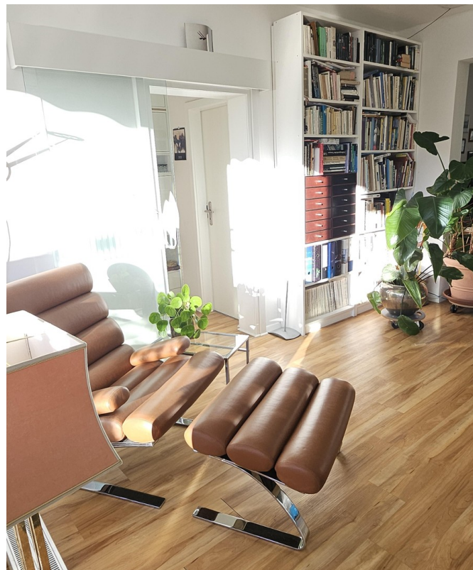
Lesecke am gr. Terrassenfenst