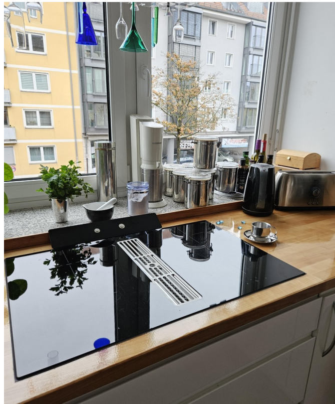
Ausstattung mit Markengeräten