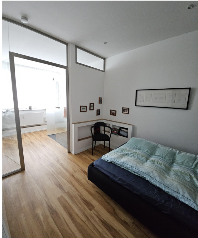
Bad en suite