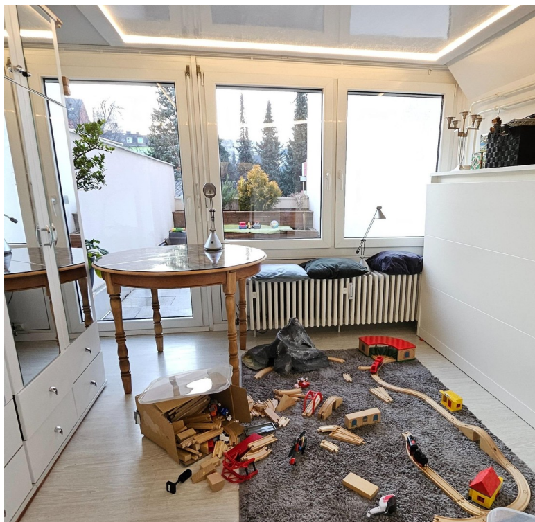
Raum im 1. Stock/Kinderzimmer