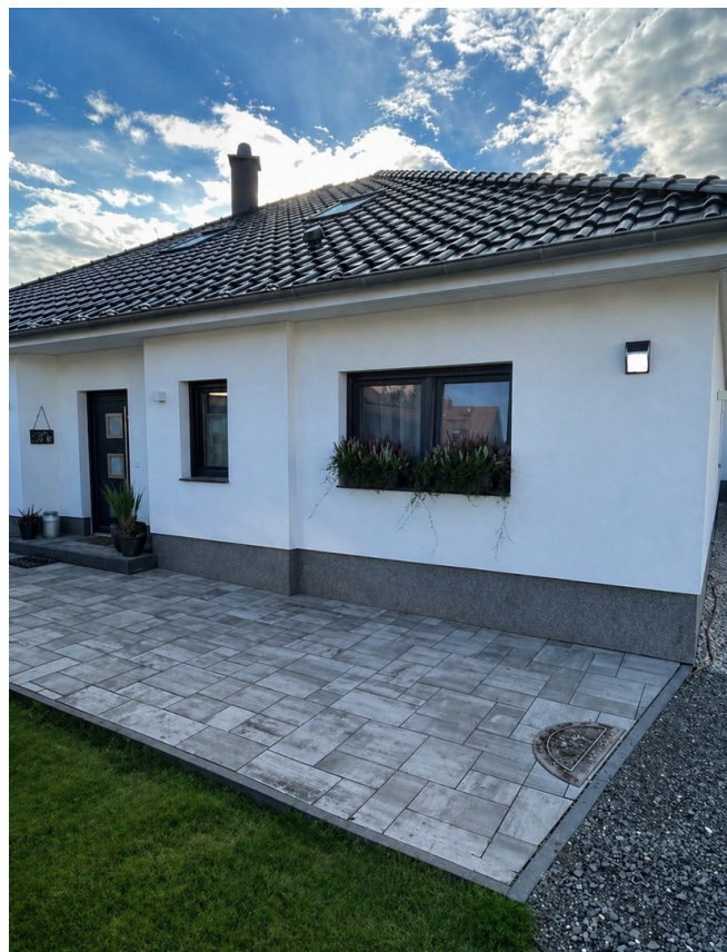
Haus Ansicht vorne