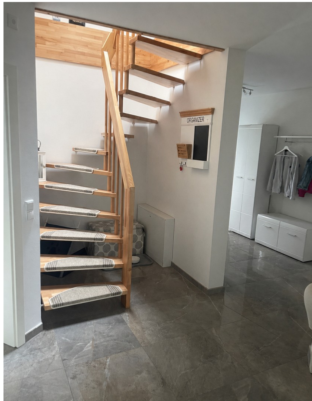
Aufgang zum Arbeitszimmer