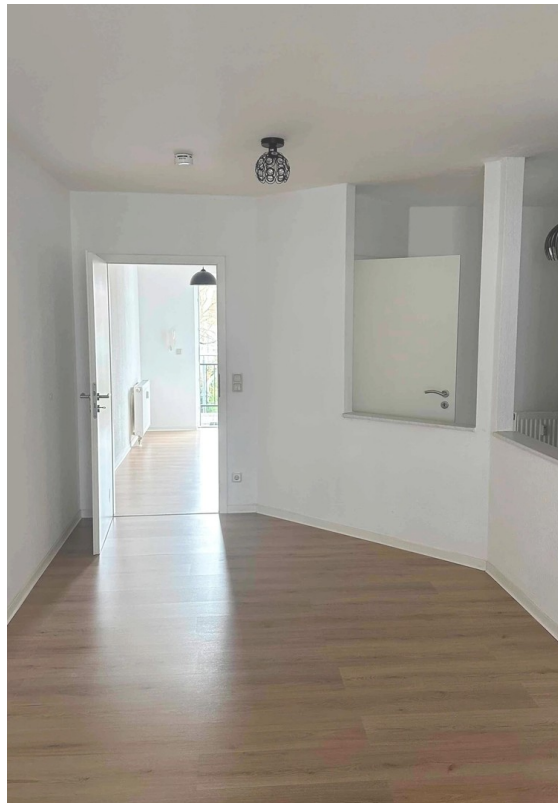
Wohnzimmer Blick Richtung Flur