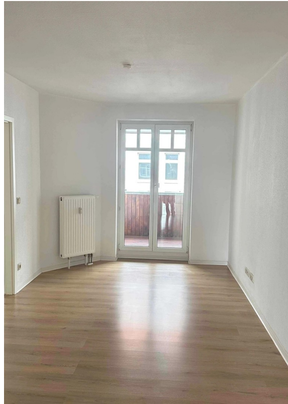
Wohnzimmer Blick Balkon