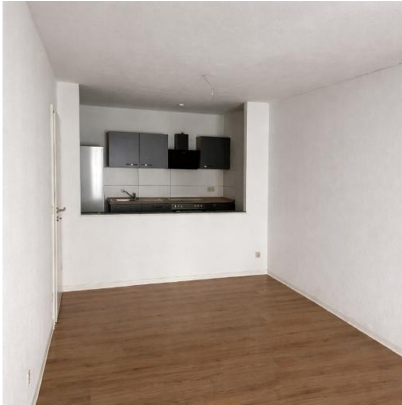
Blick zur halb-offenen Küche