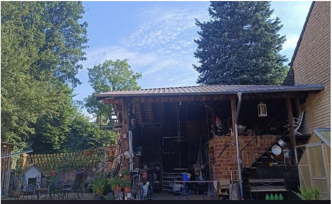
Aufgang zum Garten / Heide