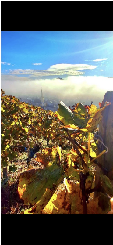
Kurstadt Bad Neuenahr Ahrw.