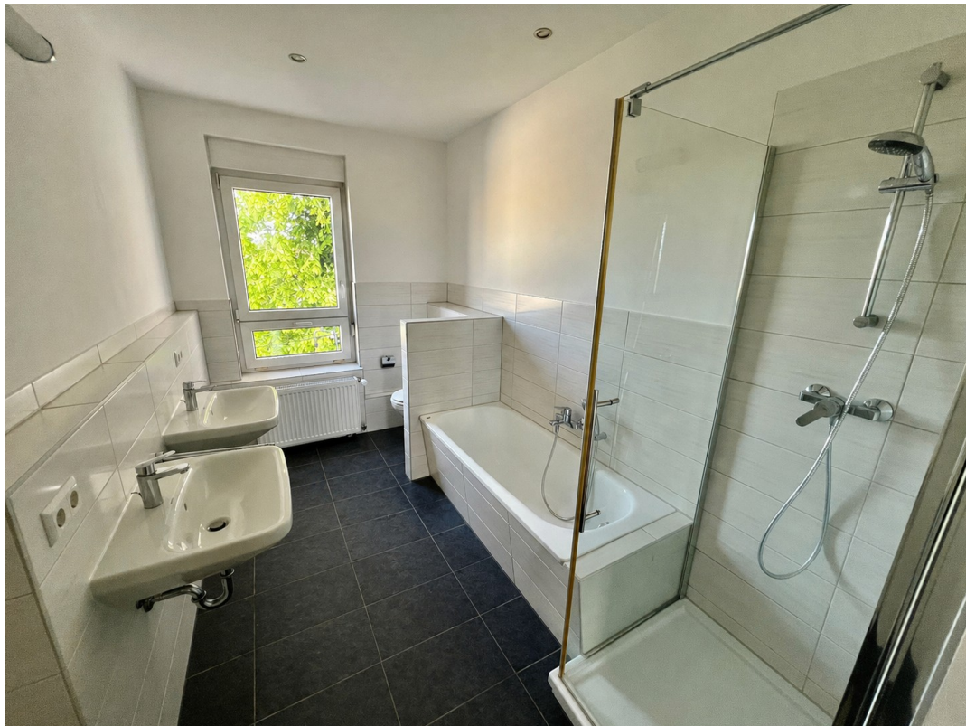
Bad mit Wanne + Dusche