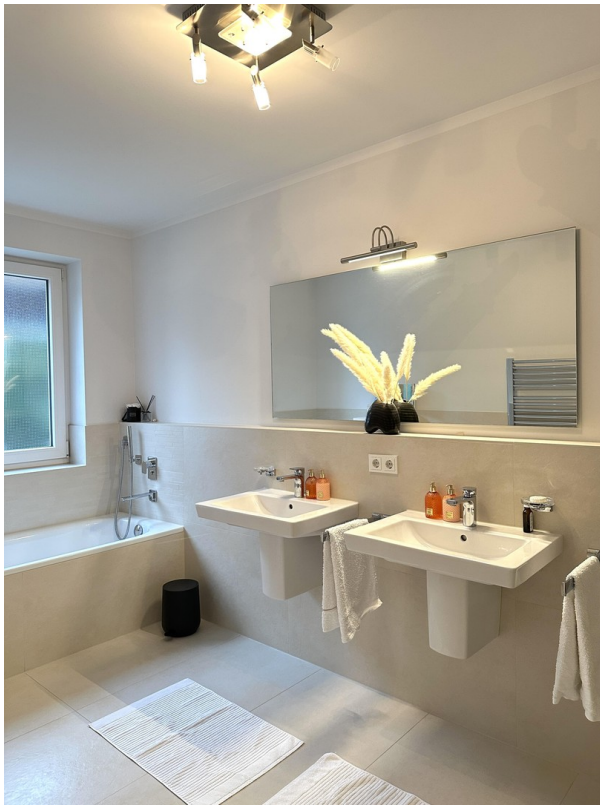
Master Bad 1