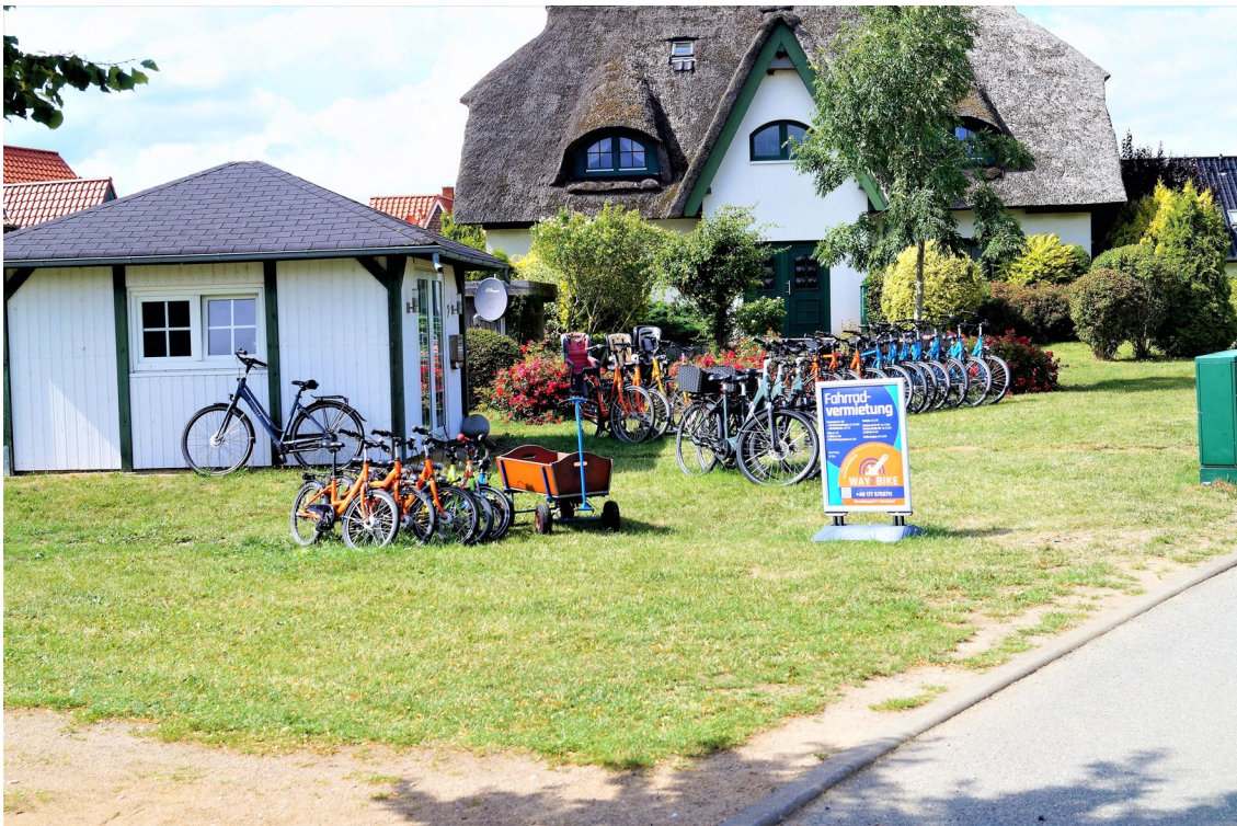
Fahrradverleih 1 min