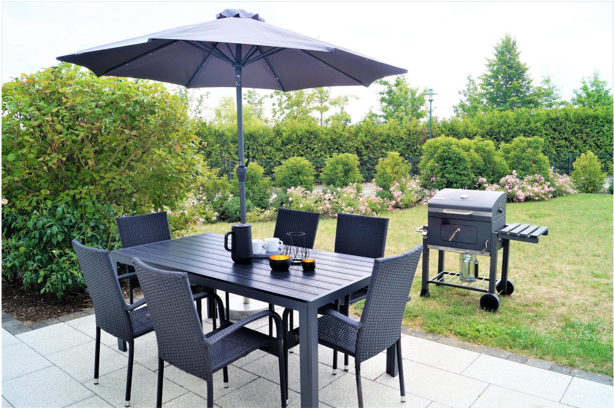
Terrasse mit Grill