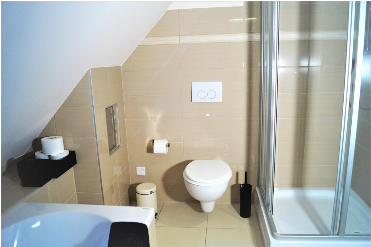
Badezimmer 1. OG