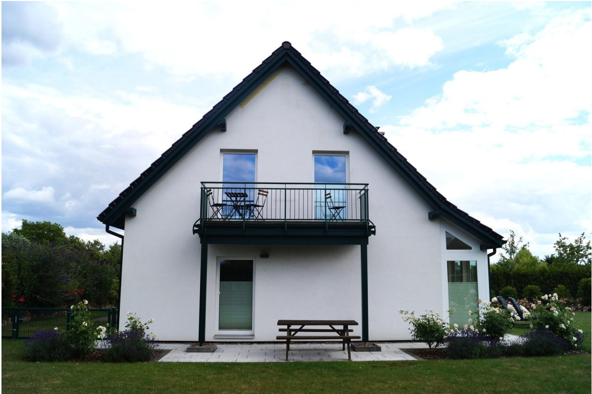
Balkon und 2. Terrasse