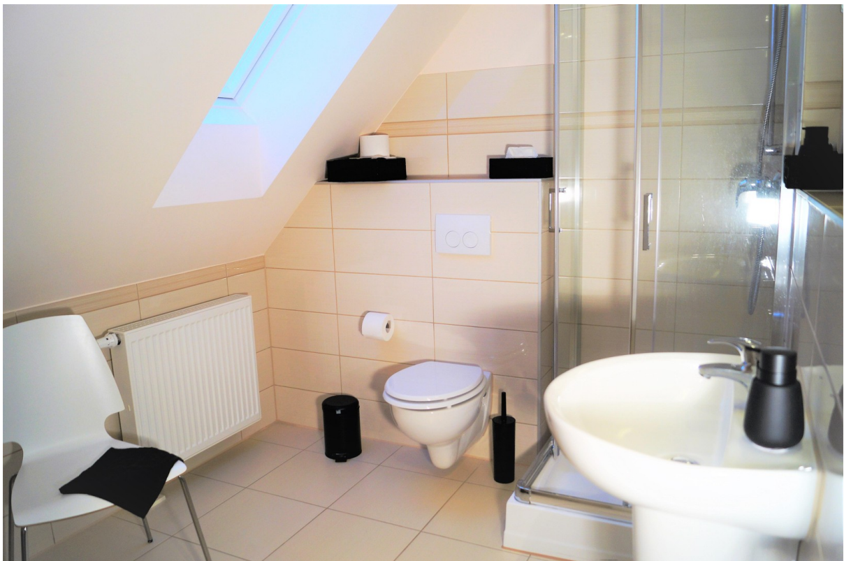
Badezimmer en suite