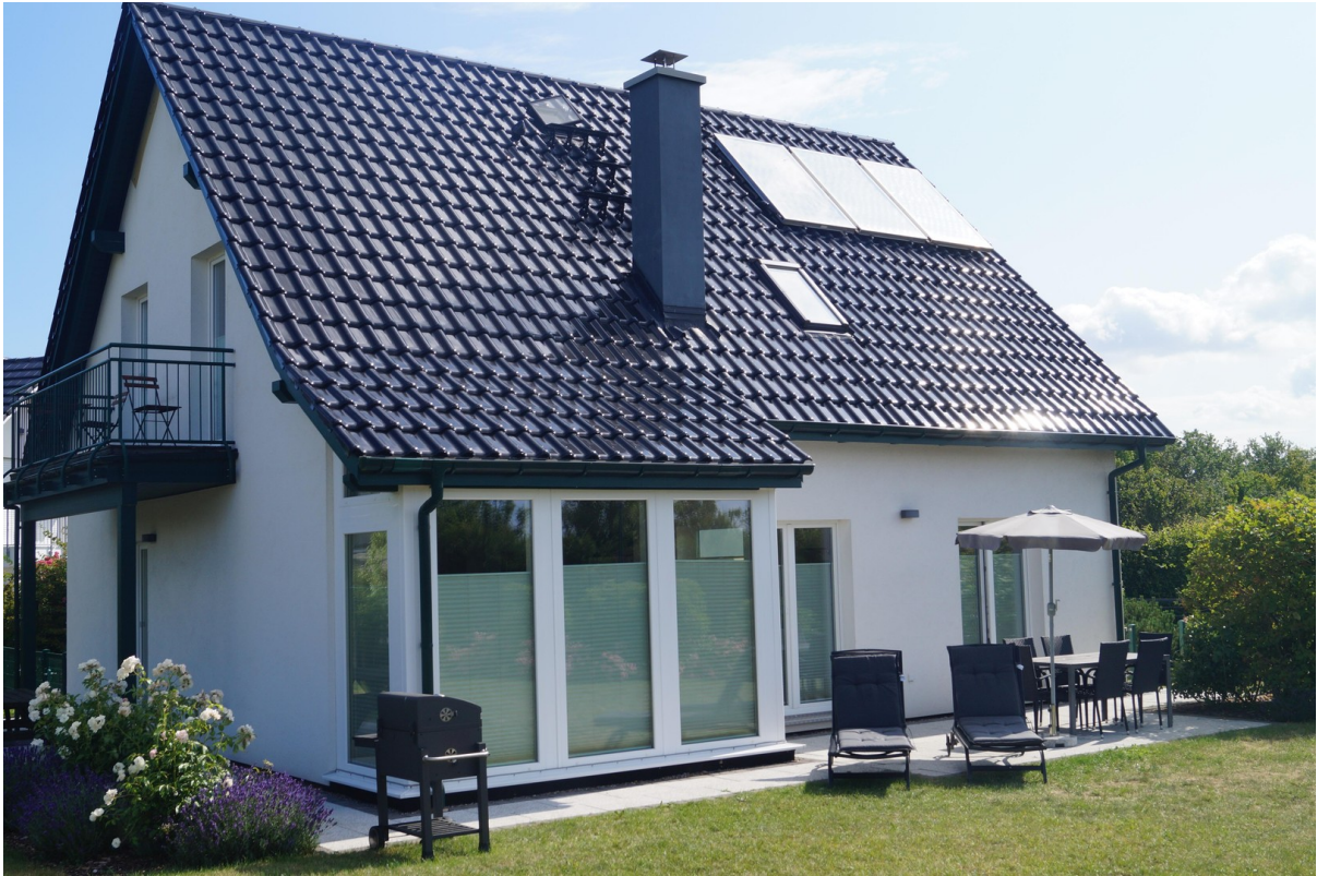
Wintergarten, Terrasse, Balkon