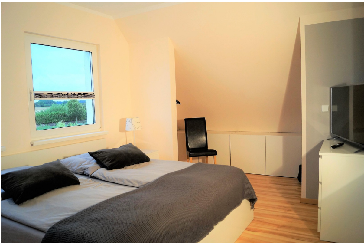
Schlafzimmer m. Kleiderschrank