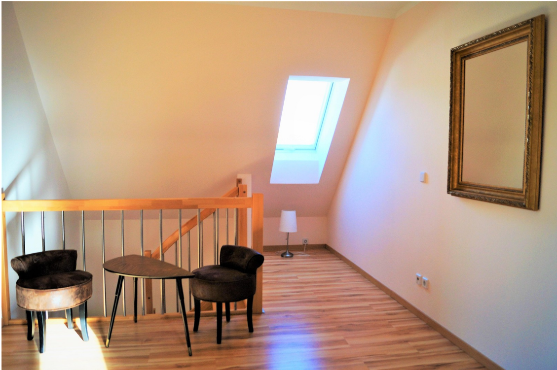
Galerie 1. OG