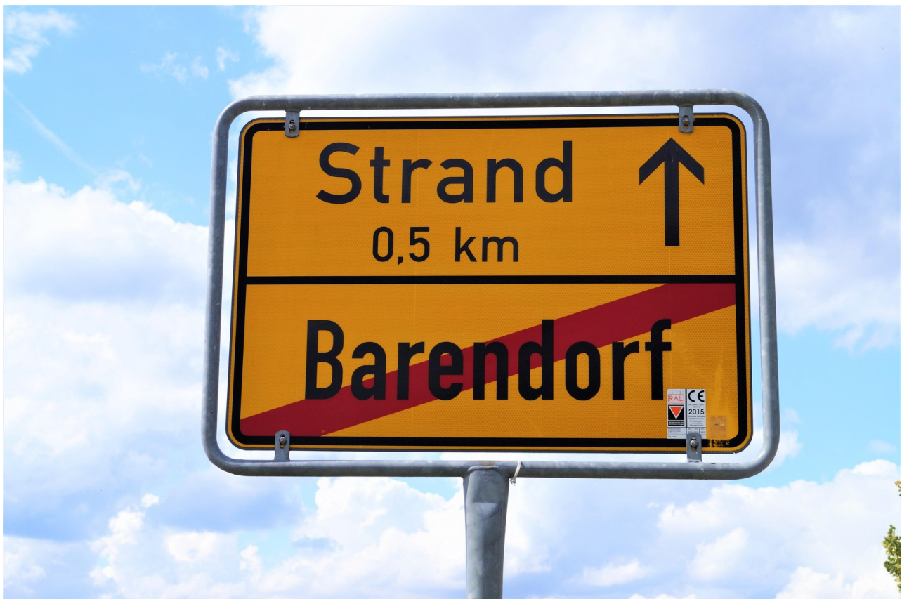
Weg zum Strand