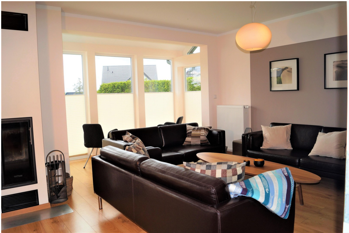
Wohnzimmer Ansicht 2