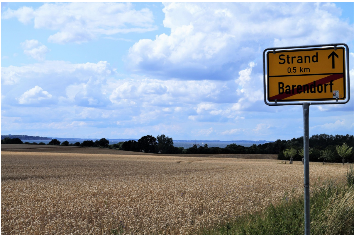
Weg zum Strand