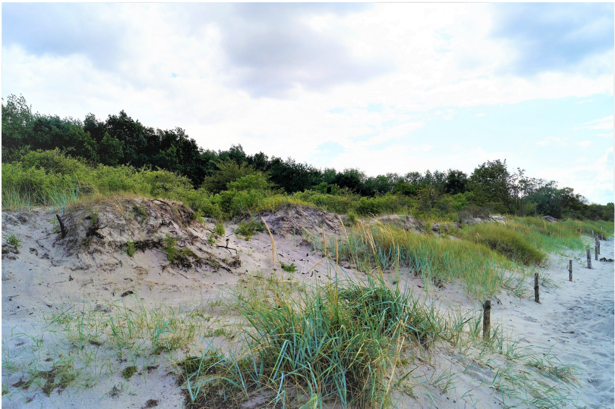
Dünenlandschaft am Naturstrand