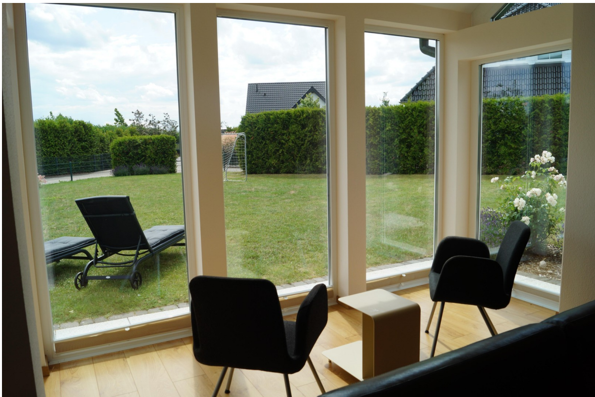
Kl. Wintergarten mit Ausblick