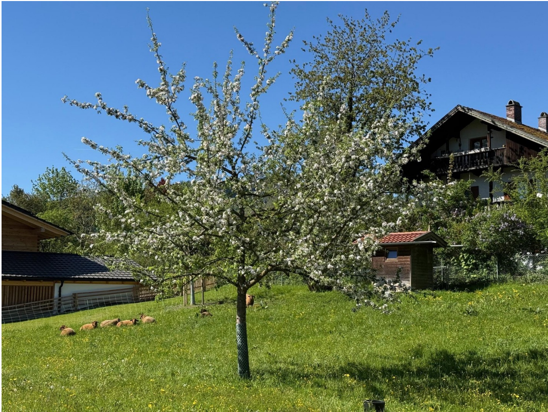
Idylle 1 Gehminute entfernt