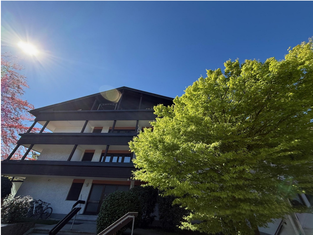
Gepflegte Wohnanlage 1