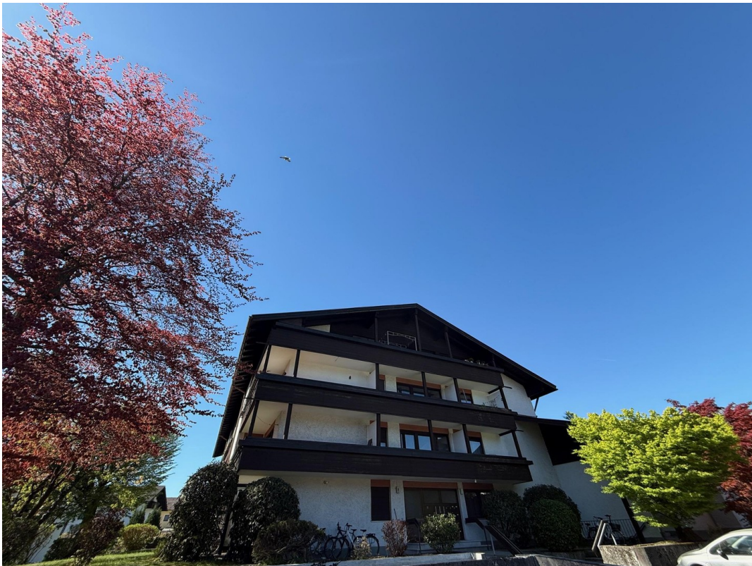
Gepflegte Wohnanlage 2