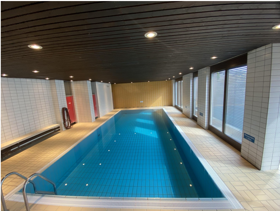
Privates Schwimmbad 1