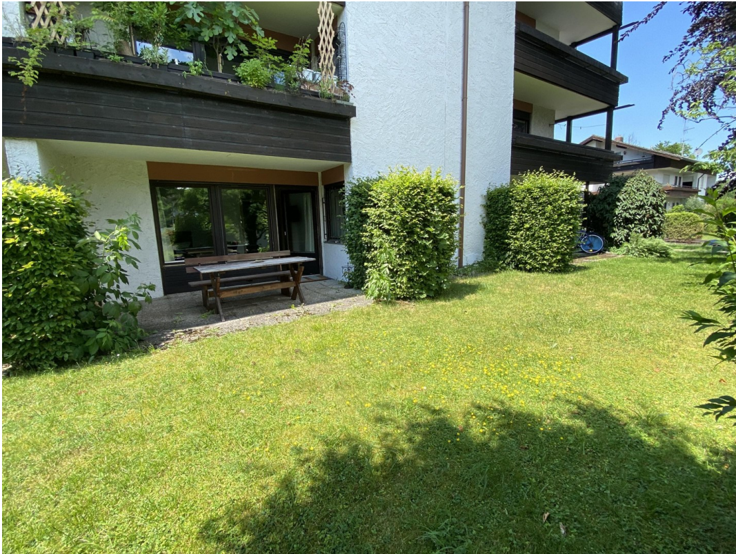
Private Terrasse 2