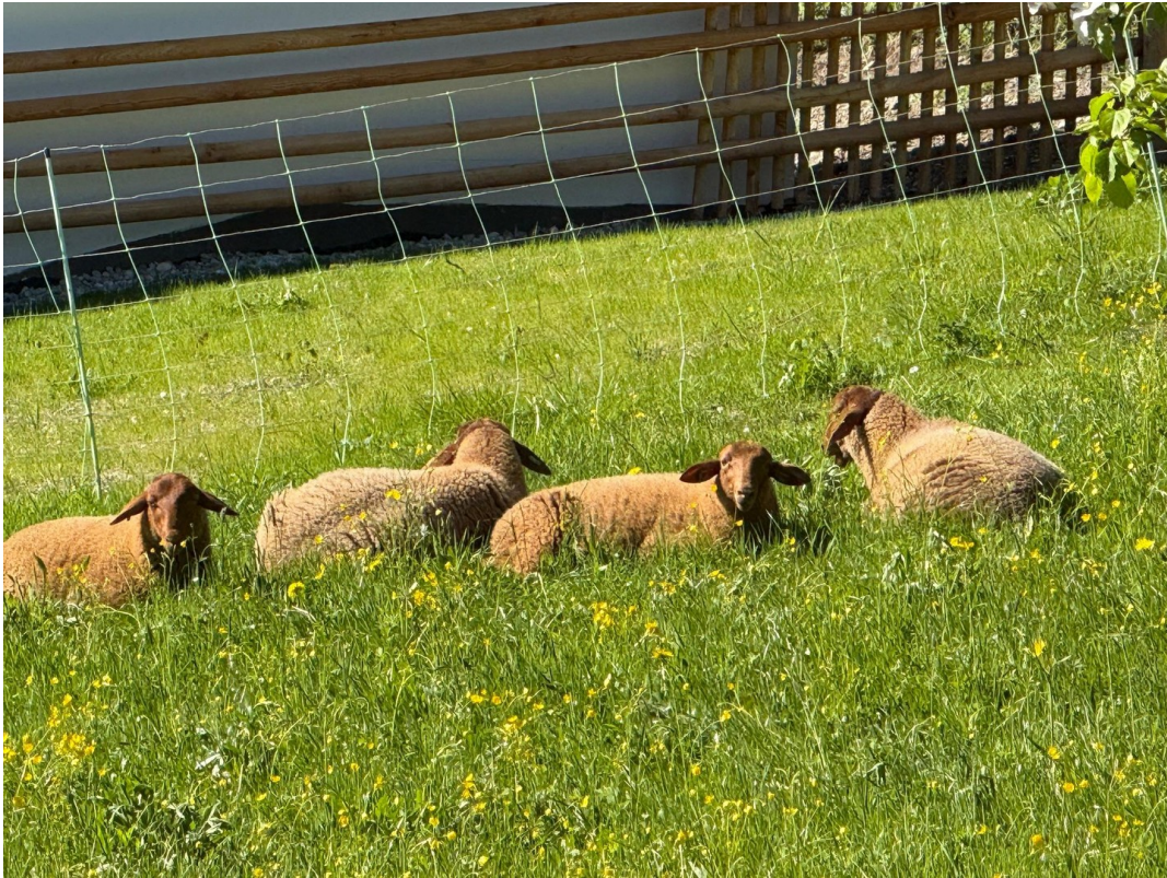
Idylle 1 Gehminute entfernt