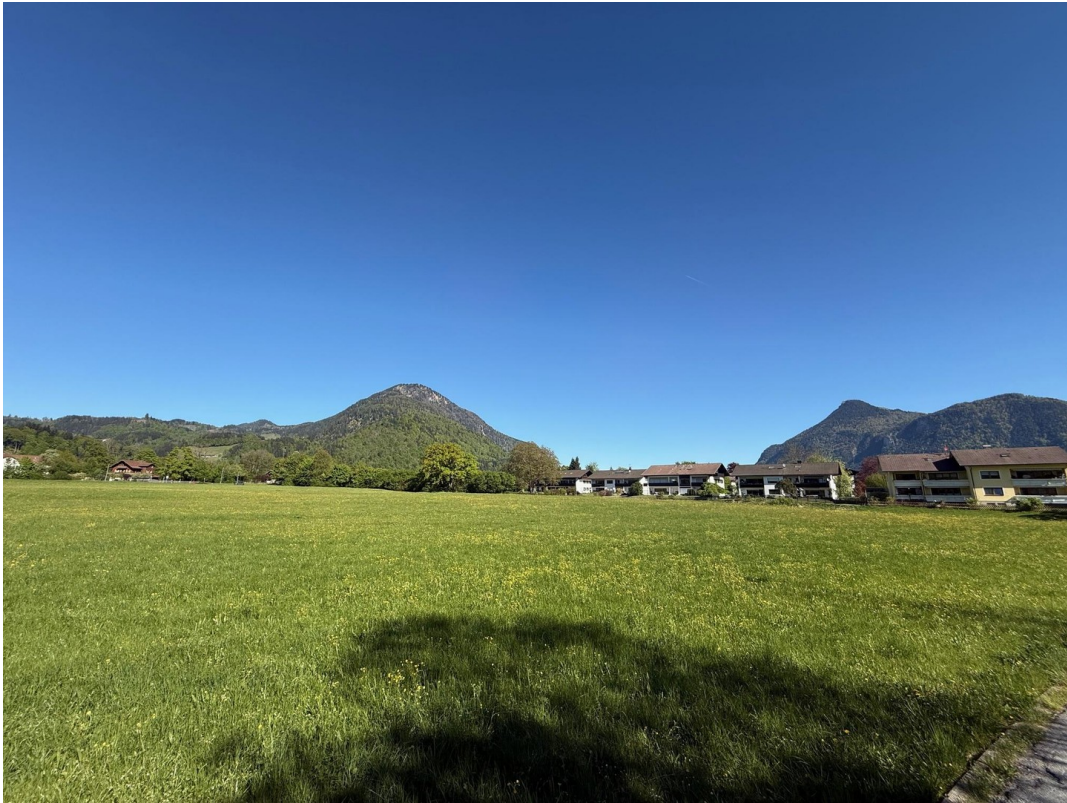
Siedlung im Grünen