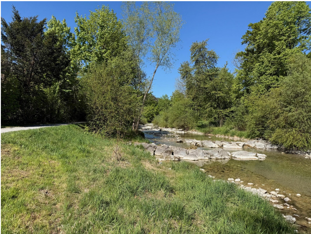
Idylle 2 Gehminuten entfernt