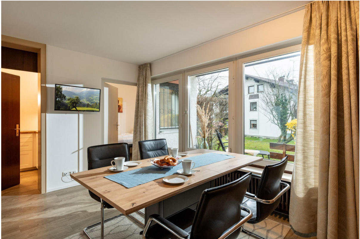
Wohn- und Esszimmer 2