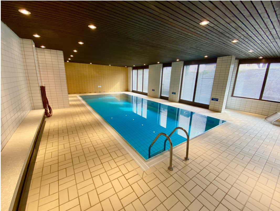
Privates Schwimmbad 2