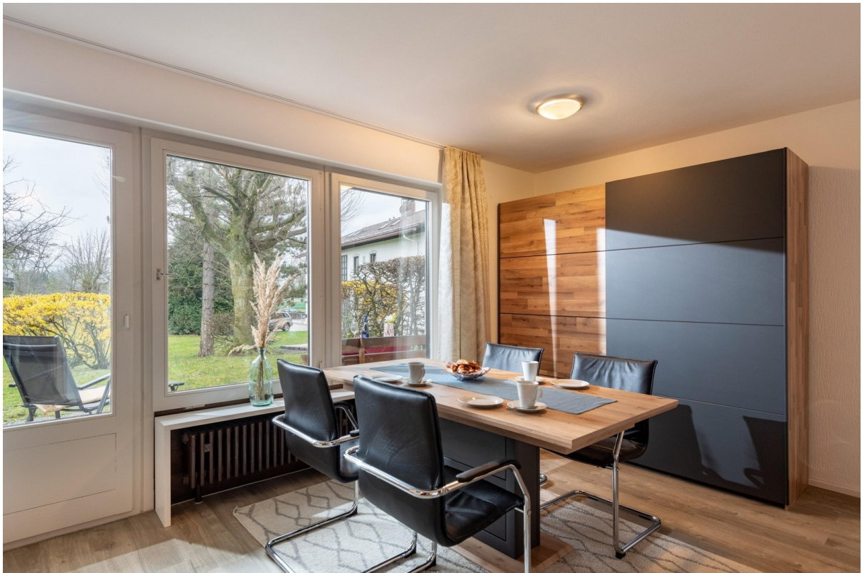
Wohn- und Esszimmer 1