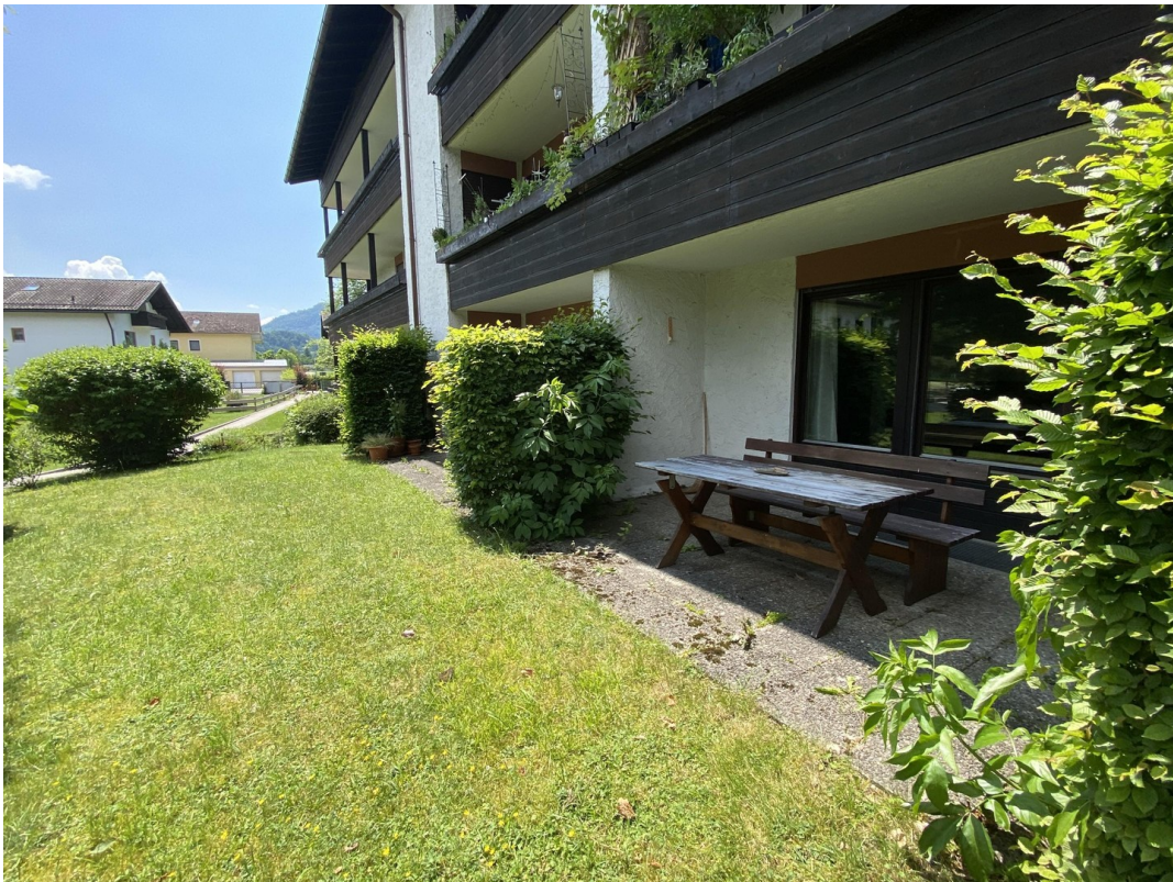
Private Terrasse 3