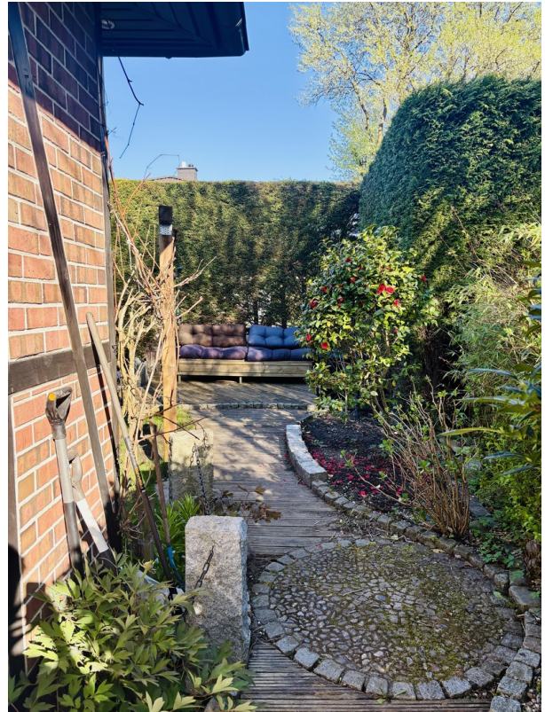
Gemütliche Terrasse 2