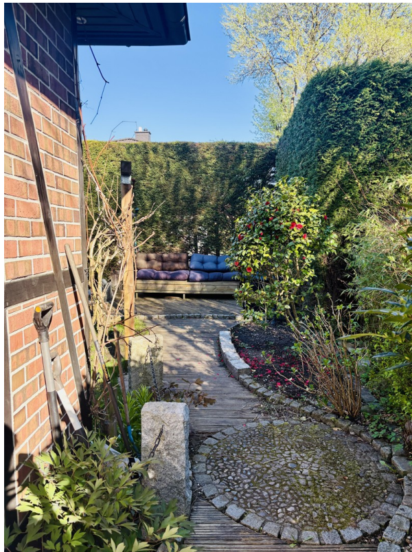
Gemütliche Terrasse 2