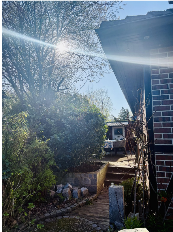
Blick zur Terrasse 1