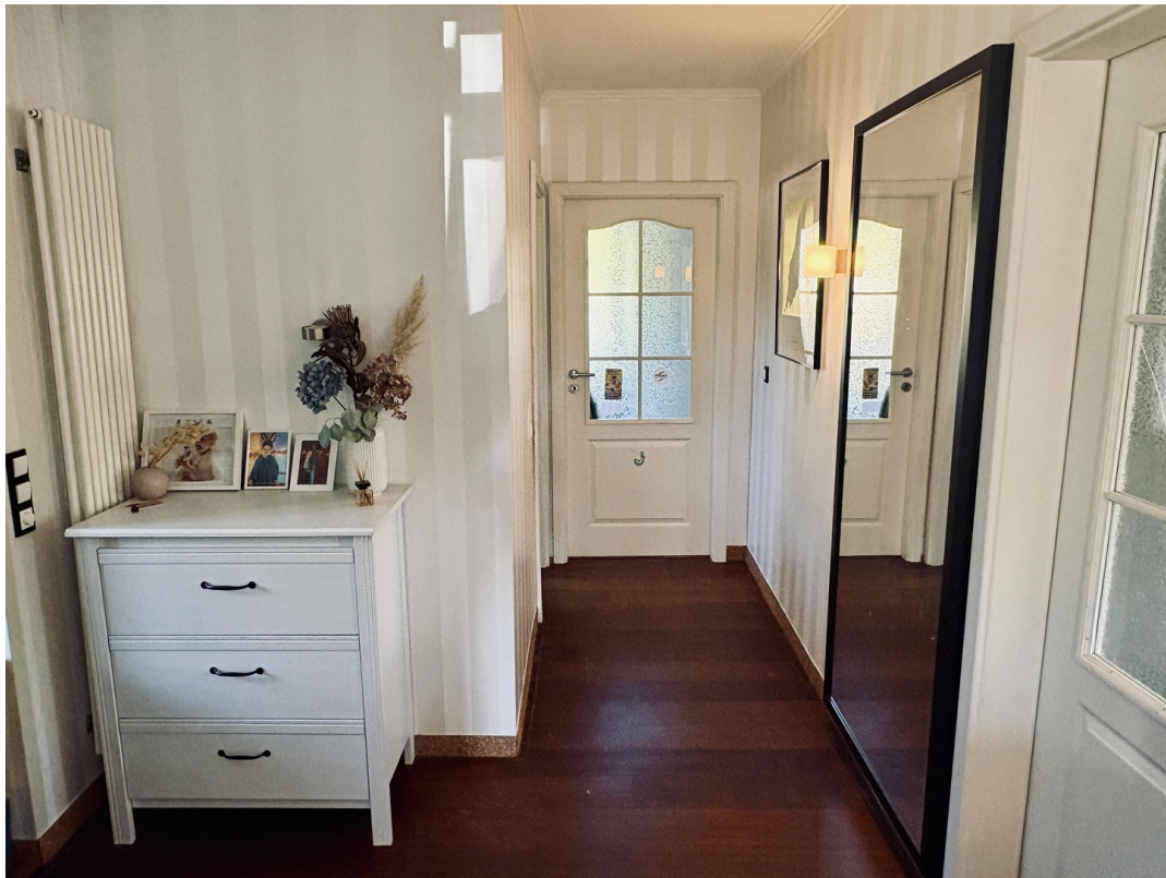
Flur zum Bad und Kinderzimmer