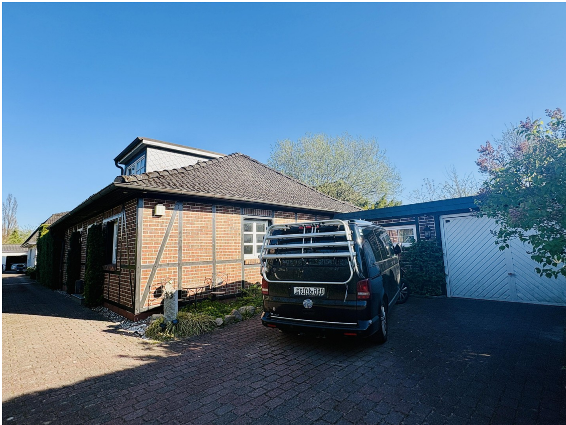
Großzügige Auffahrt und Garage