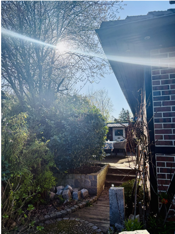
Blick zur Terrasse 1