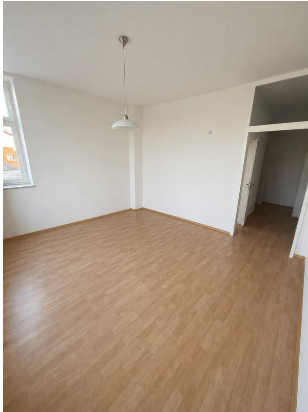
Wohnzimmer mit Küchenbereich