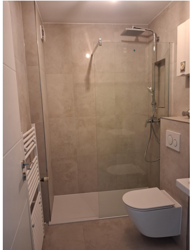
Bad & WC