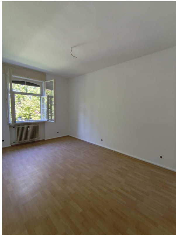
R4 17m2 mit Gartenblick