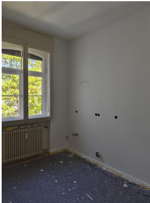
R5 13m 2 im Sanierungsprozess