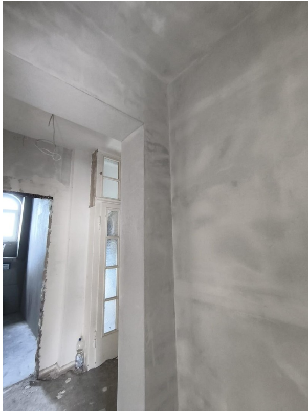
Flur im Sanierungsprozess