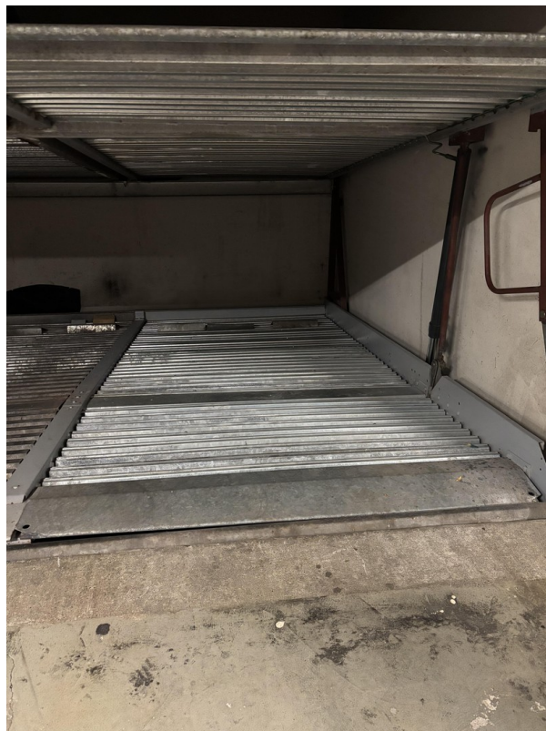
Stellplatz 2 (Duplex)