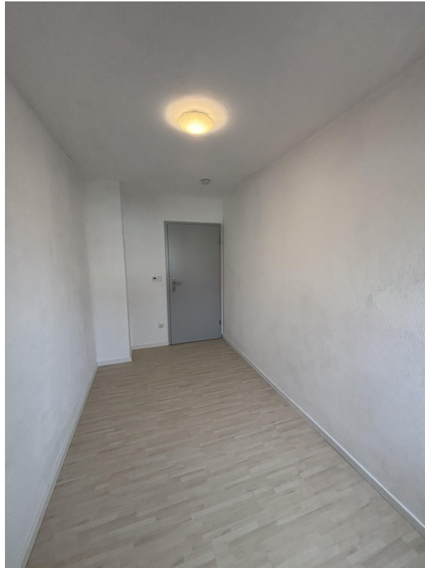
Arbeitszimmer / Kinderzimmer