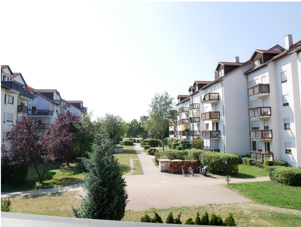
Blick ins Grüne (Sommer)