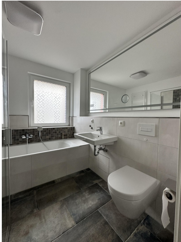
Bad en Suite